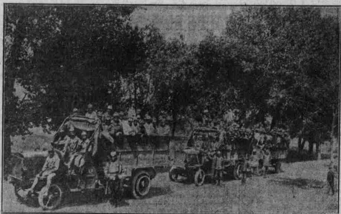
Das Automobil im Kriege: Bei Truppenverhebungen werden ganze Kompagnien in schweren Auto-Lastzügen zur Front befördert.

Ein gewissenhafter Barbier. „Bitte, rasieren Sie mich!“ „Bedauer, heute ist Freitag, da rühre ich kein Fleisch an!“