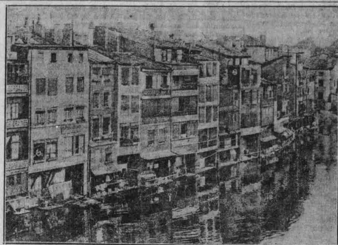
Ansicht von Verdun: Straße an der Maas.

Ein gewissenhafter Barbier. „Bitte, rasieren Sie mich!“ „Bedauer, heute ist Freitag, da rühre ich kein Fleisch an!“