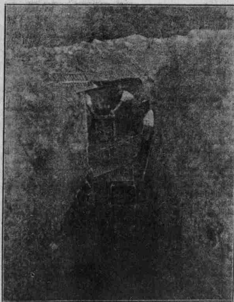
Bei der Arbeit in einem Stollen der Schanze „Kronprinz“ bei Verdun.