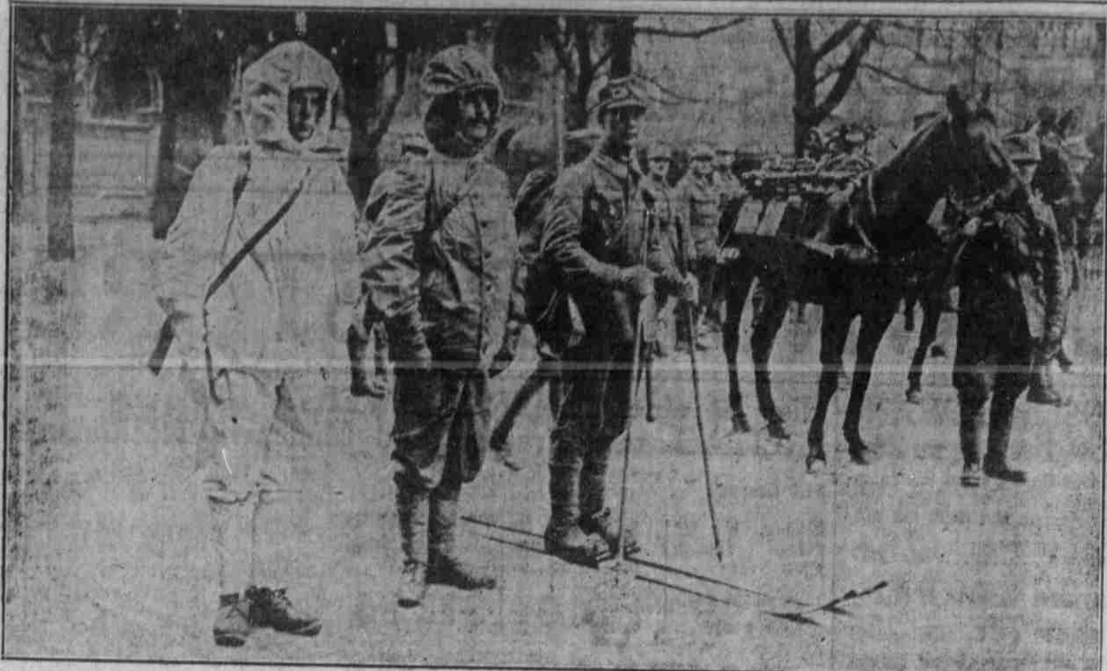
Deutsche „Eki-Brigaden“ an der Ostfront. Eine der Abteilungen in der hellen Uniform, die bei Dienstleistungen getragen wird.