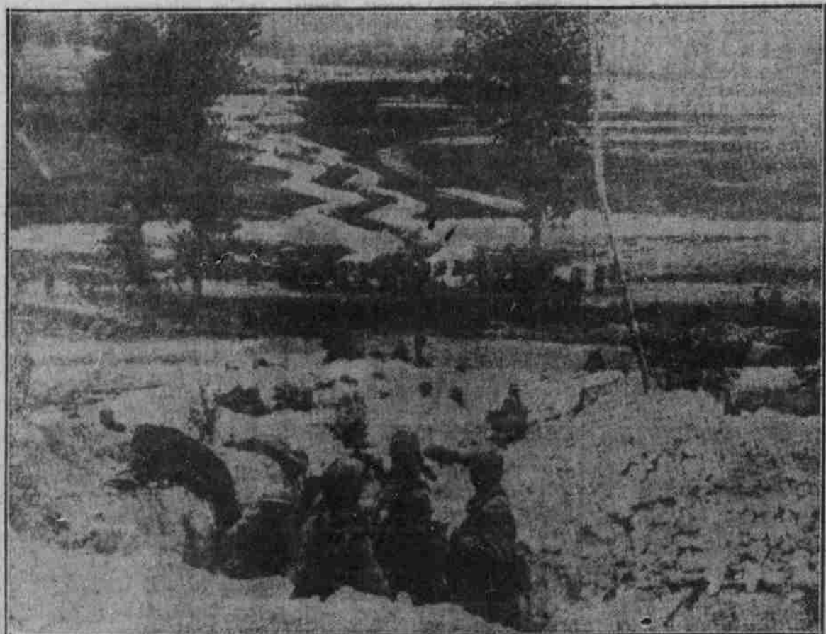
Von der französischen Front in der Champagne: Aufnahme eines Verbindungs-Schlützengrabens.