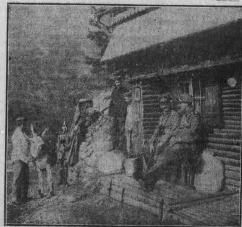
Ein malerischer Offiziersunterstand, 600 Meter vorm Feinde.