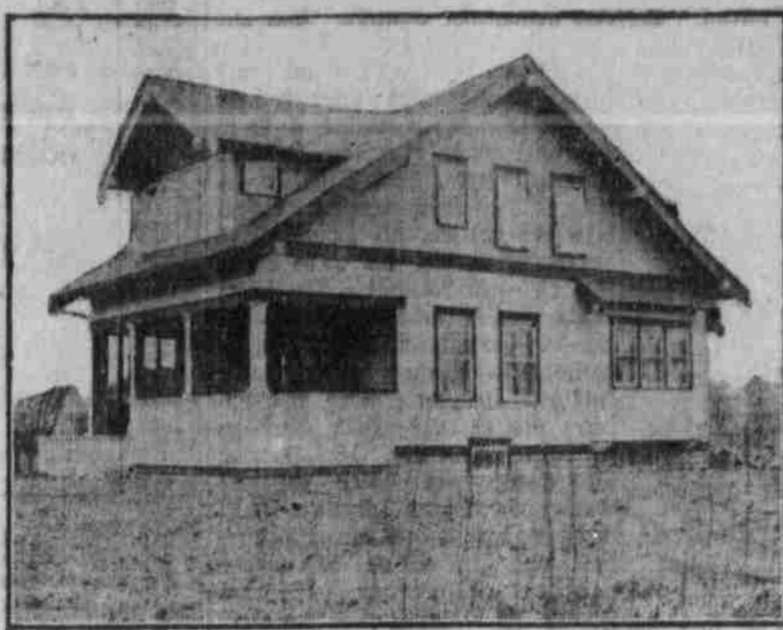
Perspektivansicht nach einer Photographie.