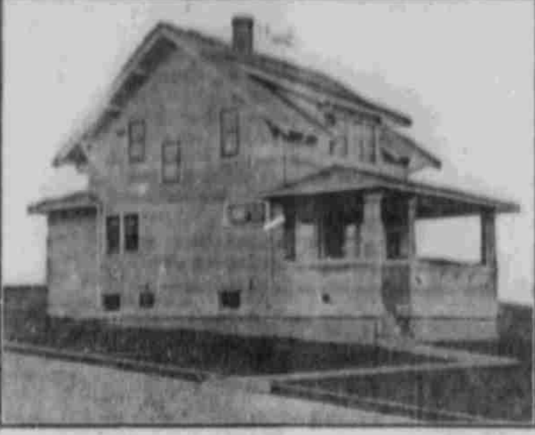
Perspektive Ansicht — Von einer Photographie.