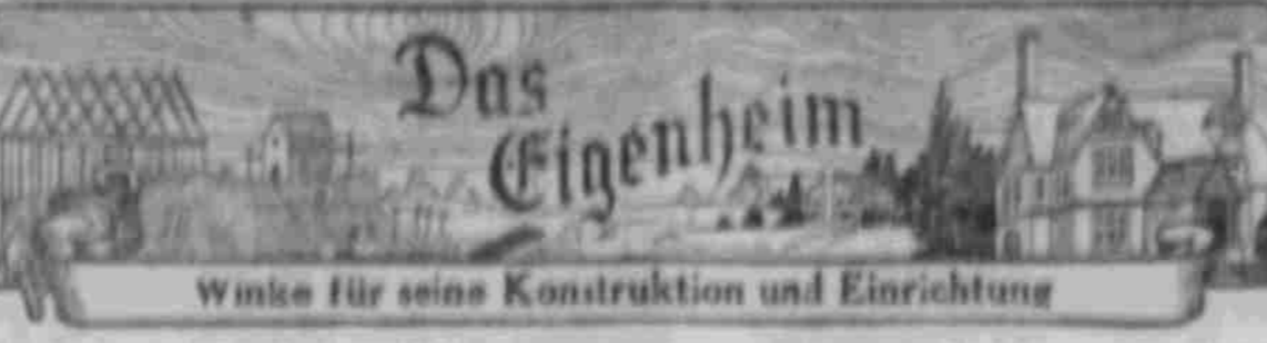
Winke für seine Konstruktion und Einrichtung