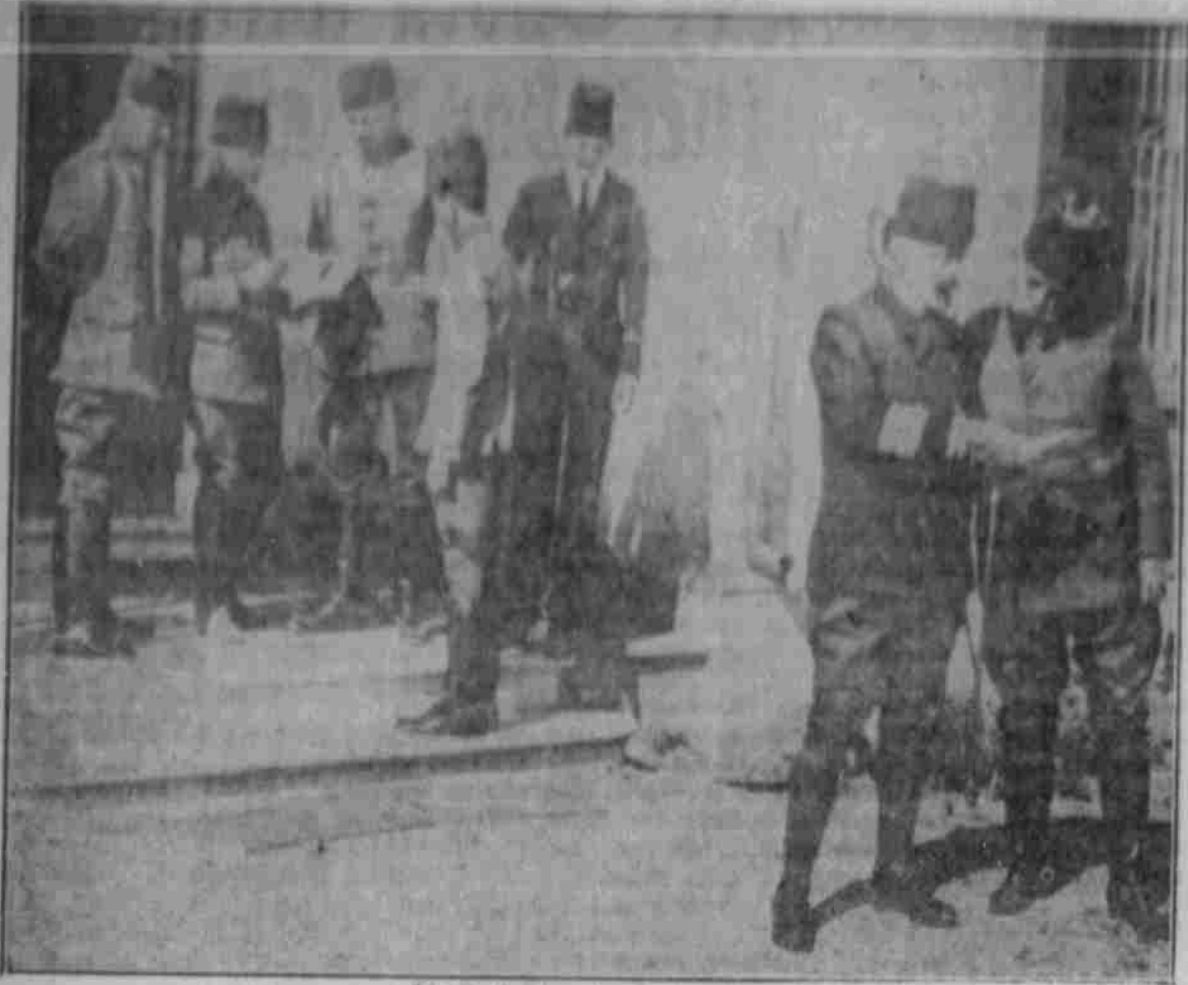
Die Verteidiger des Dardanelles.