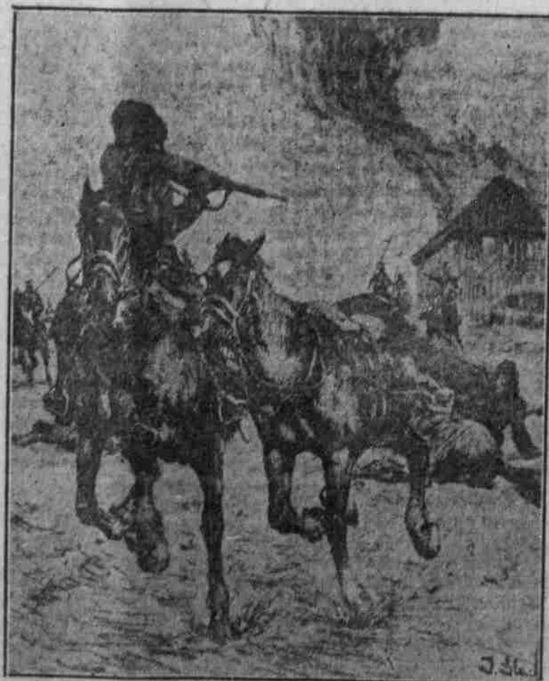
Befolgung plündernder Kosaken durch eine Kavalleriepatrouille