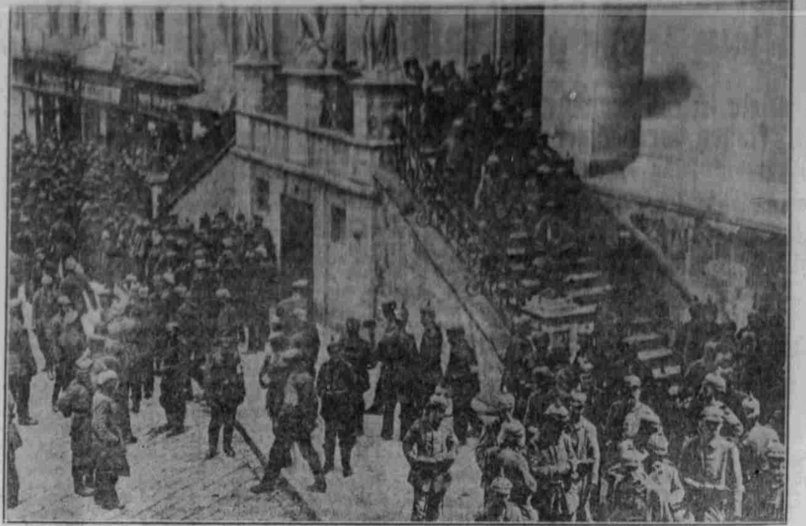
Der erste Gottesdienst in dem wiedereroberten Przemysl.