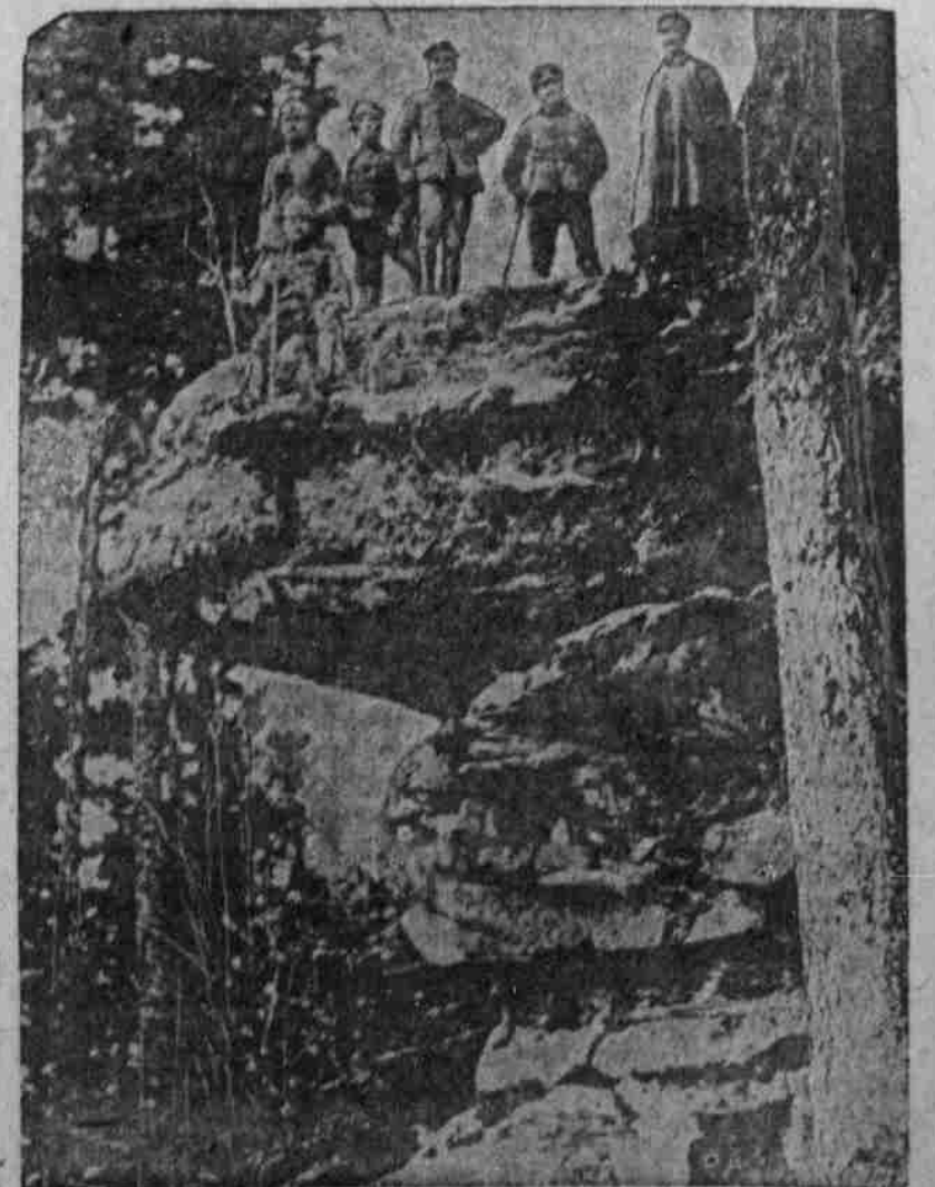
Wagenpartie im Wagenwald (Bogesen).