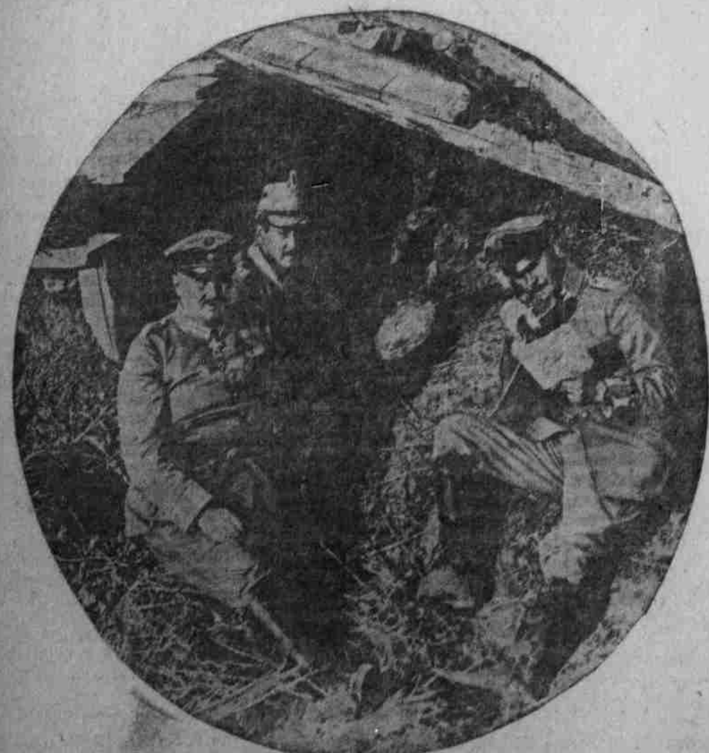
Prinz Albrecht Friedrich (links) vor seinem Unterstand auf dem östlichen Kriegsschauplatz.