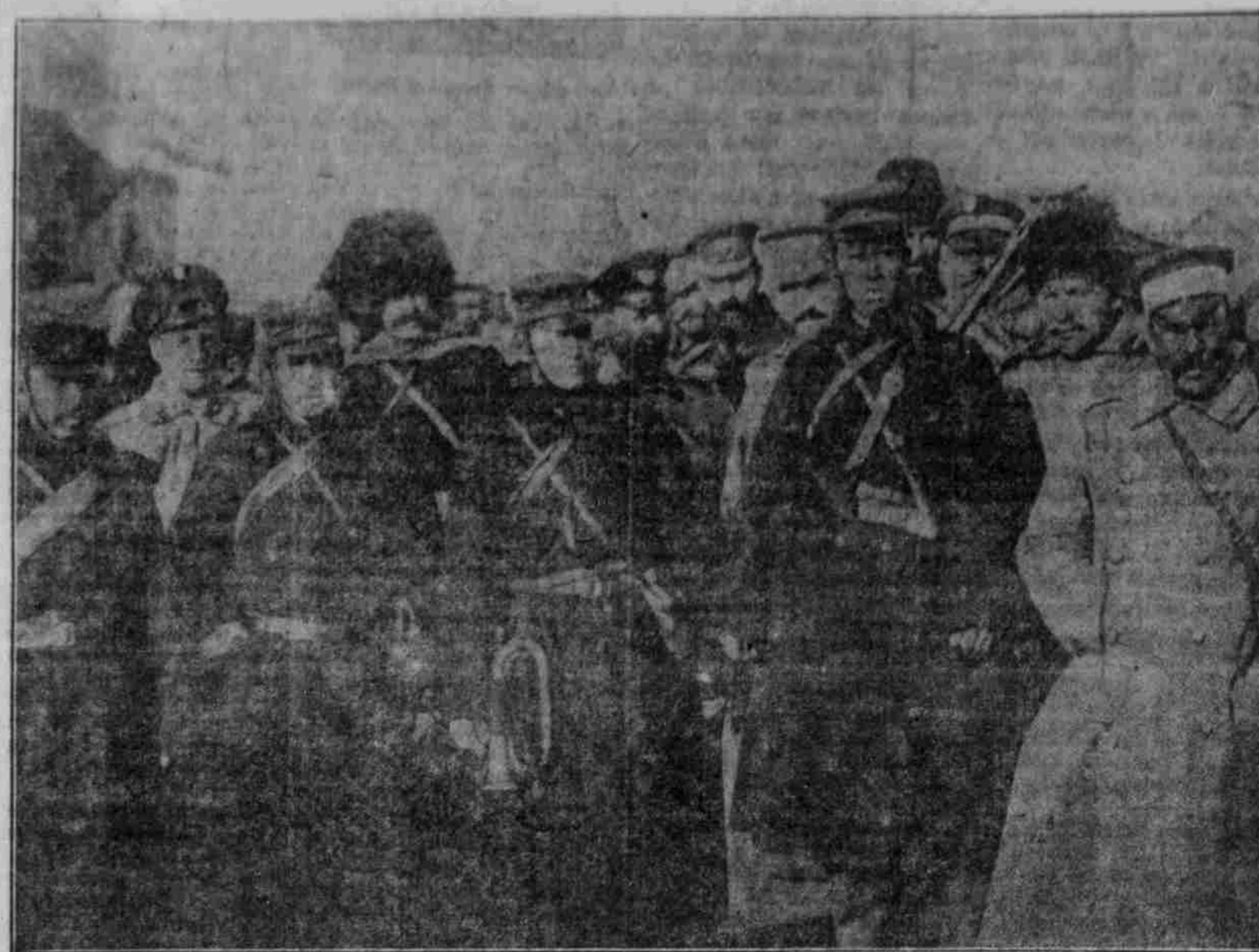
Auf der Feindes Seite: Japanische Soldaten bei den russischen Truppen.