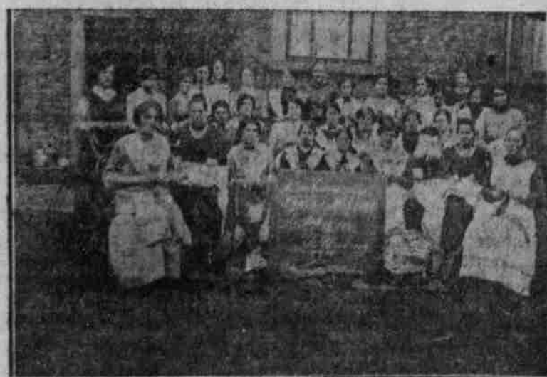
Kriegs-Nährstube einer kleinen deutschen Ortschaft.