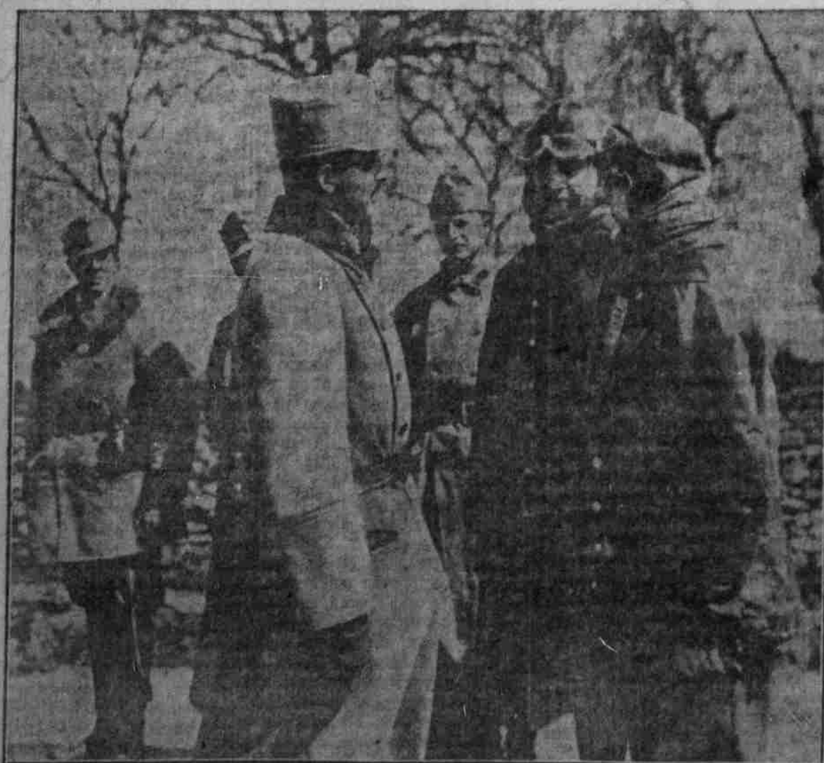
Der Österreichische Thronfolger Erzherzog Karl Franz Joseph.

1745 deutsche Juristen und aus der Intelligentsia hervorgegangene Reichs- und Verwaltungsbeamte sind nach einer Zählung der „Deutschen Juristen-Zeitung“ bis zum 25. Juni im Kriege gefallen. Darunter befinden sich 8 Rechtslehrer, 374 Regierungs- und Verwaltungsbeamte, Richter, Staatsanwälte, 323 Rechtsanwälte, 435 Professoren, 605 Referendare.