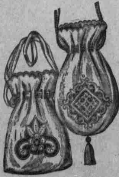
Abbildungen 5 und 6.