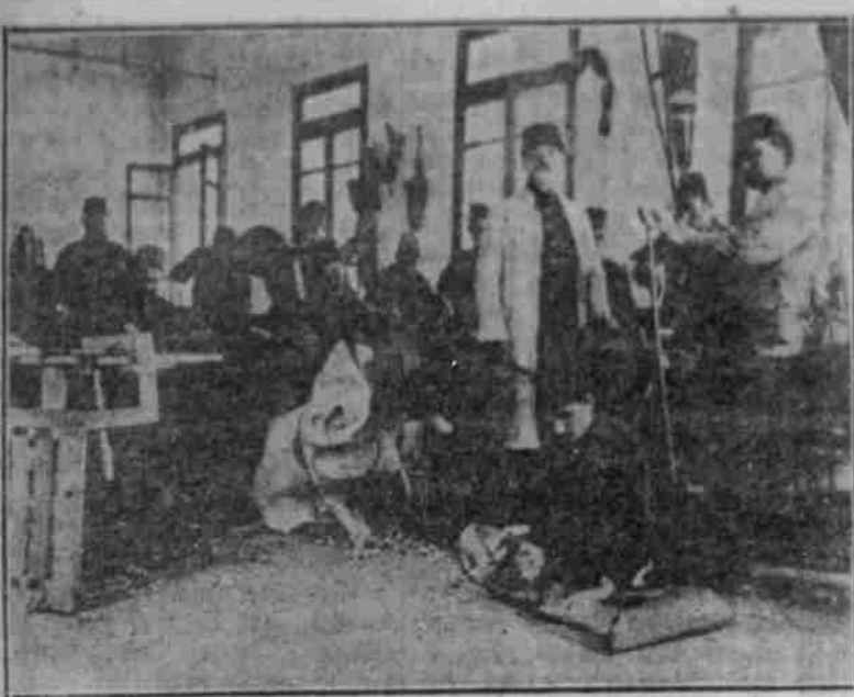
Werkstätte im Militärspital von Gähau.