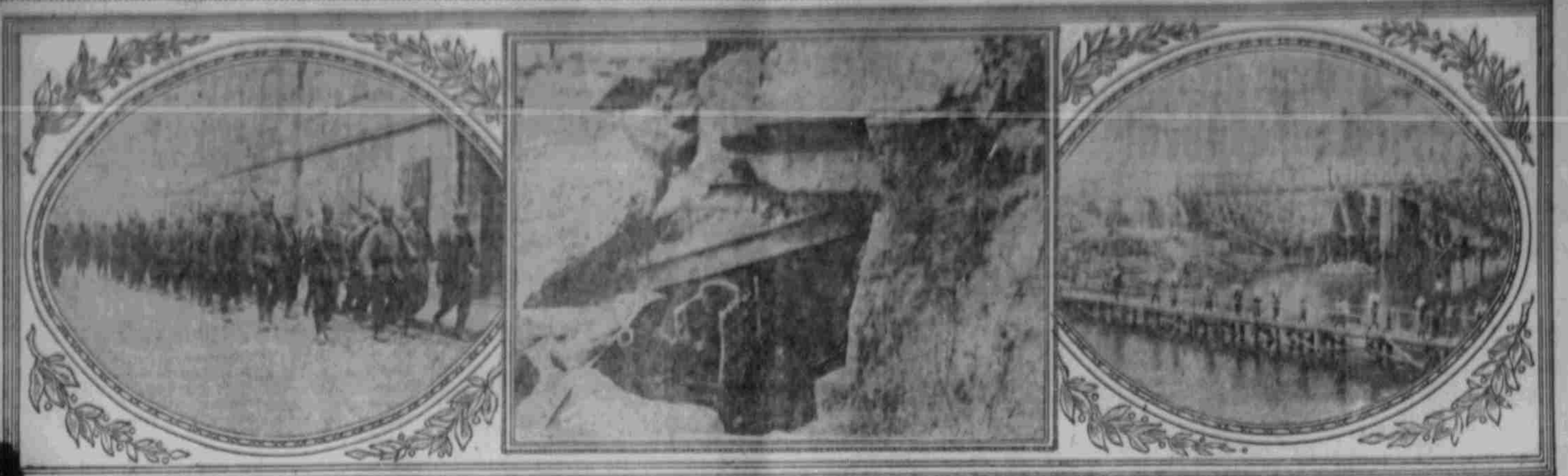
Die preussische Garde in Przemyśl.