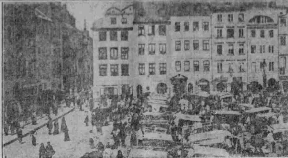
Der Markplatz von Warschau.