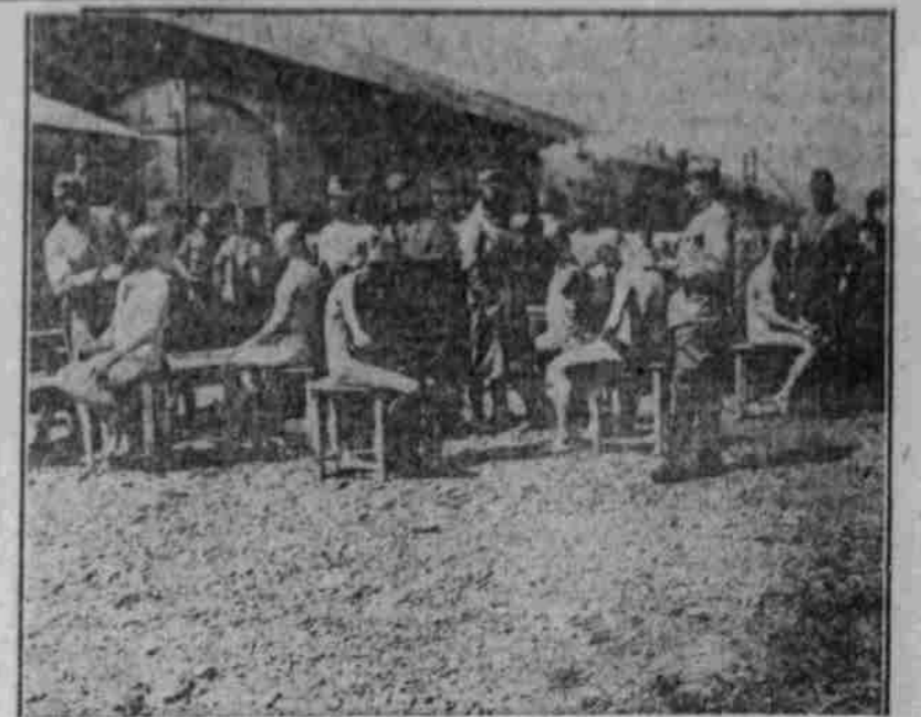
Die Säuberung der Soldaten, russische Gefangene nehmen den Soldaten die Bärte ab und schneiden ihnen die Haare.