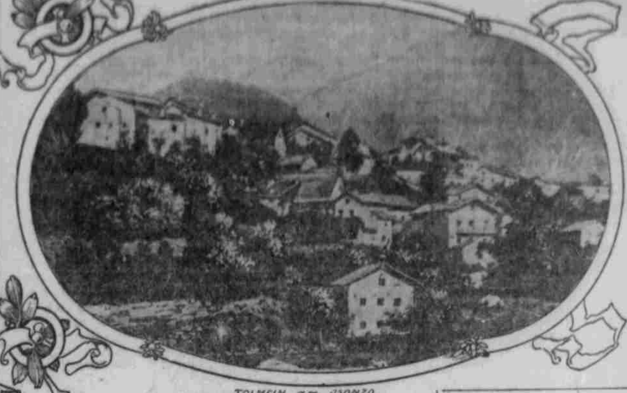
TOLMEIN am ISONZO.

Die Isonzofront liegt am Fuß des Trentino ein, an dem Österreichs größte Festungslinie liegt und ungeschützt auf einer Landzunge liegt, die ins Meer vorragt. Die Häuser der Trichter Nordseite fließen bereits die Berge hinauf.