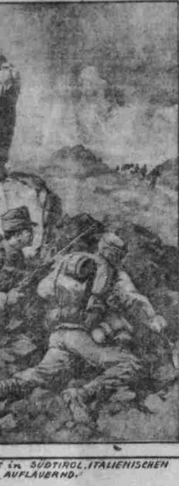
ÖSTERREICHISCHE PATROUILLE IN SÜDTIROL, ITALIENISCHEN ALPEN, AUF LAUFERN.

Die Isonzofront liegt am Fuß des Trentino ein, an dem Österreichs größte Festungslinie liegt und ungeschützt auf einer Landzunge liegt, die ins Meer vorragt. Die Häuser der Trichter Nordseite fließen bereits die Berge hinauf.