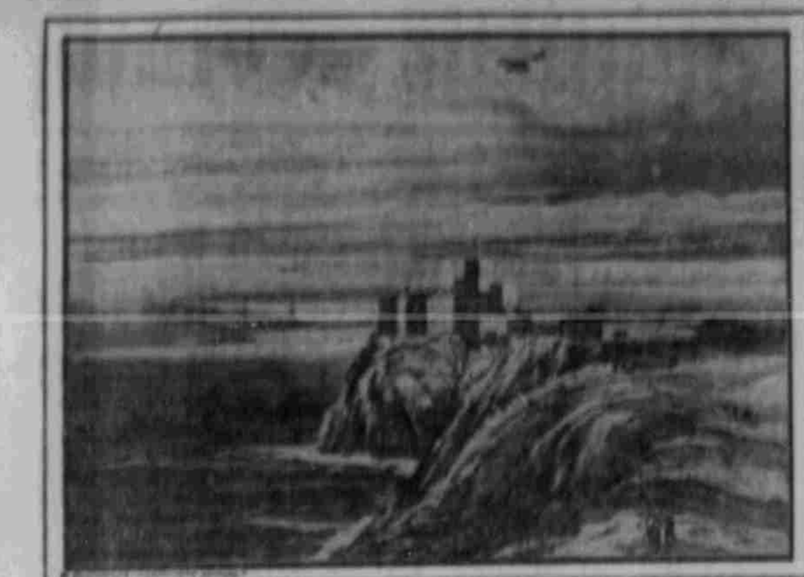
Die Isonzo-Front mit dem Juvonzo-Tal

Die Isonzofront liegt am Fuß des Trentino ein, an dem Österreichs größte Festungslinie liegt und ungeschützt auf einer Landzunge liegt, die ins Meer vorragt. Die Häuser der Trichter Nordseite fließen bereits die Berge hinauf. Die Isonzofront liegt am Fuß des Trentino ein, an dem Österreichs größte Festungslinie liegt und ungeschützt auf einer Landzunge liegt, die ins Meer vorragt.