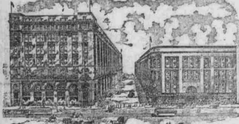
Eine Ansicht der Brandeisläden in Omaha.