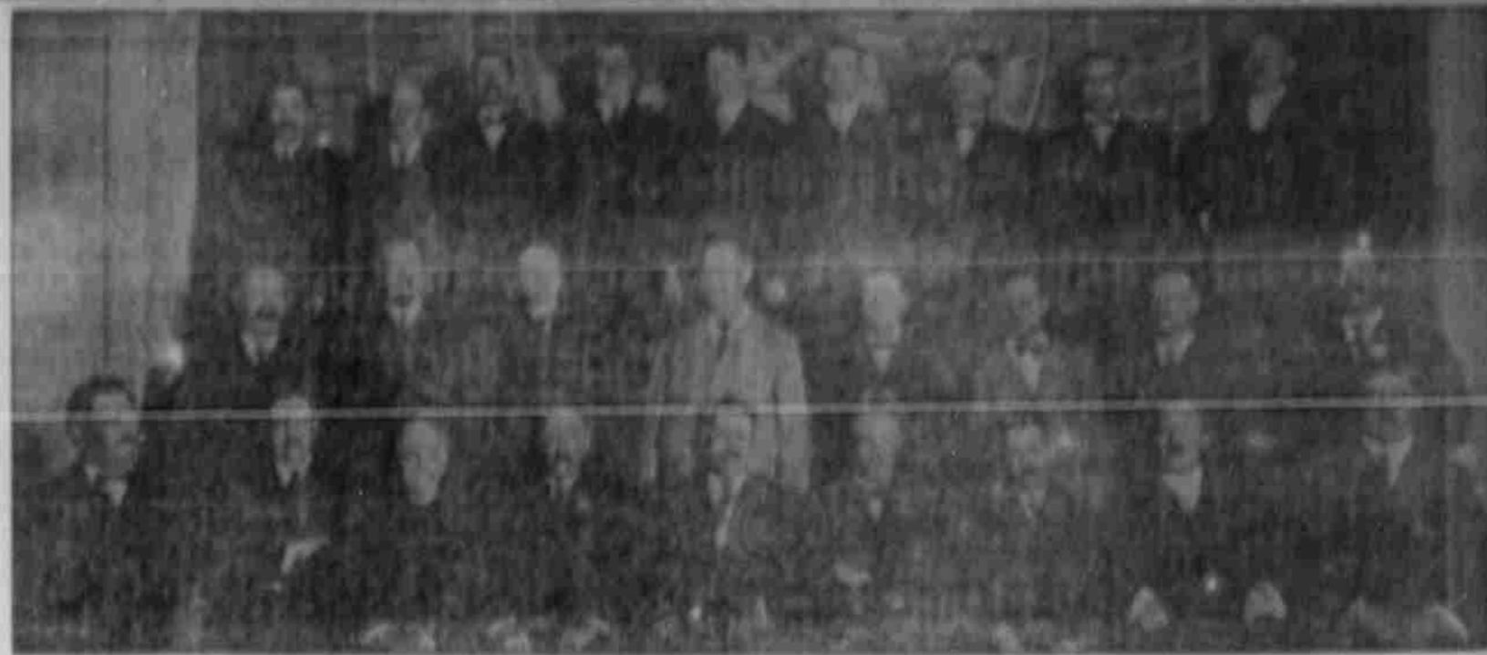
Mitglieder der Omaha Sängergesellschaft.

Der Feind hat sich in Council Bluffs, Neb. in einem Versteck in einem Keller, unter dem Haus, versteckt. Er hat sich dort versteckt, um die Besatzung zu überfallen. Er hat sich dort versteckt, um die Besatzung zu überfallen.