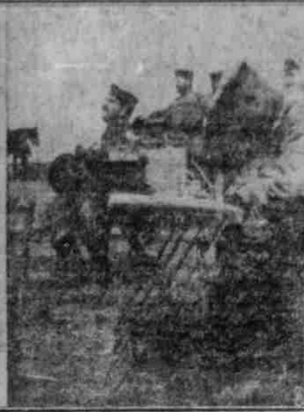
Telephonische Verbindung mit einem Festungsbatterien.