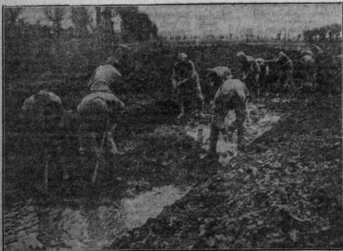
Unsere Soldaten ziehen zur Verstärkung der Stellungen vor den Stachelverhauenen Wassergräben.