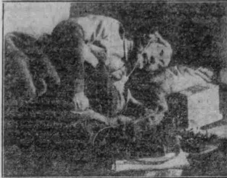
Steis bereit — selbst während eine Ruhepause.