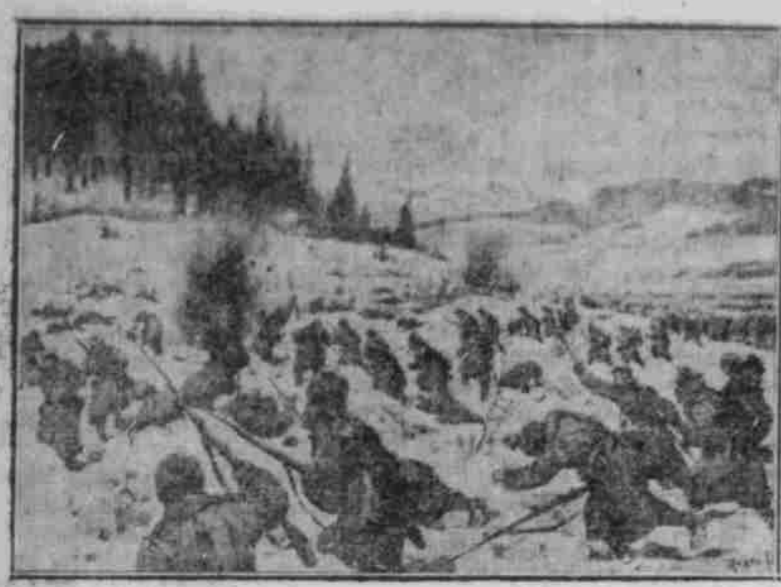
Bei den Kämpfen am Tuka-Pass. Angriff russischer Infanterie auf eine von österreichisch-ungarischen Truppen besetzte Höhe.