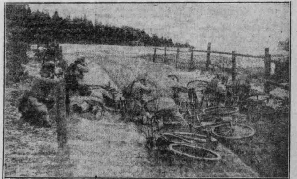
Die Räuber am Feind: Radfahrerpatrouille im Feuer.