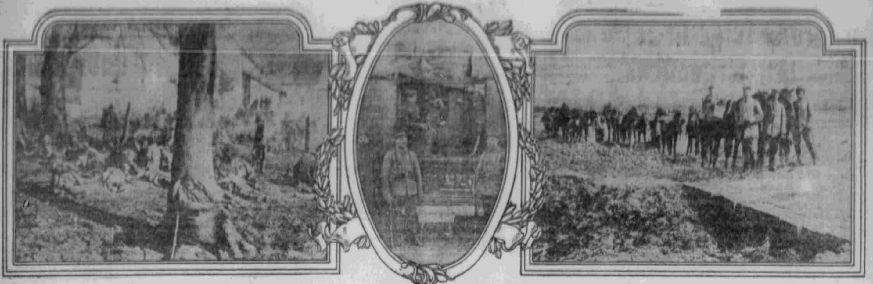
Feldmarschall der Österreichisch-ungarischen Truppen in den Karpathen.