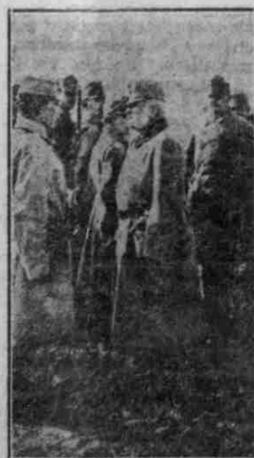
Feldmarschall Fitzjeger Friedrich inspiziert eine Infanterieabteilung im Jüdische Dienstleistungen in einer der von den Österreichern besetzten Dörfern auf dem österreichisch-russischen Grenzgebiet.