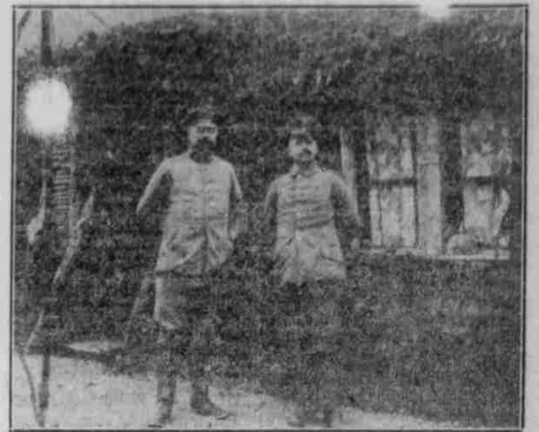
Offiziers Quartier in den Regionen.