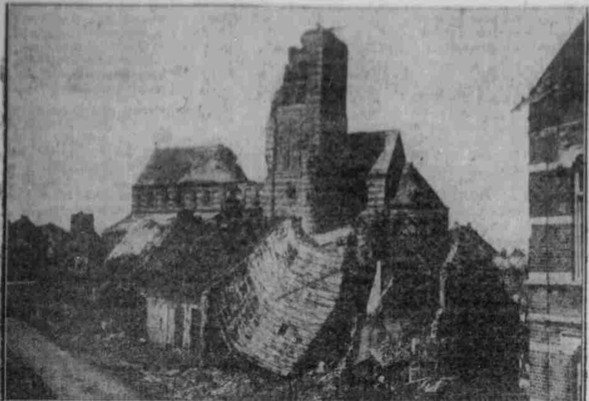
Kirche und Häusergruppe in Laaschendale (Westflandern), von der französischen und englischen Artillerie zusammengepöbelt.