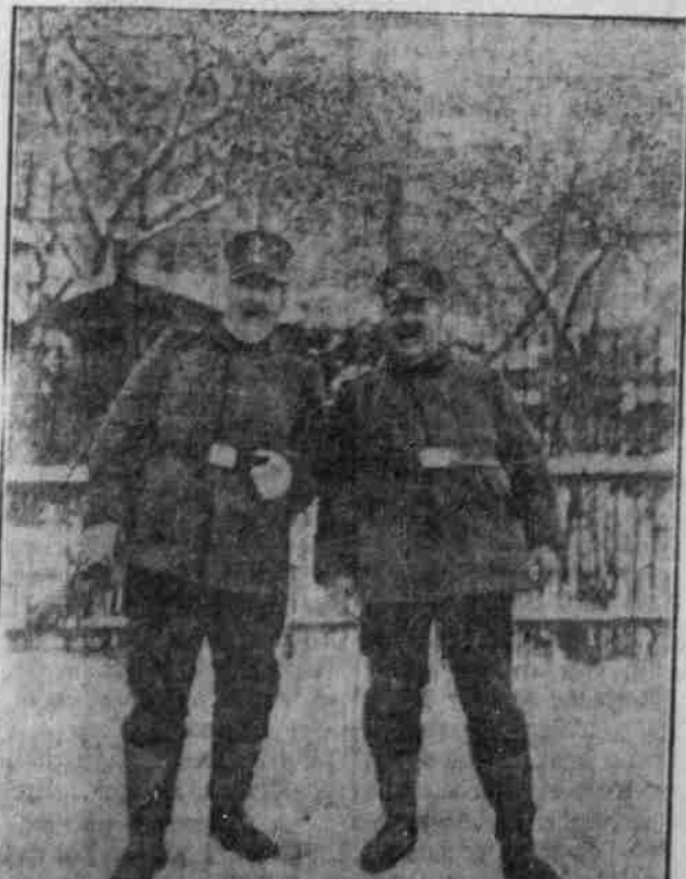
Was? Aus soll Engländer aushungern lassen? Ach nee!