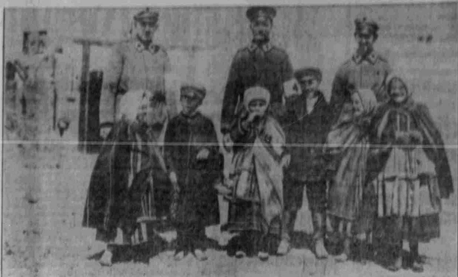
Die Generale: Polnische Kinder mit deutschen Sanitätern bei Kowles.