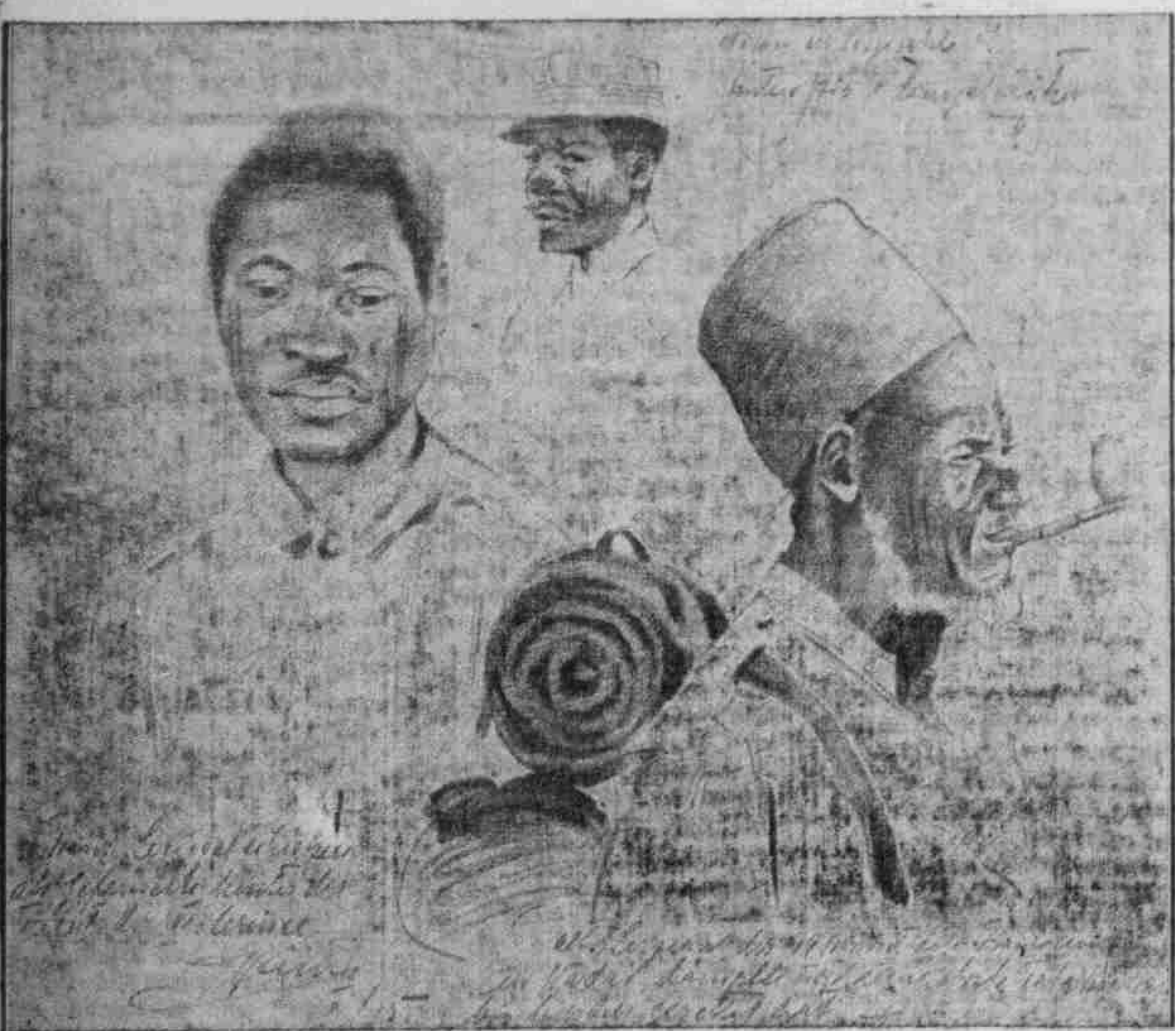
Frankreichs Vorkämpfer: Senegalesische Soldaten hinter der Front der 6. Armee gezeichnet von Kaiser Ernst W. Heind.

Ein Kriegsoffer. Der königliche Oberstallmeister v. Haugl, der bei einem Liebesgabentransport im vorigen Herbst von den Russen gefangen genommen wurde, ist kürzlich an einem Nierenleiden in Taschkent gestorben. — Das moderne französische Schnellfeuer-Feldgeschütz gibt 16 bis 20 Schuß in der Minute ab gegen früher 2. Das Problem der Munitions-Lieferung... And Lloyd George can't do it!