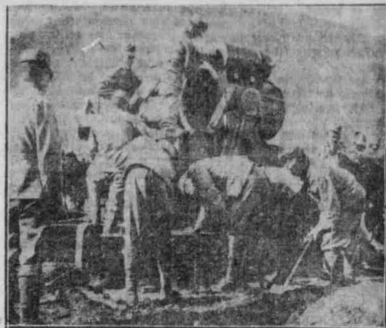
Arbeiten bei der Aufstellung unserer 30,5-Zentimeter-Mörser in einer neuen Position.