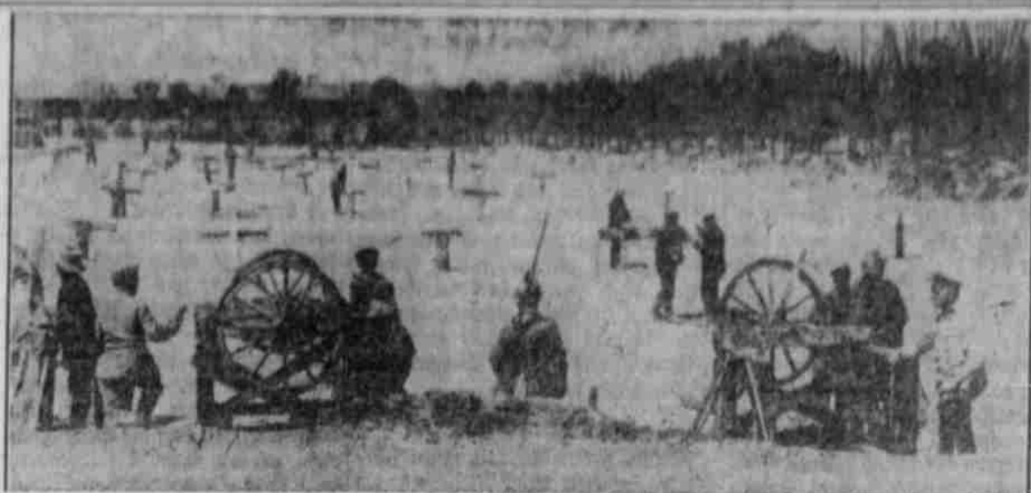
Ein im Felde errichtete Drehgießerei, in der russische Gefangene als Arbeiter beschäftigt werden.