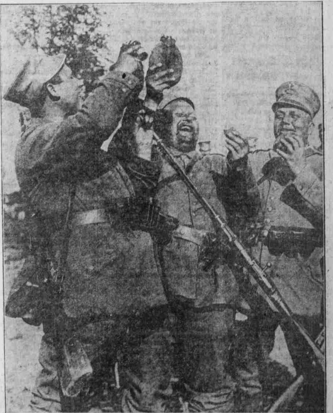
Eine kleine Siegesfeier in den Karpaten.

Deutsche Landsturmleute, denen man einen Erfolg der Aushungerungspläne unserer Feinde nicht ansieht, bei Frühling auf einem Schlachtfelde in den Karpaten.