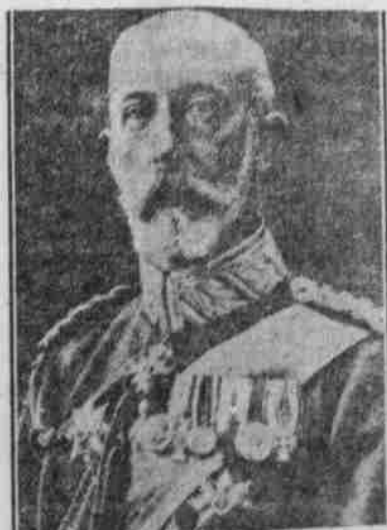
General Graf von Bismarck, der Führer der bayerischen Truppen, die den Zwinin erkämpften.

— Auf englischen Kriegsschiffen gehörte früher der „master trumpeter“, der Trompeter zum Offizierskorps.