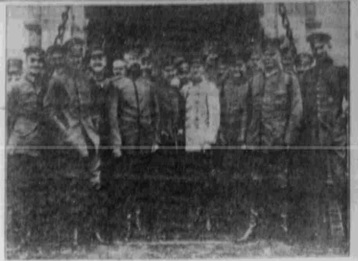
General der Kavallerie von der Marwitz (X), deutscher Kommandopostführer in den Karpaten mit seinem Stabe.