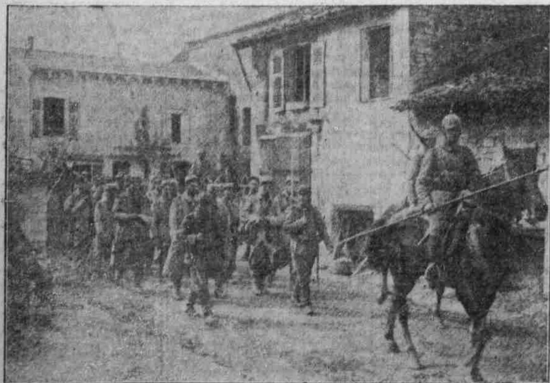
Französische Gefangene aus dem Bois d'illy auf dem Marsch durch Bignevilles.

Büdeburg gebracht worden waren. Man nimmt an, daß die Foden eine Verbreite-ung im Fürstenthum nicht finden wer-den. — Der erste preussische Admiral, Prinz Albrecht, führte nicht den Titel Admiral der preussischen Flotte, sondern „der preus-sischen Küste“.