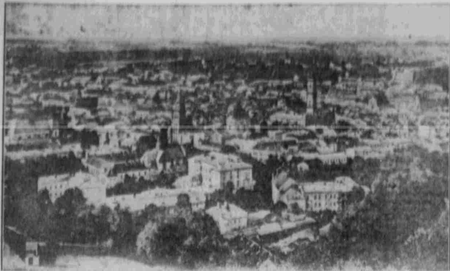
Die von den Hochländern zurückeroberte galizische Hauptstadt Lemberg.