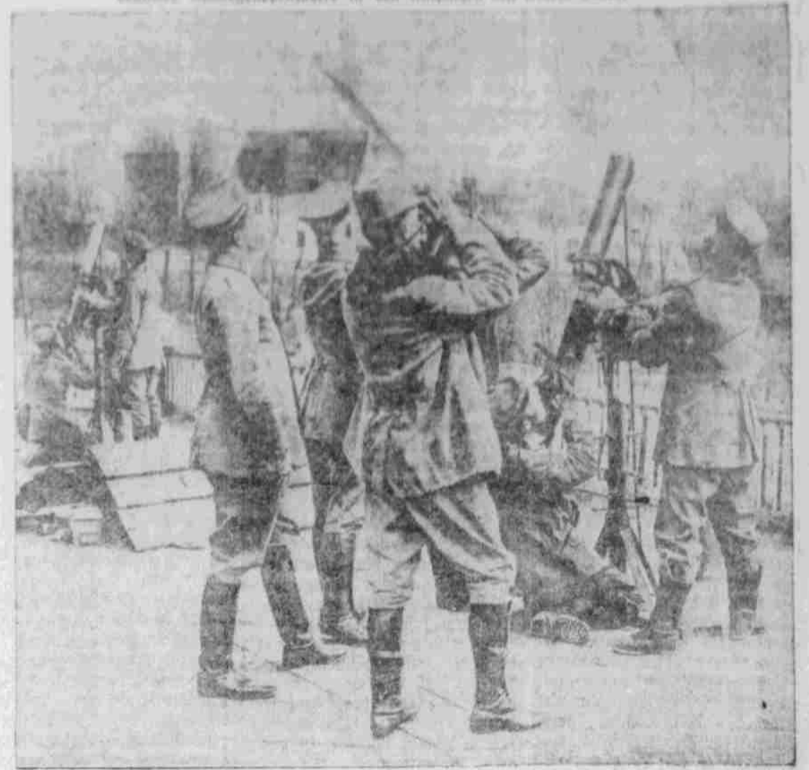
Belichtung eines russischen Fliegers durch deutsche Maschinengewehre in Ostizien.