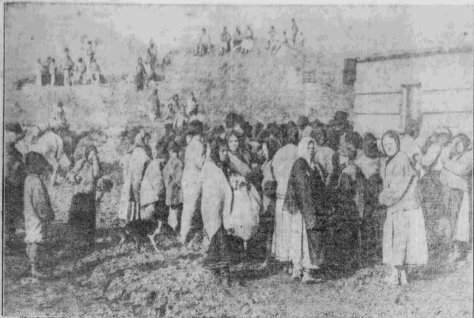
Brot- und Salzverteilung an die Bewohner des Ung-Thales.