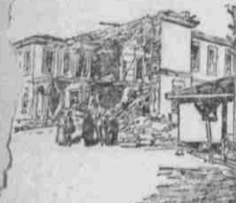
Die beiden Freunde.