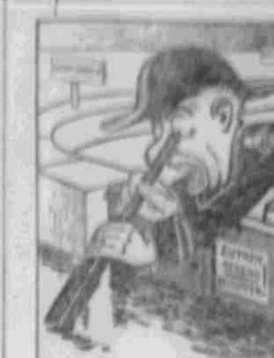
Ein Werk des Zufalls.