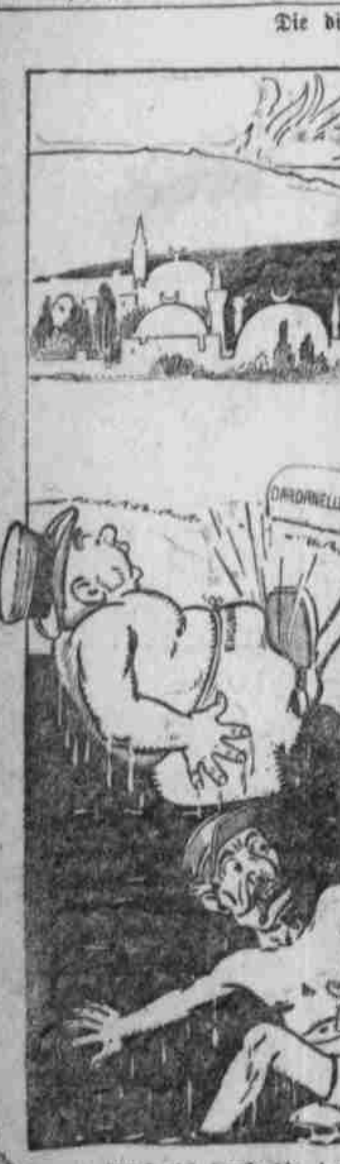
2. In an: Allah, ich danke dir, daß du die Konstantin da unten nicht durch...