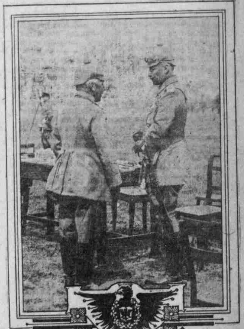
Kaiser Wilhelm und General von Emmich auf dem östl. Kriegsschauplatz.