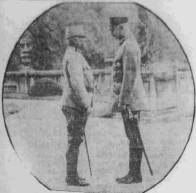
Erzherzog Friedrich von Oesterreich, der Generalstabschef der I. n. I. Armee, mit dem deutschen Generalstabschef Eggelleng v. Falkenhayn.