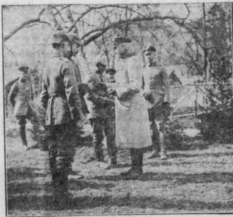
Ueberreichung von Eisernen Kreuzen.