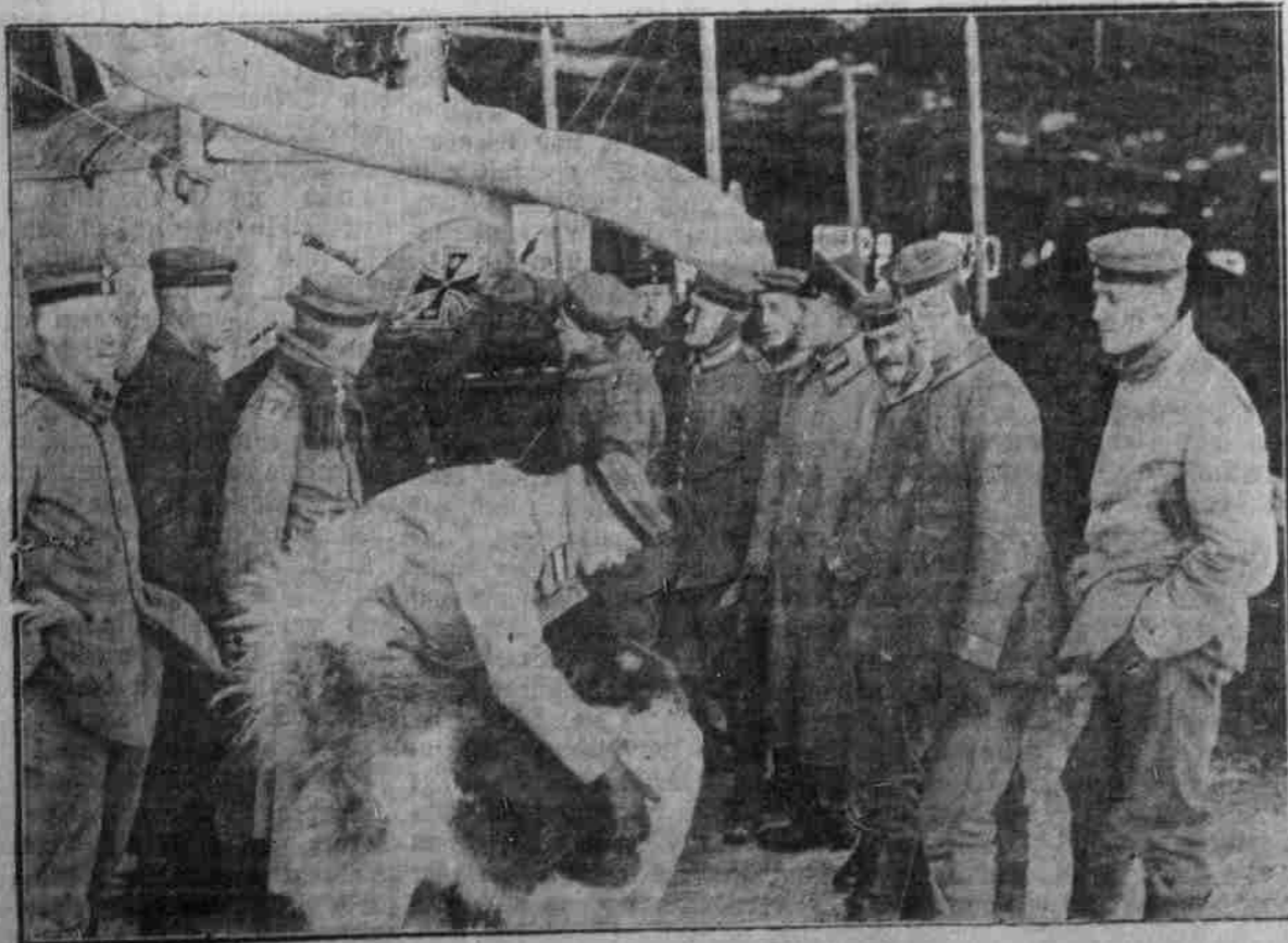
Der Aeroplan wird mit dem Eisernen Kreuz geschmückt.