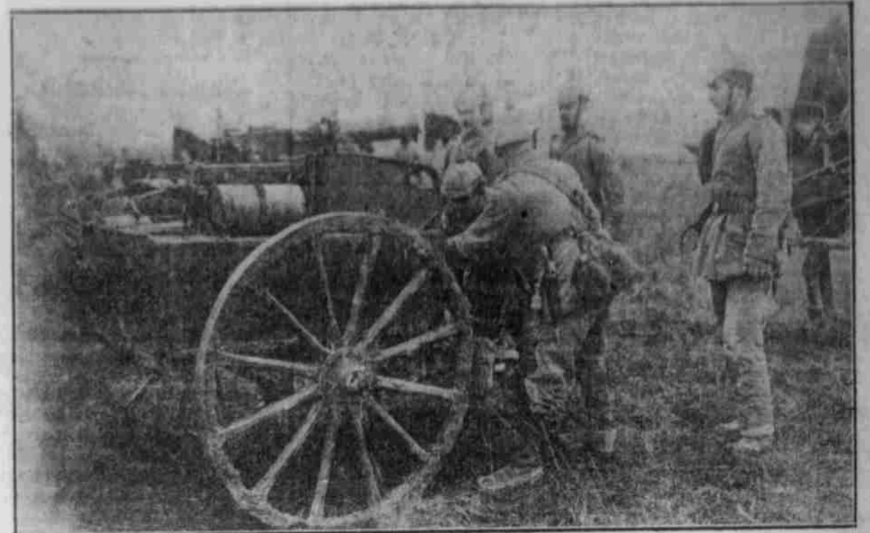
Die leichte Artillerie auf dem westlichen Kriegsschauplatz.