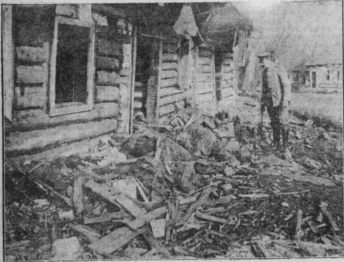
Wurfung einer deutschen Bombe in Gorlice.