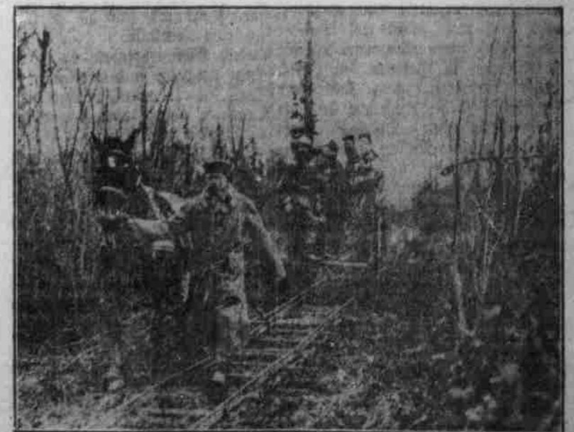
Eine militärische Pferdebahn.