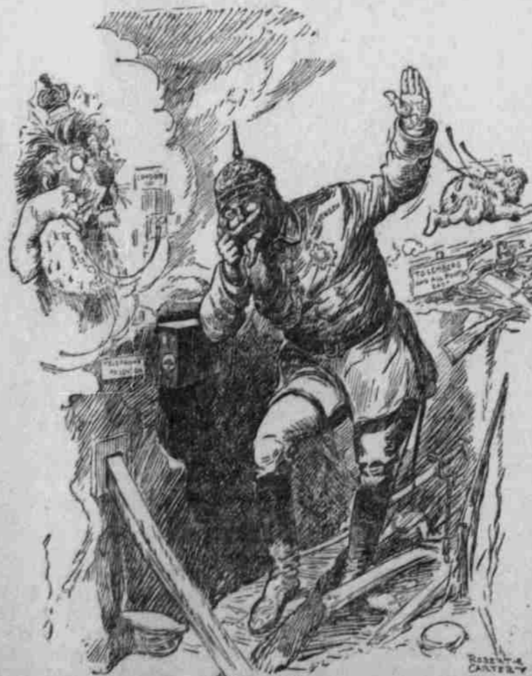
ENGLAND—"NOT PRUSSIA, RUSSIA!" VON MACKENSEN—"ACH, RUSSIA HAS JUST STEPPED OUT!"