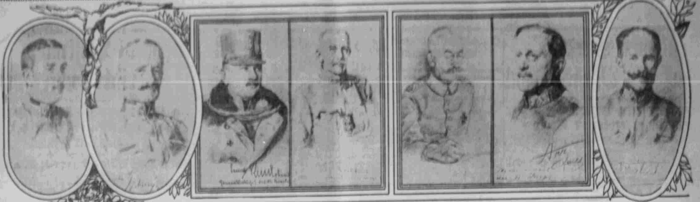
Chef-Kommandeur von Warden, Generalstabschef des IX. Korps.

An der Front nach dem Leben gezeichnete Porträts von Professor Torggler.