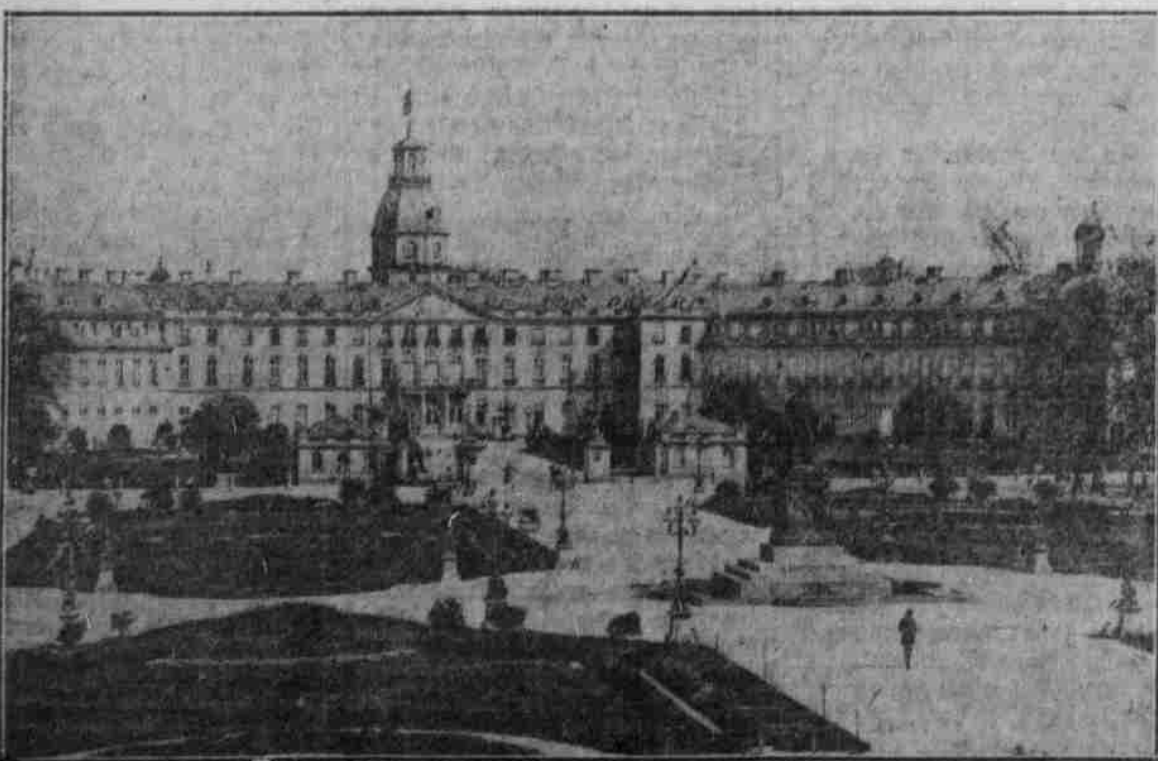
Großherzogliches Residenzschloß in Karlsruhe.