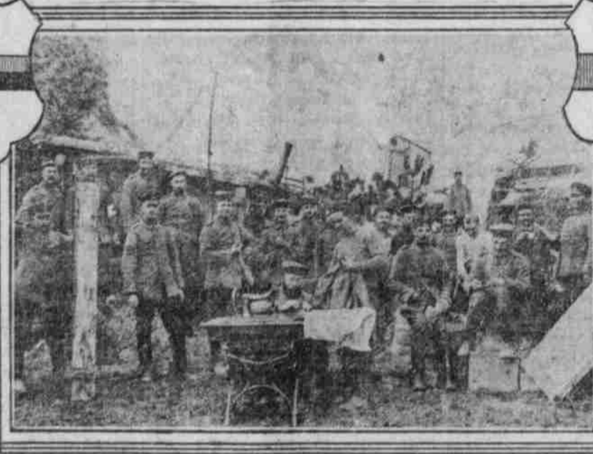
Der Kompagnieschneider in Frankreich.