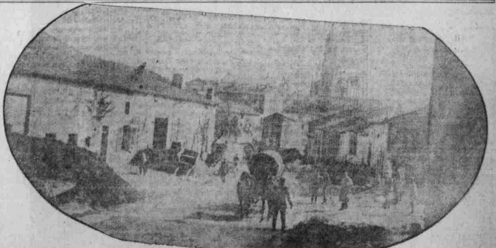
Die Deutschen in der französischen Ortschaft Fannes, westlich von Pont-à-Mousson.