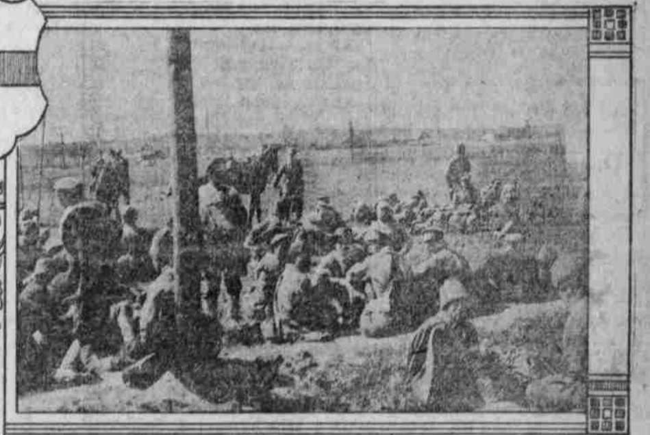
Russische Gefangene an der Ostfront.