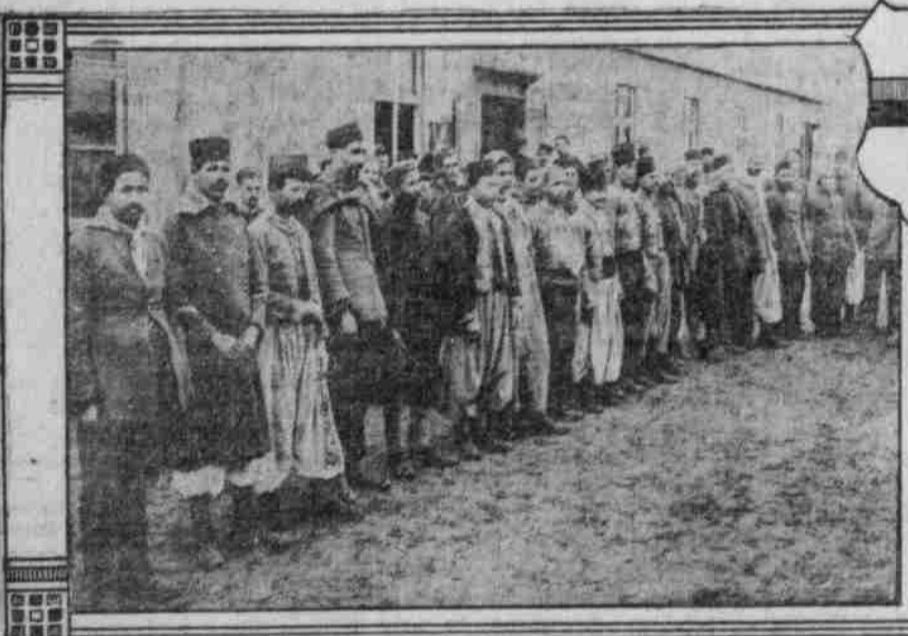
Typen französischer Gefangener im Sennelager.