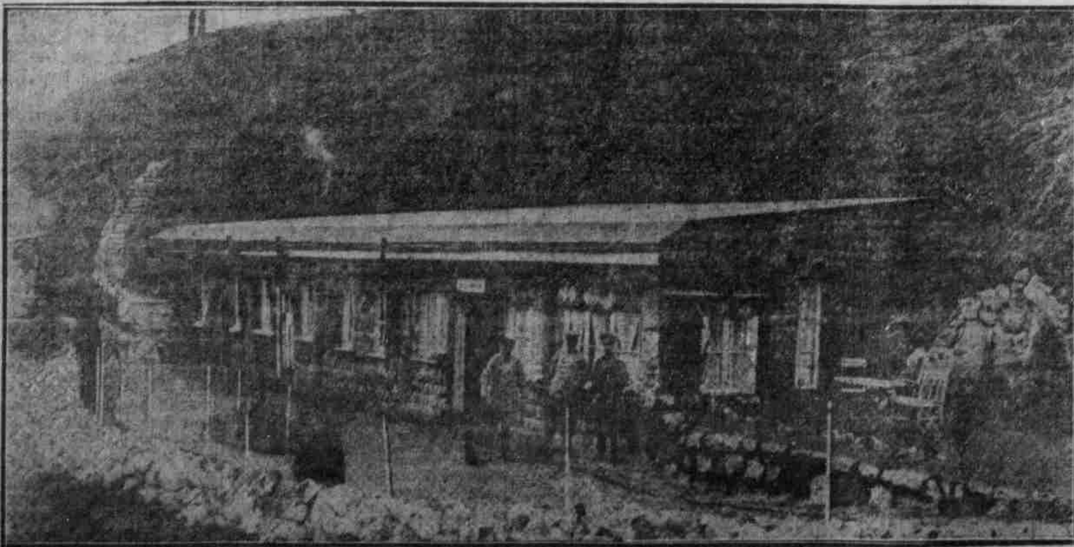
Ein von unseren Soldaten in Frankreich erbautes Landhaus mit 6 Zimmern und Küche.