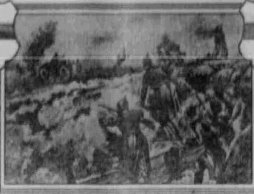
Abfangen eines russischen Automobils.