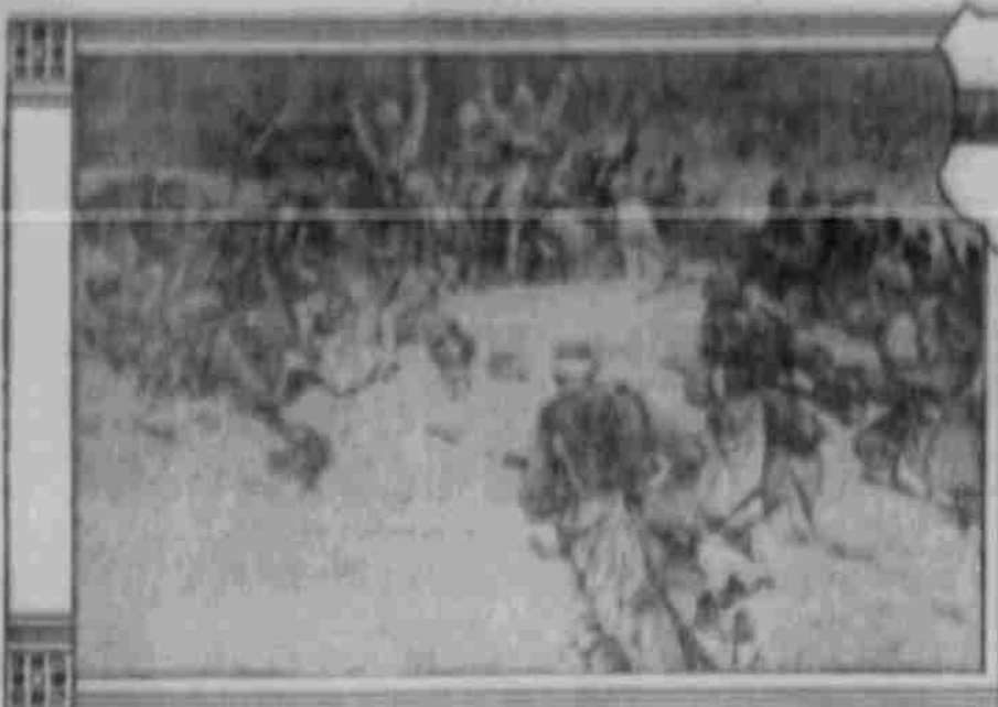
Ueberumpelung sibirischer Artillerie in Nord-Polen.

Epitaphen, die den Schlachtern stift festgehalten hat.