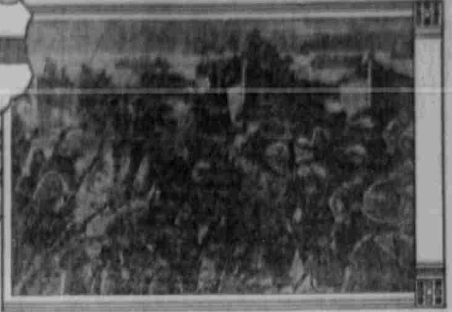
Die Türken treiben die Allierten bei Kum-Kate in's Meer.