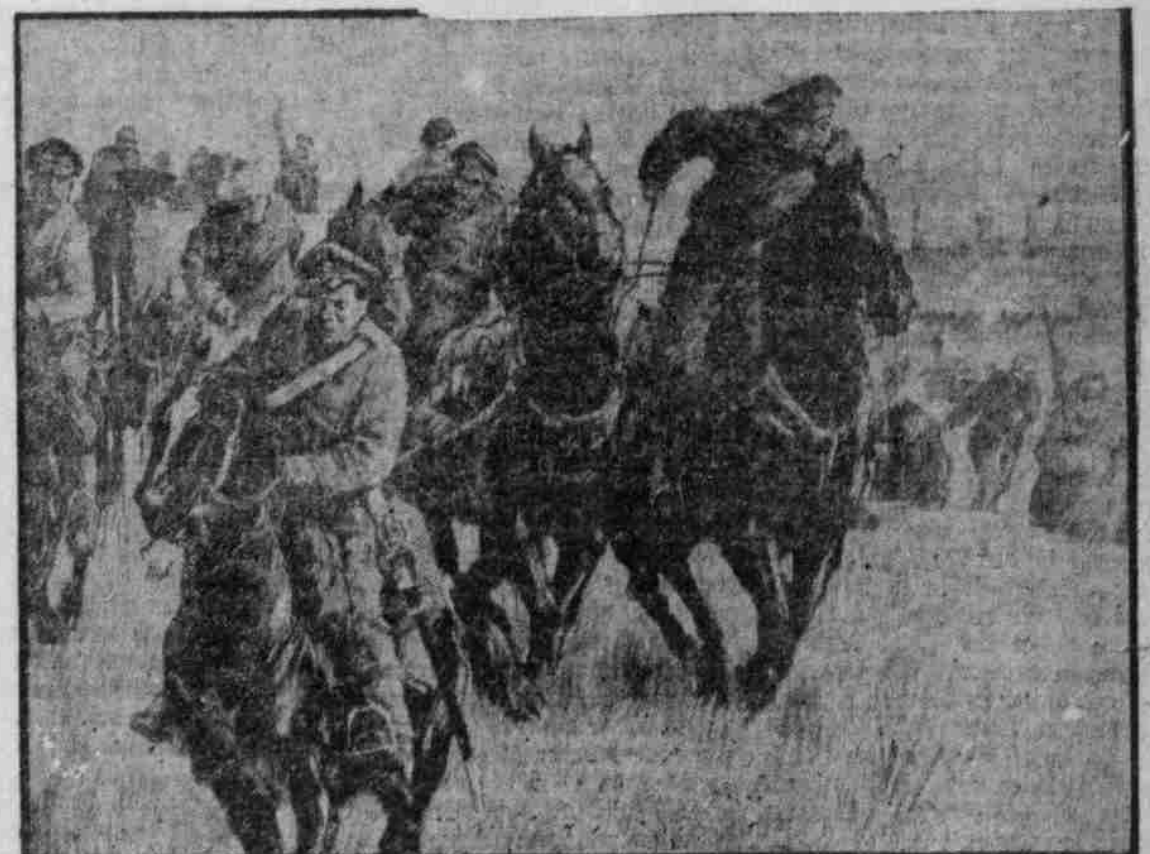
FLIEHENDE RUSSEN.