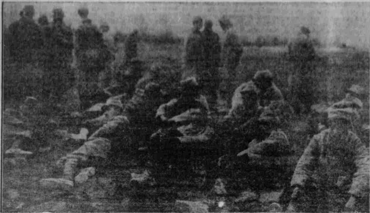
Nach den letzten Kämpfen um die Combrechöhe: Französische Gefangene vor dem Abtransport.