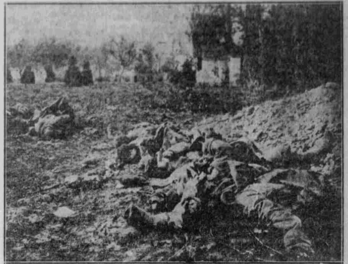
Russen, die bei der verfruchteten Erstürmung eines Kastells in Russisch-Polen gefallen sind.