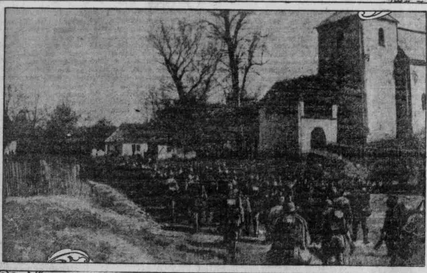
DEUTSCHE INFANTERIE beim PASSIEREN eines DORFES