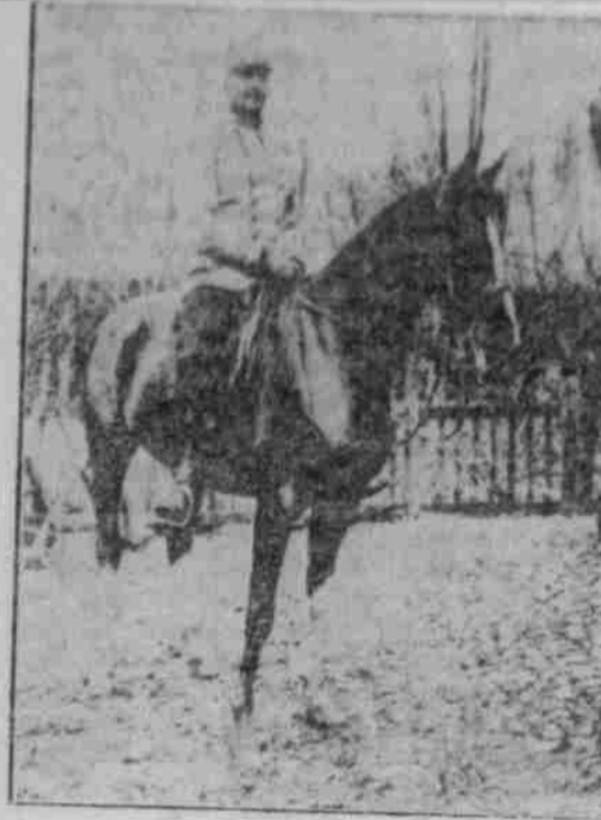
General der Kavallerie von Pfanzer-Waltin, Führer eines österreichisch-ungarischen Armeekorps.

Wägen in ganz Belgien verboten ist. Die, die aus belandenen Ursachen geübt sind, diese Beförderungsmitel zu gebrauchen, können einen Wertung an die zuständigen Behörden einreichen. Diese Verfügung ist wegen Mangelnde getroffen worden.“