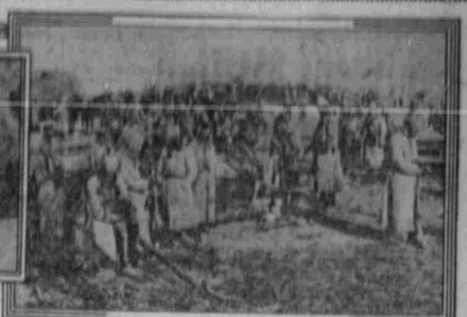
Österreichische Truppen besichtigen erbeutete russische Maschinengewehre.