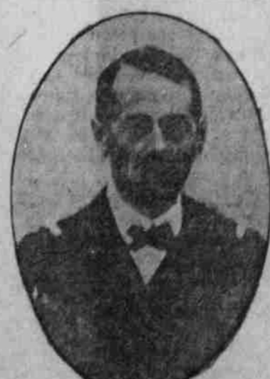
Linienflottenkommandant v. Trapp, der Kommandeur des österreichisch-ungarischen Ulfesbootes „U 5“.