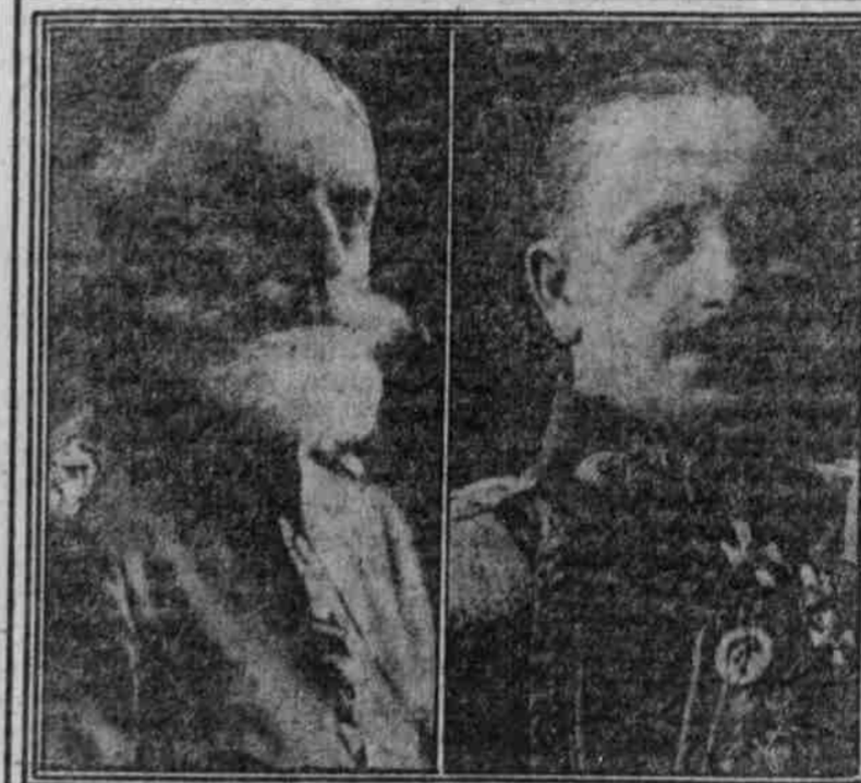
Generaloberst v. Falkenhäuser, Befehlshaber einer Armee im Westen.