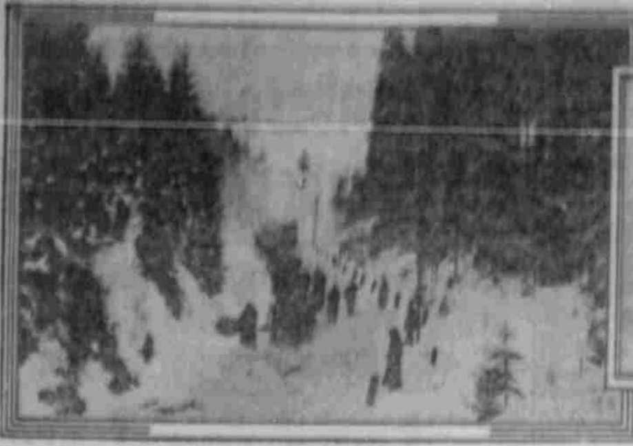
Österreichische Infanteriebrigade in einem verschneiten Karpatenpaß.