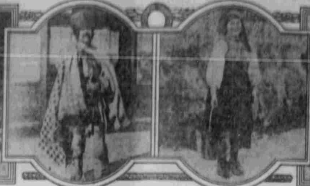
Russenischer Bauer in den Karpaten.