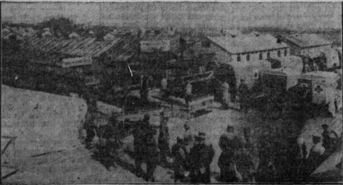
Kazarets und Verwundeten-Verladestellen in Vignettes.

— Gneisenau war mit 45 Jahren noch Hauptmann.