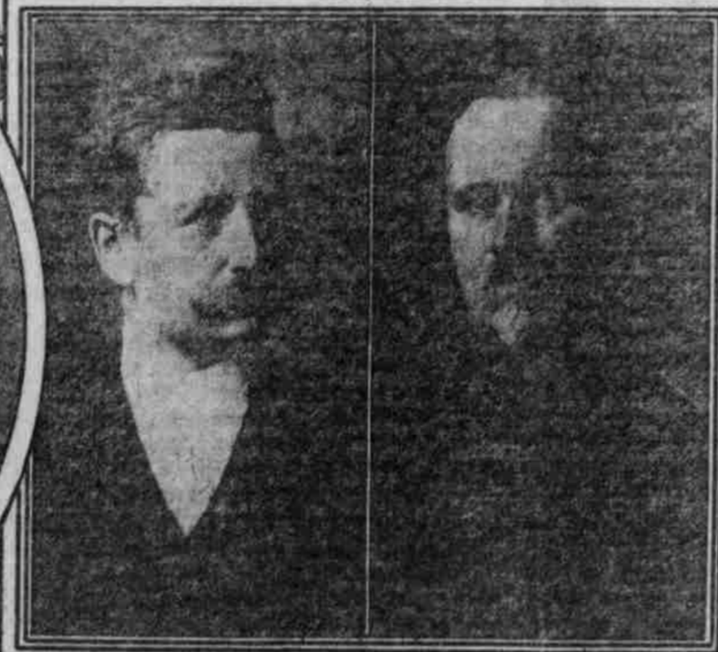
Prof. Dr. Richard Pfeiffer, welche wissenschaftlich die Cholera- und Typhusimpfung begründeten. Beide Forscher stehen jetzt im Felde, Pfeiffer als Generalarzt, Rolle als Stabsarzt.