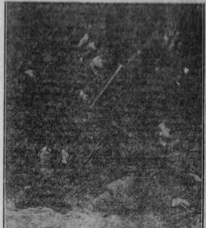
Maschinengewehr-Kolonnen beim Beschießen eines feindlichen Stützpunktes in Belgien.