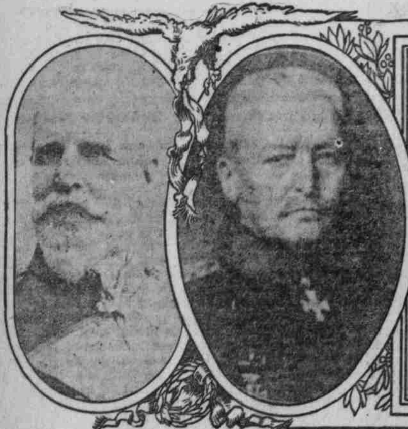
Admiral v. Knorr, einer der populärsten deutschen Seeoffiziere, feierte seinen 75. Geburtstag.

Männer, die in den Tagesmeldungen Erwähnung fanden.