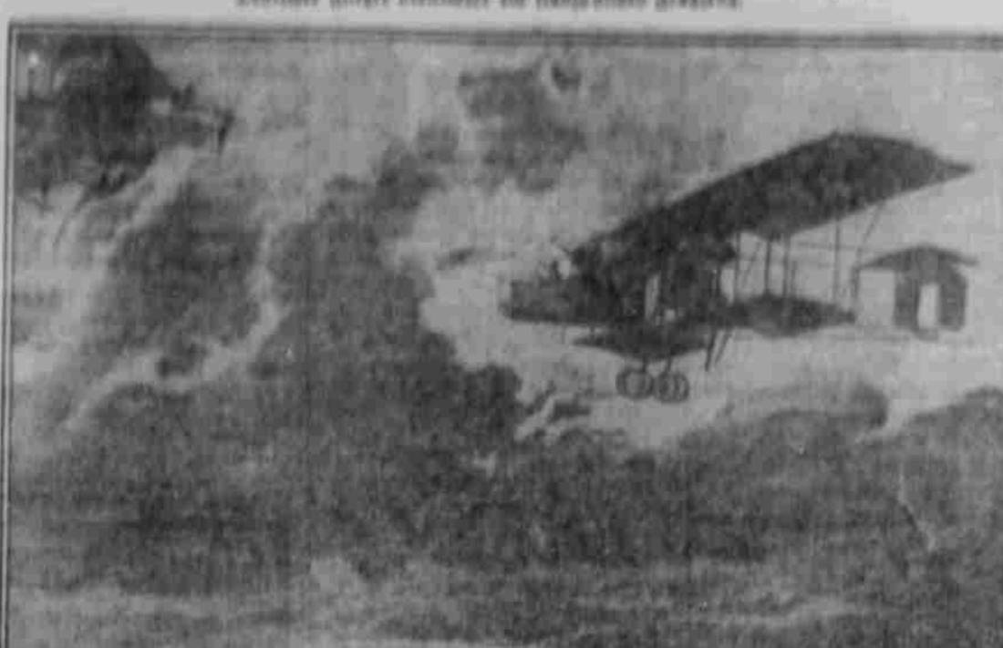
Deutscher Luftkrieger vor dem britischen Küsten.

Die deutsche Luftflotte hat sich in den letzten Tagen in der Nordsee und im Ostseegebiet in der Richtung auf die britischen Inseln konzentriert. Die Luftschiffe sind in der Nordsee in der Richtung auf die britischen Inseln konzentriert.