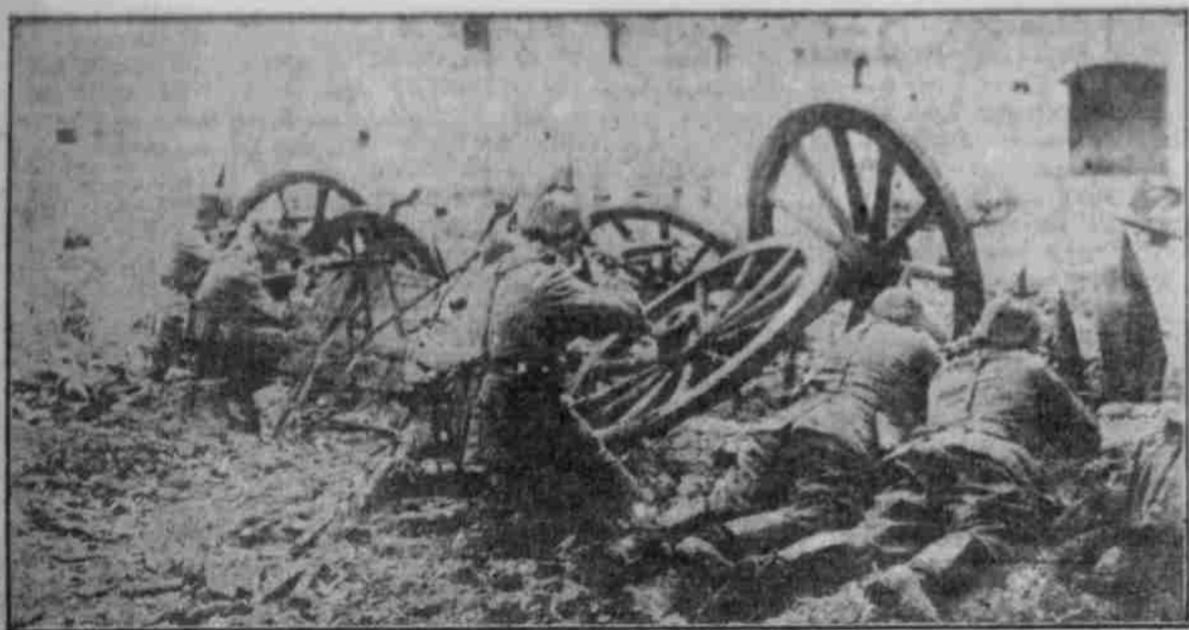
Bei Soissons: Deutsche Soldaten schießen in Deckung hinter Geschützrädern in einer zerstörten Fabrik auf den Feind.