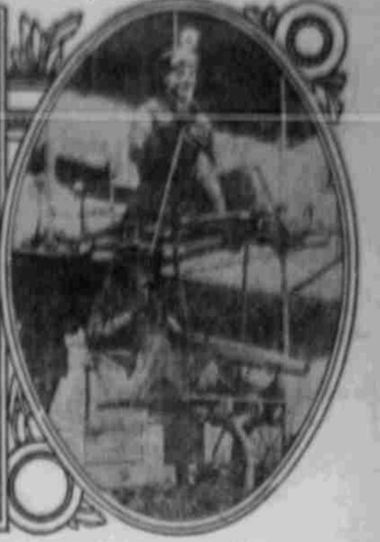
Maschinengewehr unter dem Aeroplan.