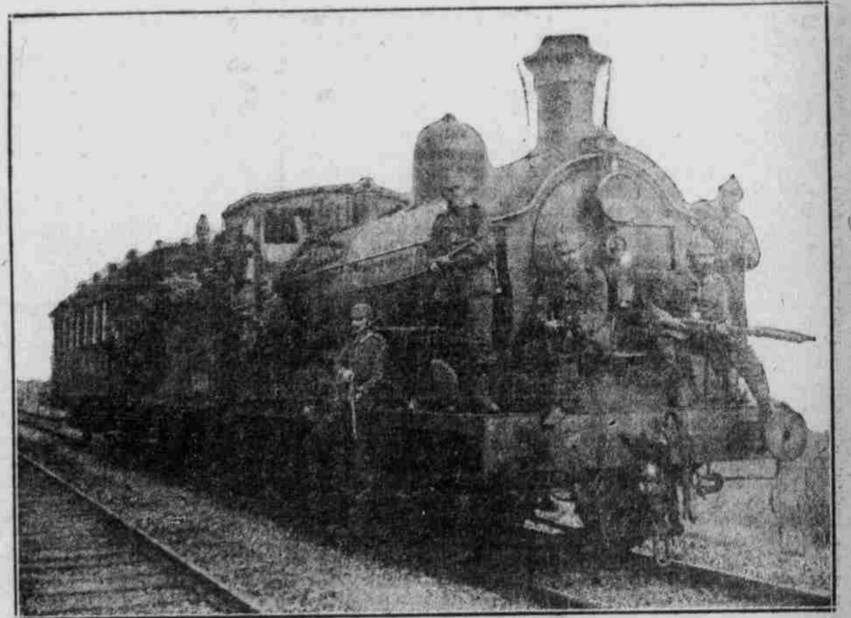
Deutscher „Erkundungszug“ auf einer Bahnlinie vor Arras.