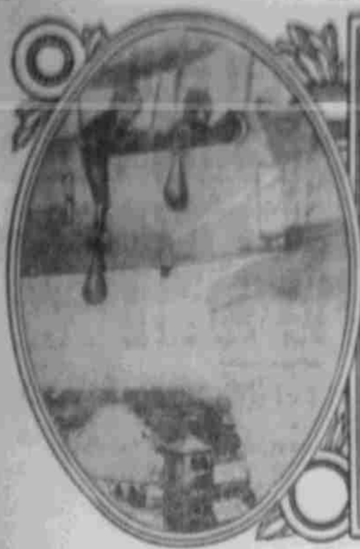
Abwerfen von Bomben.