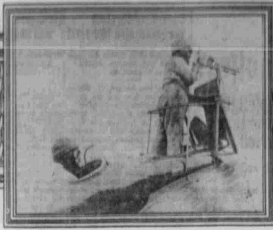
Maschinengeschütz auf dem Flugzeug.