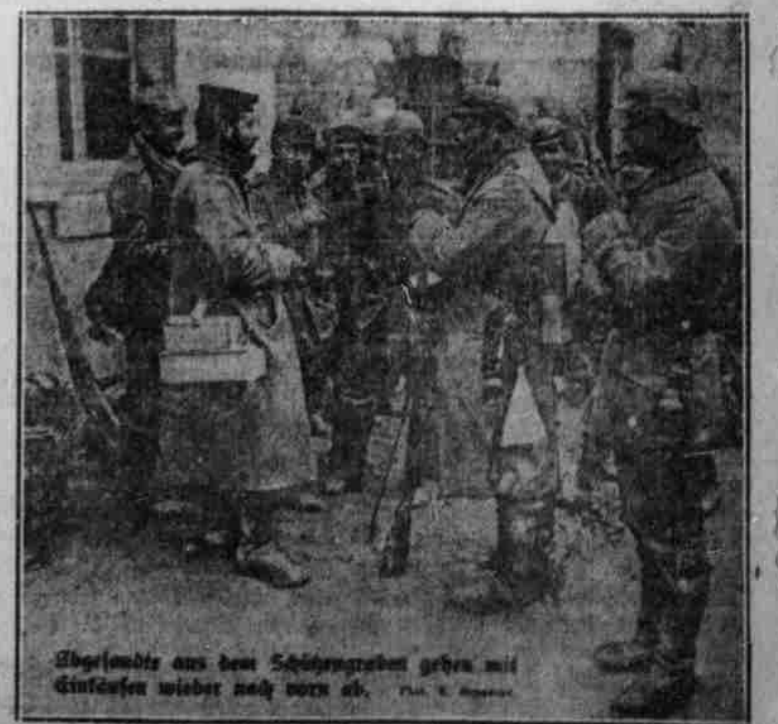
Abgesandte aus dem Schützengraben gehen mit Entwürfen wieder nach vorn ab.