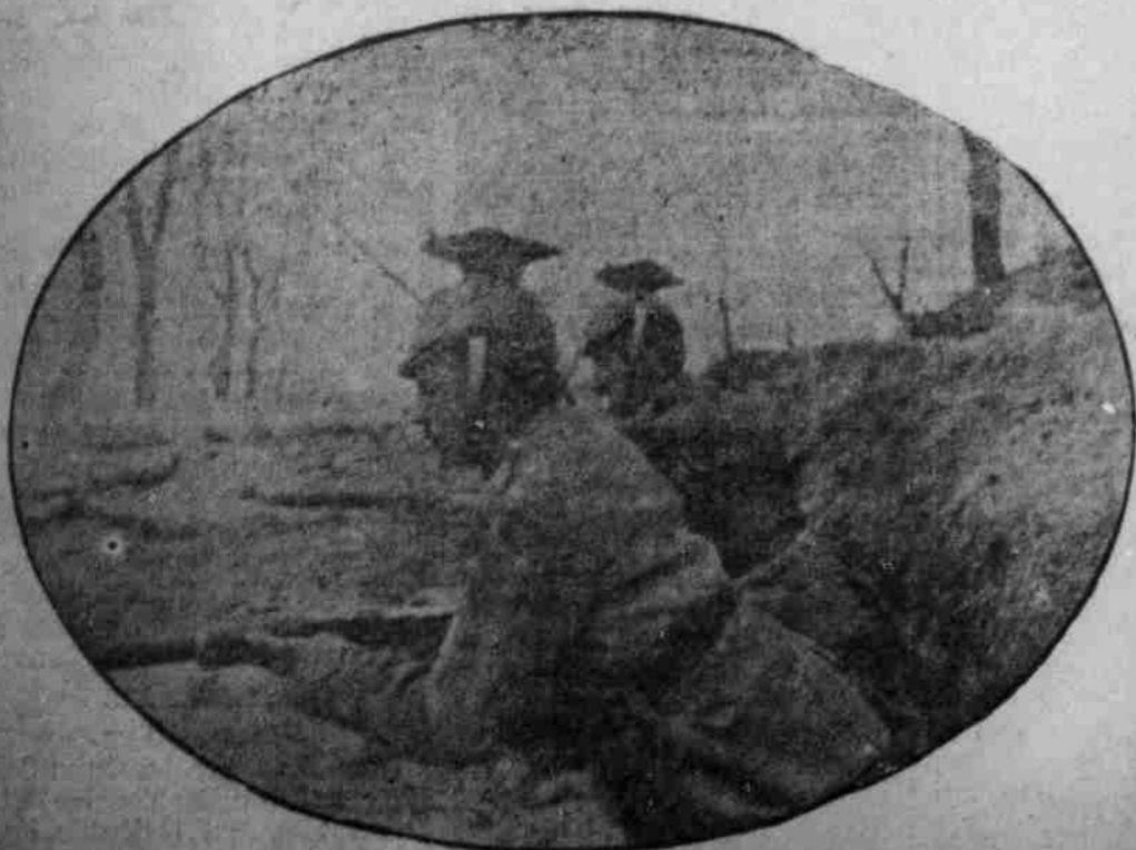
Mannen auf Beobachtungsposten.