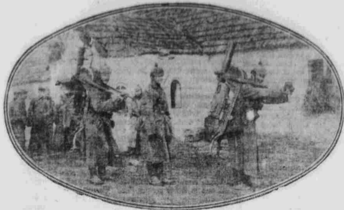
Maschinengewehr-Abteilung auf der Quartierstraße in einer russischen Ortschaft.