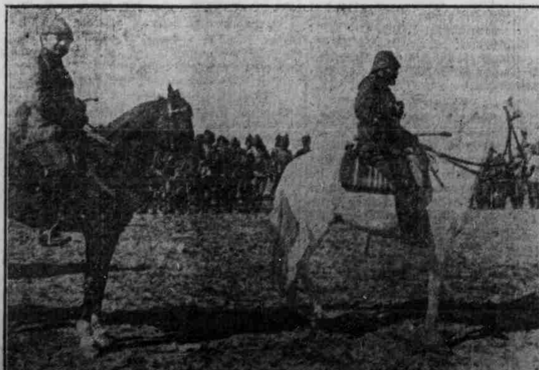
Osman-Pasha, der Oberkommandierende der Armee gegen Ägypten, hinter ihm Oberst Grafenberg.