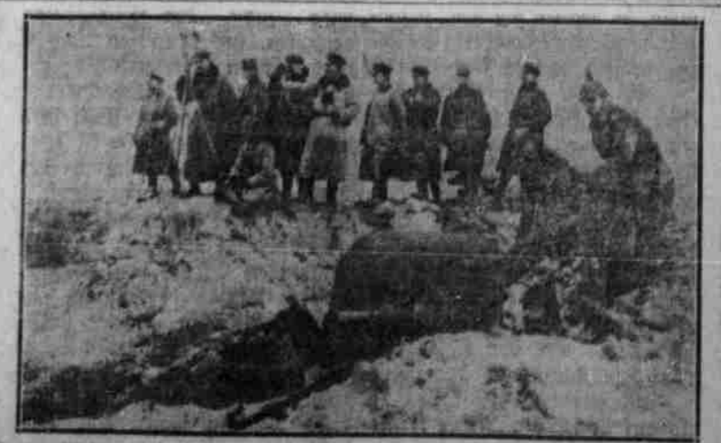
Stabsoffiziere auf einem Hügel bei einer Artillerie-Position zwischen Mlawa und Stierpe. Das Geschütz ist den Russen entziffen worden.