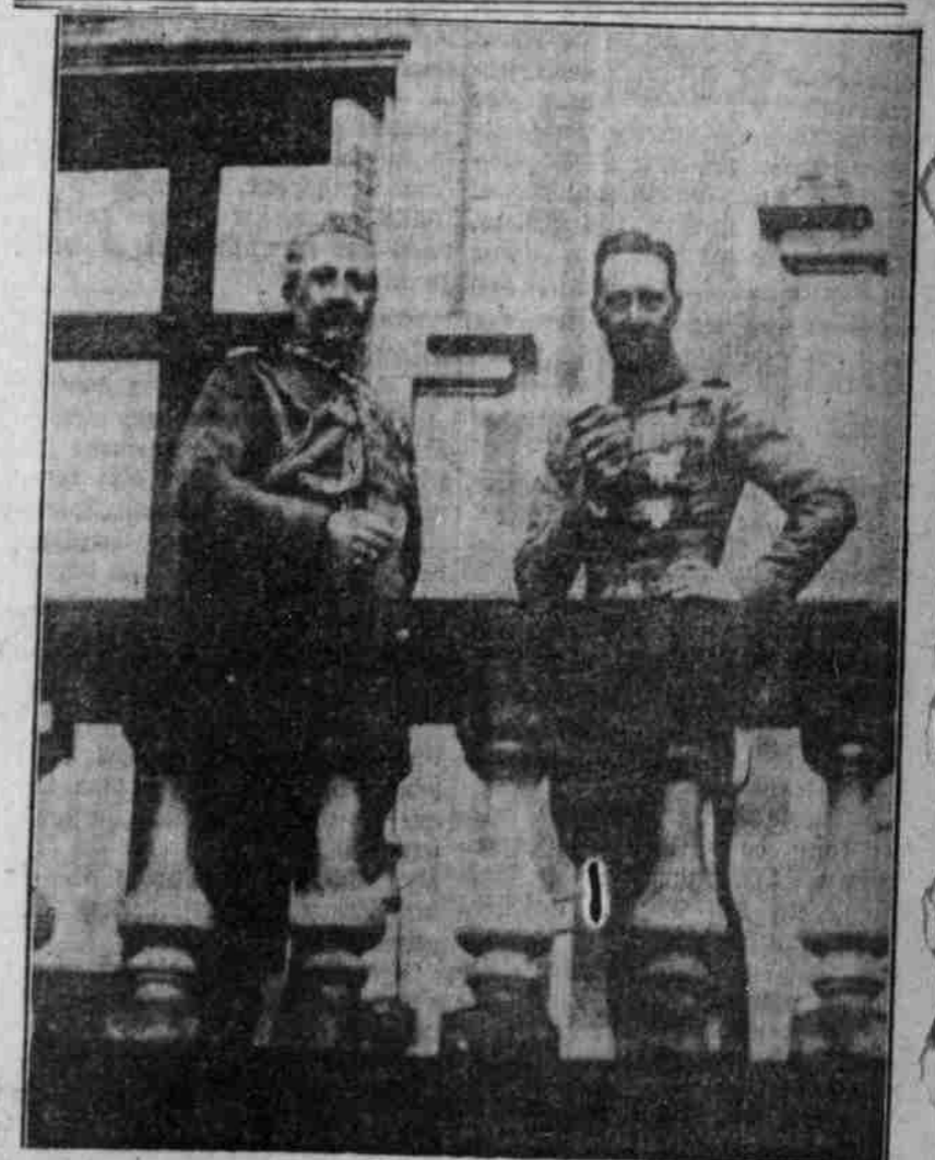
Der Kaiser im Hauptquartier des Kronprinzen.