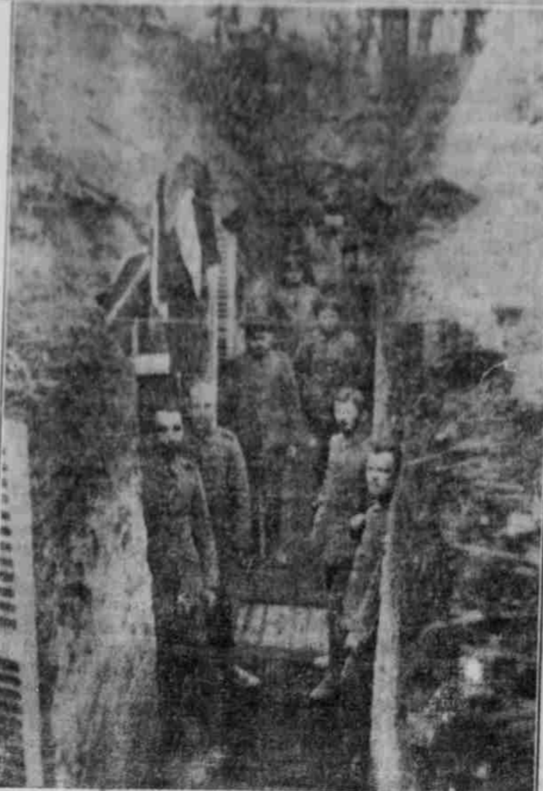
Ein Schützengraben mit eingebauter „herrschaftlicher Villa“.