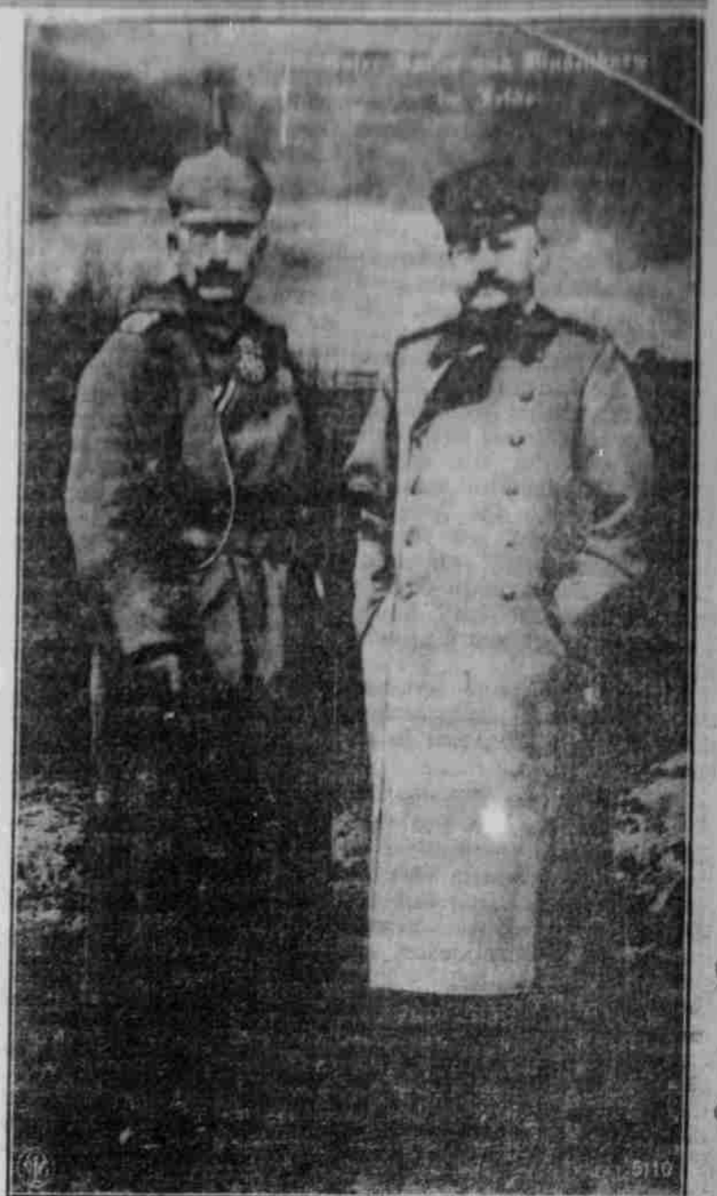
Kaiser Wilhelm II. und Generalfeldmarschall Hindenburg.