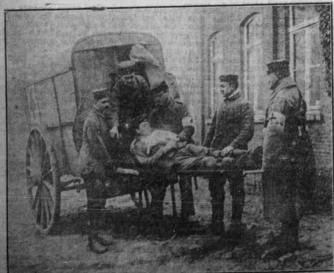
Einladen eines Verwundeten.