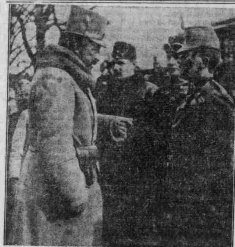
Erzherzog Josef bei den Truppen: Der Erzherzog überreicht einem ungarischen Husarenwachtmeister, der bereits die kleine und große silberne Tapferkeitsmedaille besitzt, die goldene.