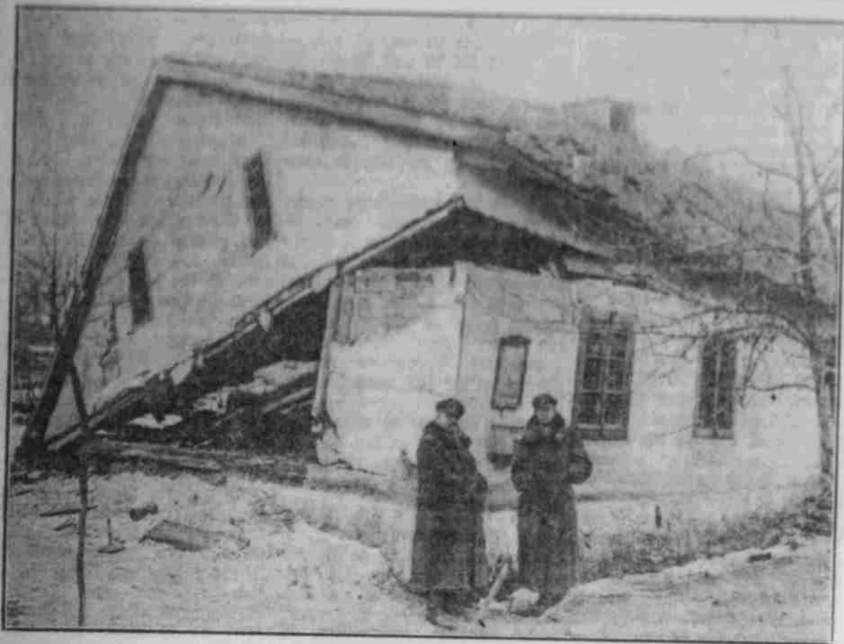
Vom polnischen Kriegsschauplatz.