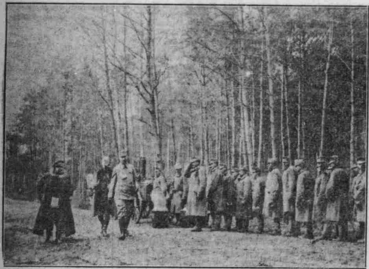
Bei den ungarischen Truppen in den Karpathen.