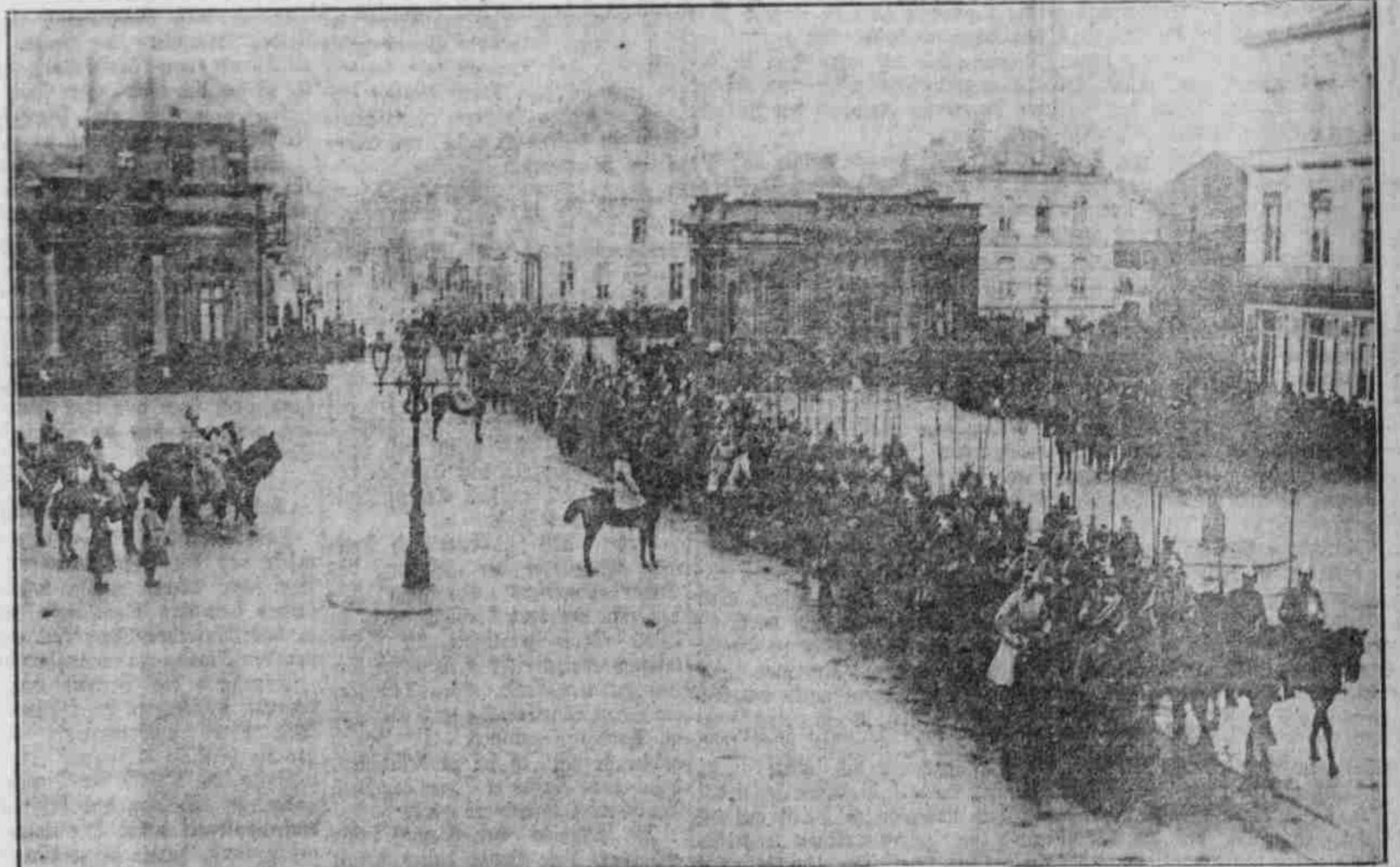
Parade in Moskau.