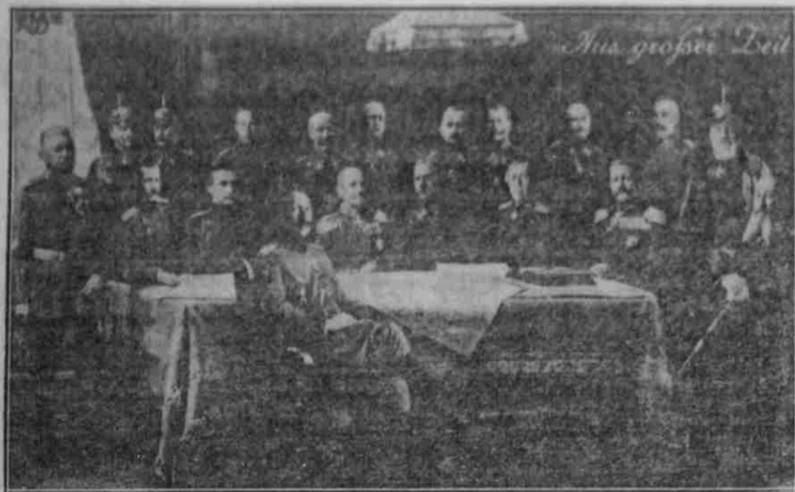
Kaiser Wilhelm II. in der Mitte des großen Generalstabs.