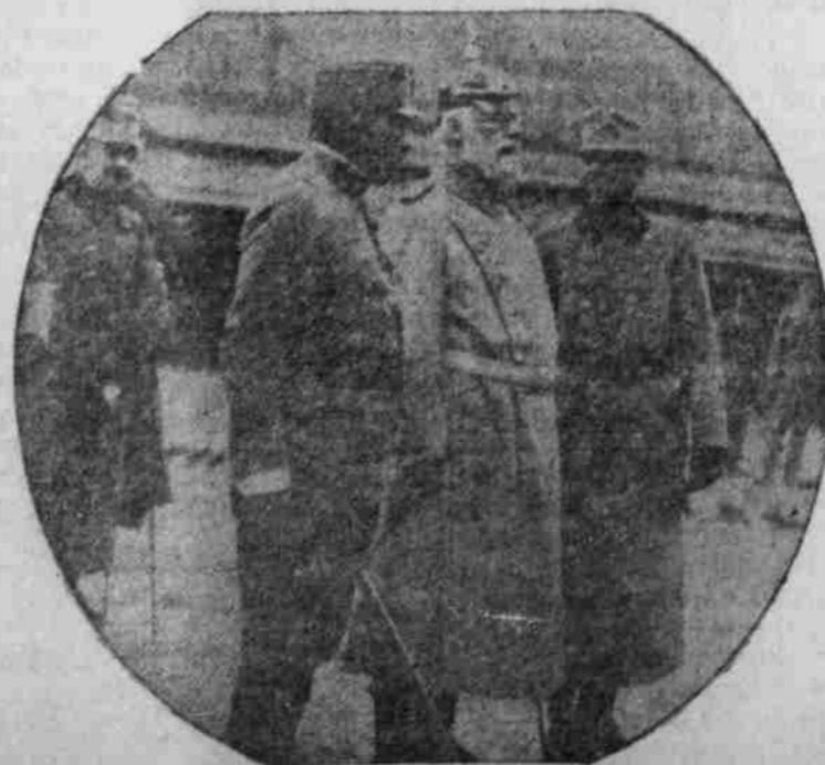
König Ludwig von Bayern bei der Besichtigung der österreich.-ungarisch. Motormörser-Batterien.