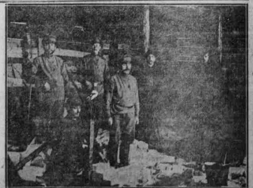
Russische Gefangene beim Bauen von Erdwohnungen.

Die „Rizsch“ stellt fest, daß die letztjährige russische Ernte weit unter dem Durchschnitt gewesen sei, und an Futtermitteln eine vollständige Wiskerte vorliege, sobald eine Theuerung für Futtermittel und Getreide bestehe.