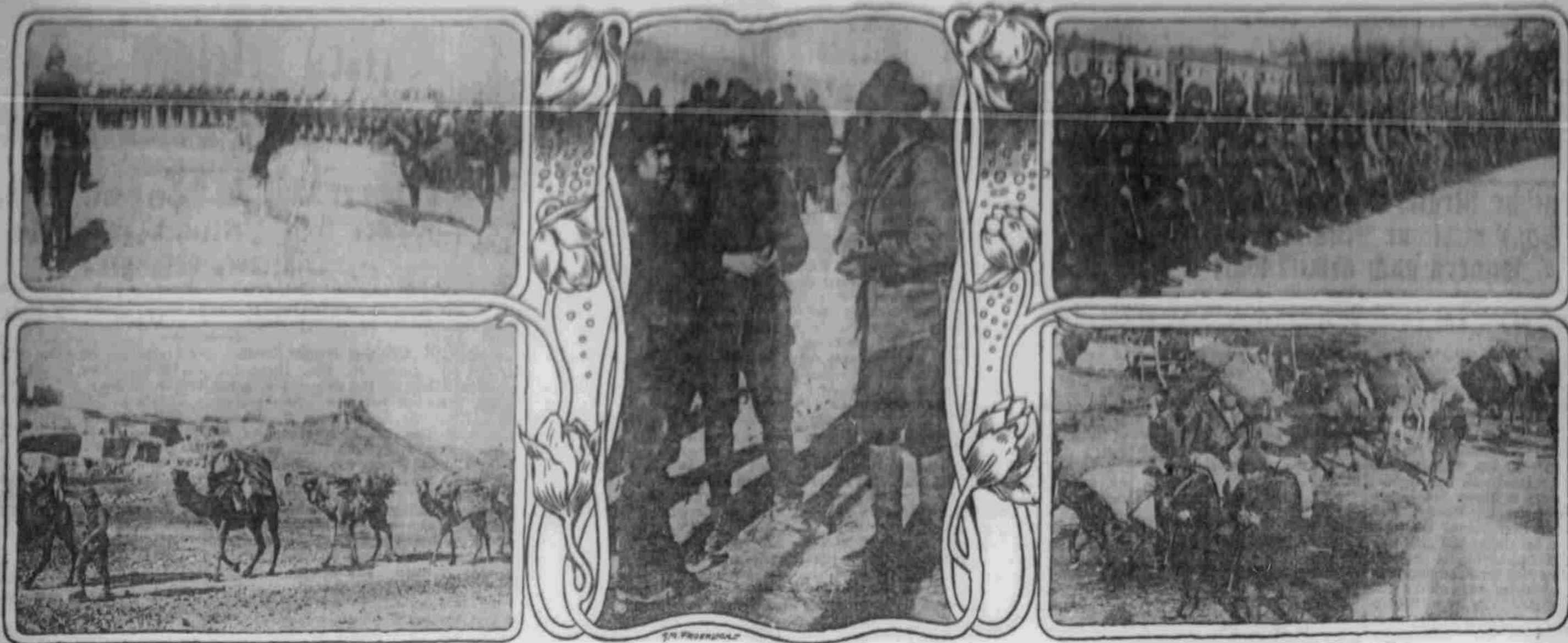
Oben: Besichtigung der 25. Infanterie-Division. Unten: Kameltransport in Syrien.