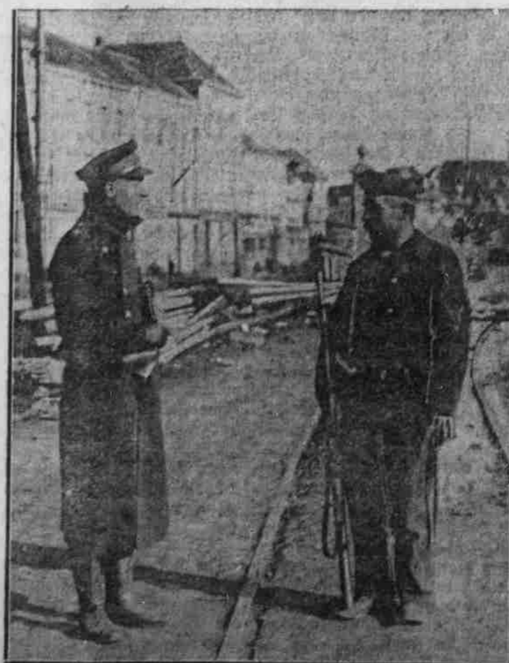
Seeroldaten als Wachtposten an Bahulinie.

Steuerad und Galionsfigur von der „Eben II“. Am Boden die Tropenhelme der „Eben“-Besatzung. An der Wand die von den Kokosinseln mitgenommene Karte der Nabelverbindungen.