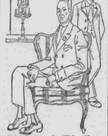
Und ist es wahr, Mister Brown... Die Freude hat sich gebogen... Die Freude hat sich gebogen...