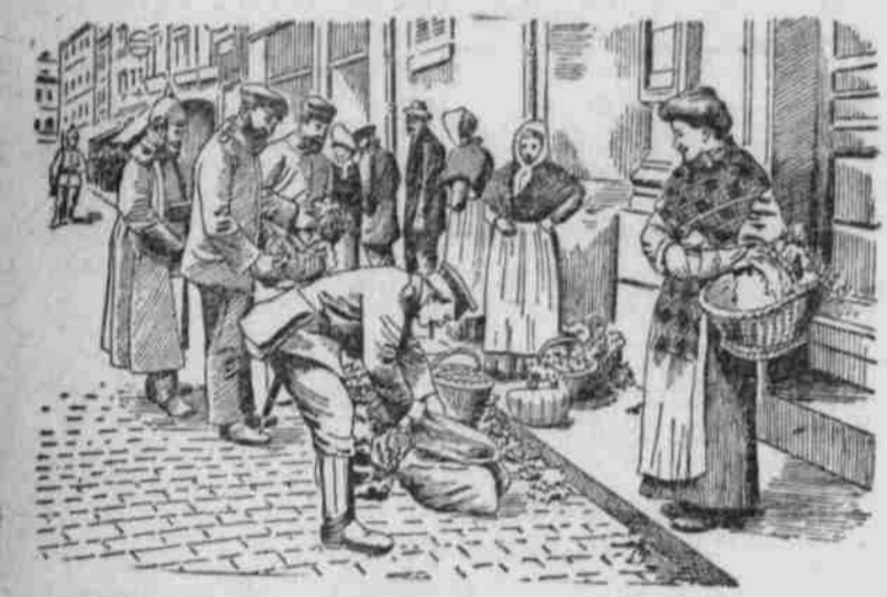
Soldaten beim Einkauf in Belgien. die Freude hat sich gebogen... die Freude hat sich gebogen...