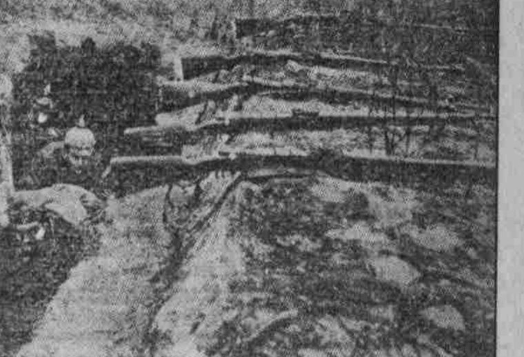
Wie er aussah, nachdem er sich... Die Freude hat sich gebogen... Die Freude hat sich gebogen...