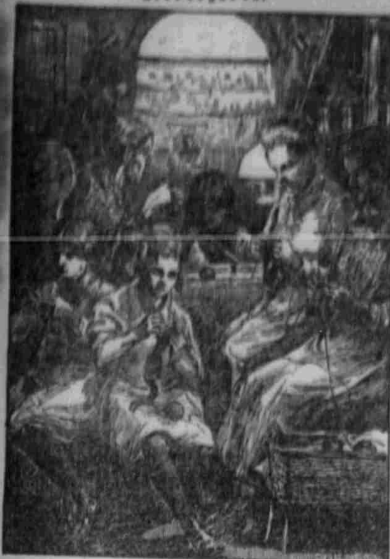
Ob groß, d. klein, ist alt, ist jung. Ein jeder muß Besichtigung... Die Freude hat sich gebogen...