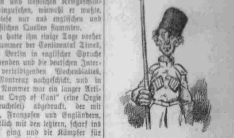
Wie er aussah, nachdem er sich... Die Freude hat sich gebogen... Die Freude hat sich gebogen...