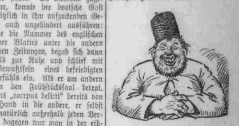
Wie er aussah, nachdem er sich... Die Freude hat sich gebogen... Die Freude hat sich gebogen...