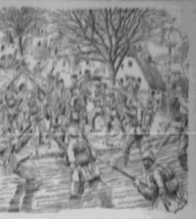
Ein unbekannter Drogenstoff. Bekanntlich verbietet das neue... Die Freude hat sich gebogen... Die Freude hat sich gebogen...