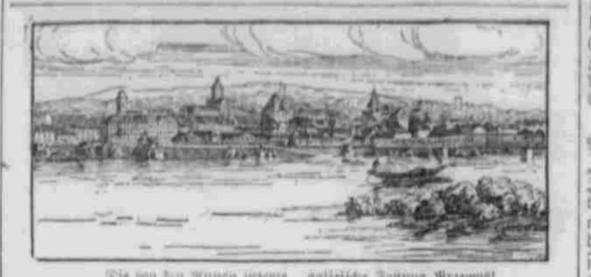
Die von den Russen besetzte... Die Freude hat sich gebogen... Die Freude hat sich gebogen...