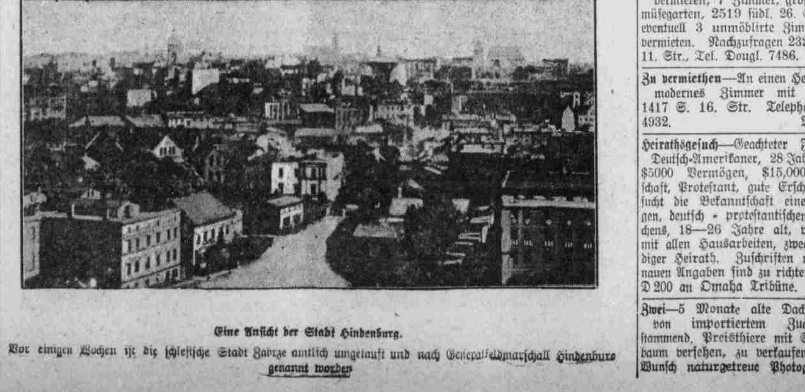
Eine Ansicht der Stadt Gendensburg.

Vor einigen Wochen ist die schiefliche Stadt Gendensburg amtlich umgetauft und nach General-Admiral Gendensburg genannt worden.