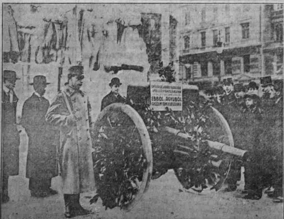
Von der R. u. R. Armee erobertes russisches Geschütz, aus welchem Kriegsgedenkmünzen geprägt werden sollen.

urtheilte den Unteroffizier, Vater von 5 Kindern, wegen eines Verbrechens des thätlichen Widerstehens an einem Vorgesetzten, begangen im Felde, zu 10 Jahren Gefängnis und Degradation.