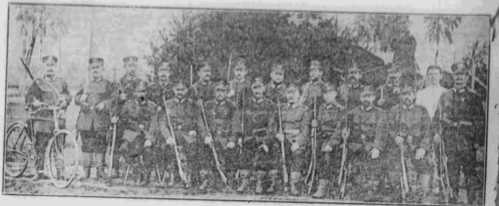
Eine Abteilung holländischer Landsturm.