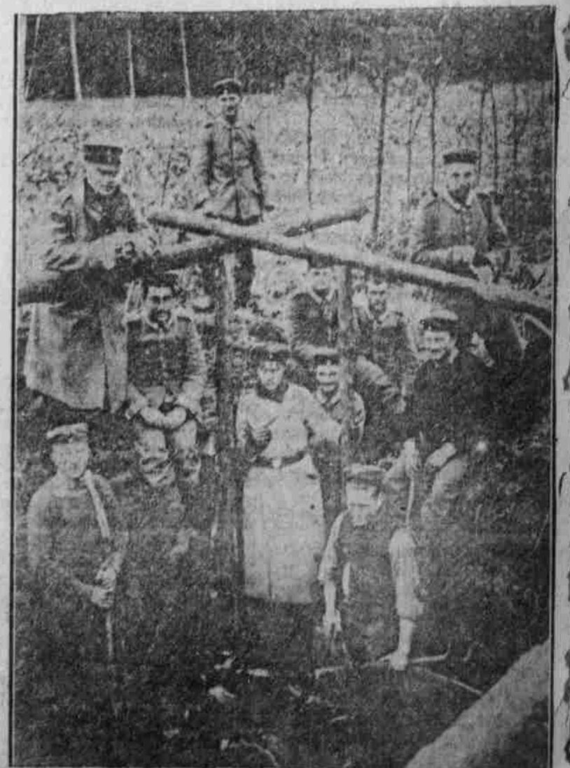
Bau eines bombardierten Unterstandes.