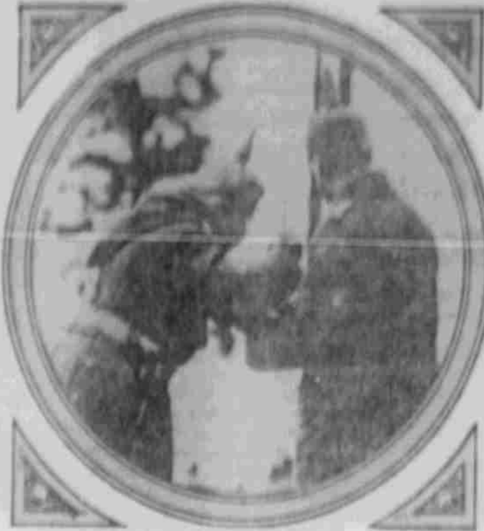
Ein Teller Suppe aus der Feldküche.