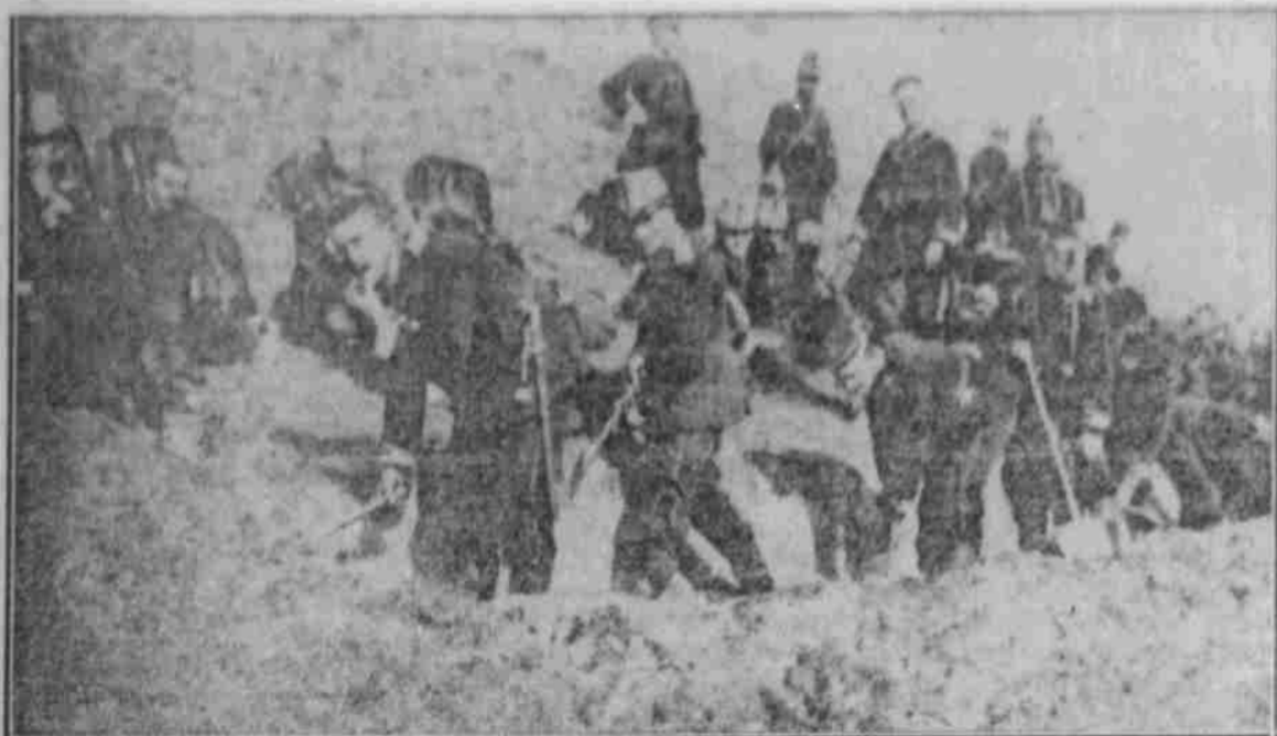
Aus den Kämpfen bei Ypern: Deutsche Strosoldaten bauen Deckungen gegen englische Granaten.