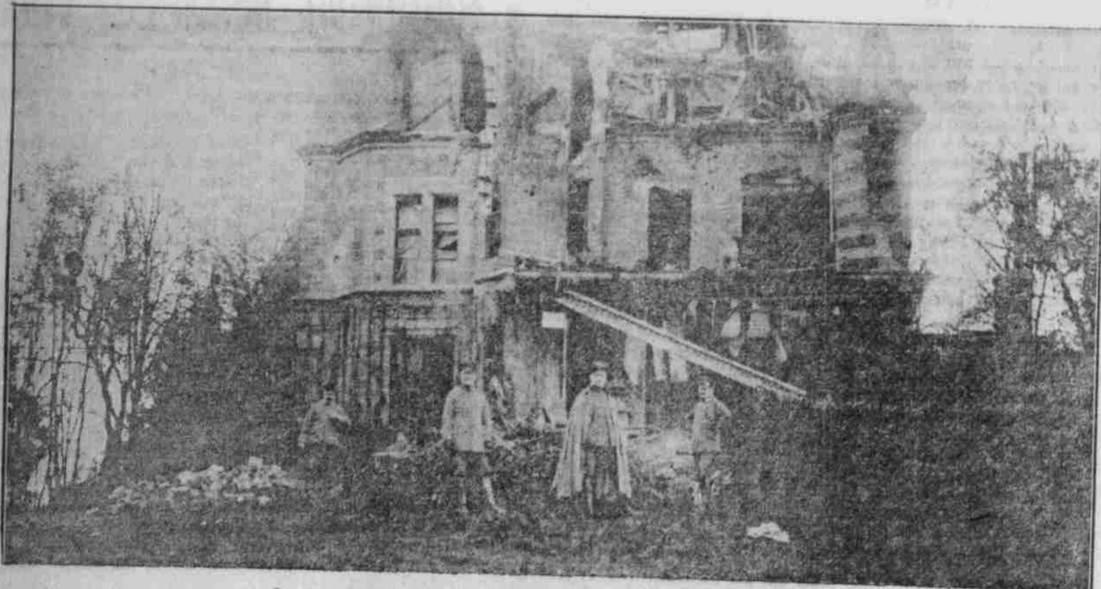
Doubery bei Sedan, wo Kaiser Wilhelm I. 1870 die Schlacht beobachtete.