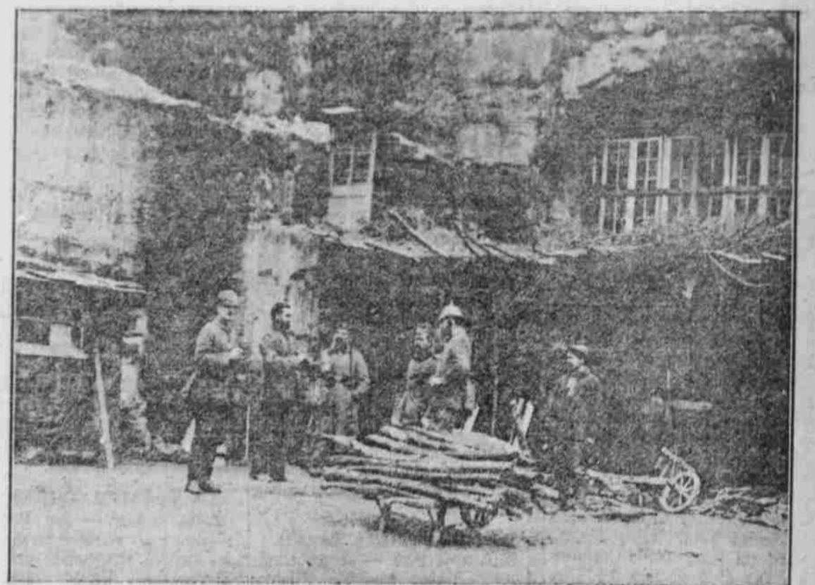
Die Steinhöhlen von Soissons.

Harter Urteil. Der Unteroffizier des Ersatzbataillons des Infanterie-Regiments Kettler Vogel wurde am 31. Oktober Nachts 11 Uhr in München in angeheitertem Zustande von einem Offizier, weil er nicht vorschriftsmäßig geküßt, zur Rede gestellt. Die Aufforderung des Offiziers, stillzustehen, beantwortete der Betrugene mit einem Faustschlag in's Gesicht des Offiziers. Das Kriegsgericht München ver-