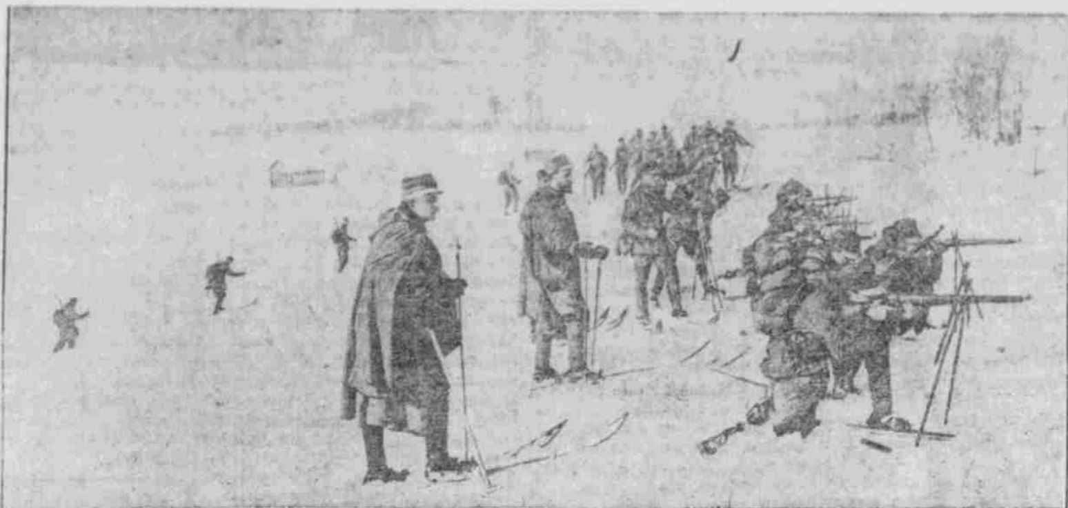
Oesterreichisch-ungarische Schneeschuhtruppe in der Karpathen.