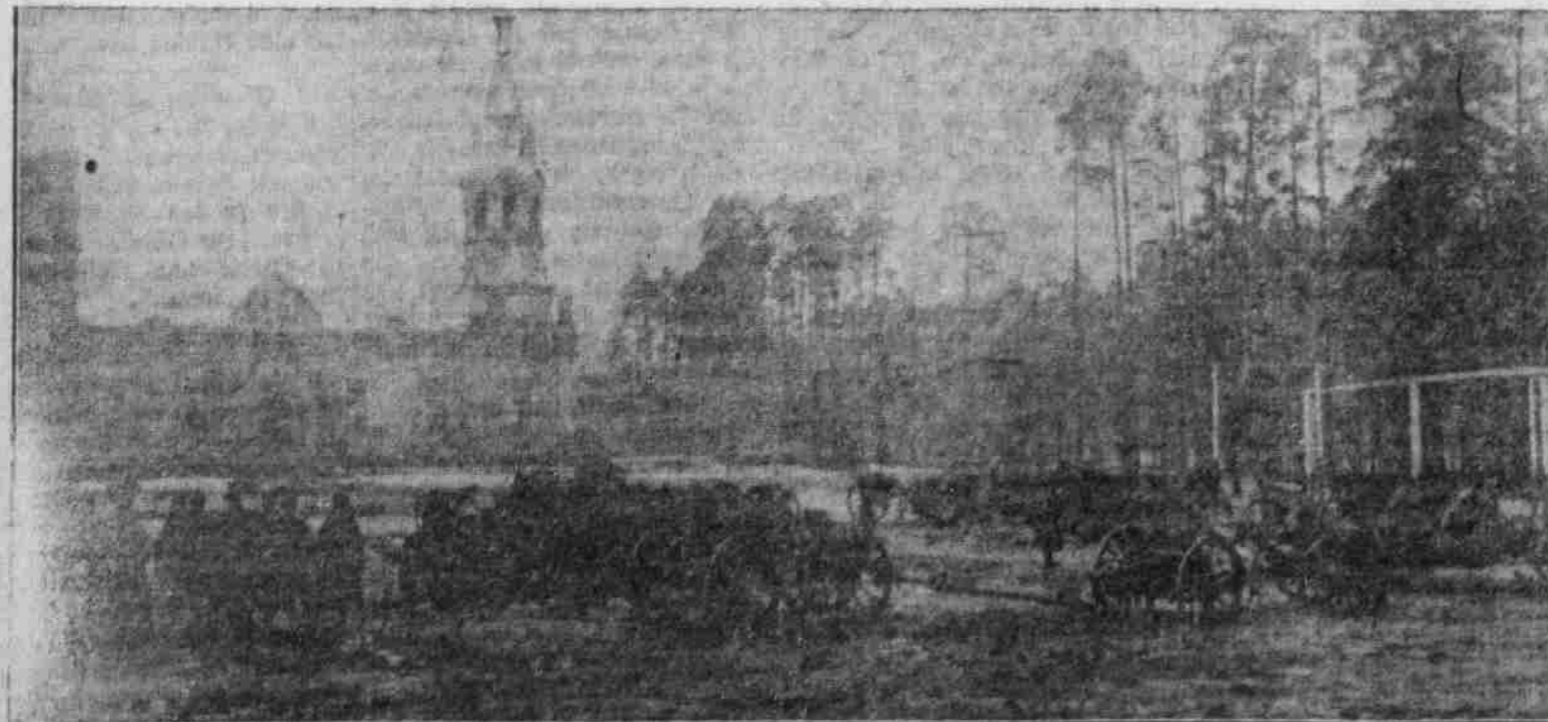
Erbeutete russische Geschütze vor der Kirche von Augustowo.