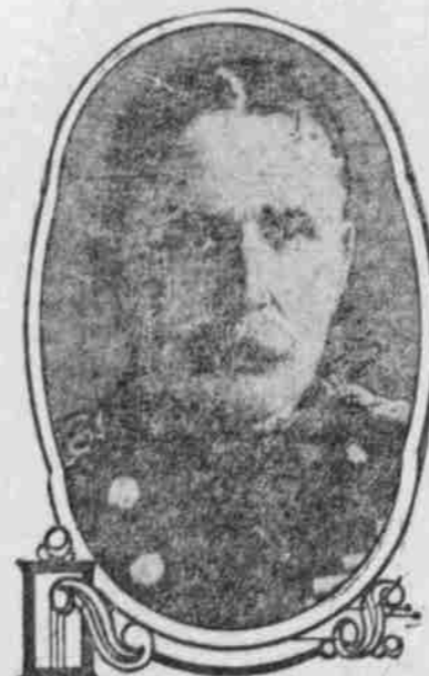
Feldmarschall FRENCH, Kommandeur ENGLISCHEN TRUPPEN.

Rang, lang ist's hin! Als die Engländer in Hamburg zuerst auf Schiffen interniert wurden, fragte ein soeben Angekommener den Wachtmann, wie lange sie hier nun wohl eigentlich sich sollten. Darauf erhielt er die Antwort: „27, Wäquith leggt, zwentig Jahr.“