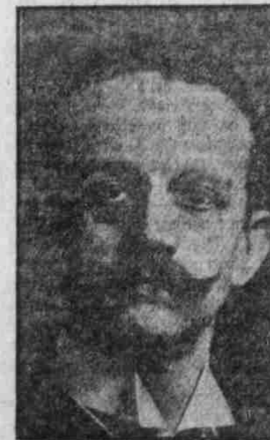
Graf von Bernstorff, der deutsche Bot- schafter.

Rang, lang ist's hin! Als die Engländer in Hamburg zuerst auf Schiffen interniert wurden, fragte ein soeben Angekommener den Wachtmann, wie lange sie hier nun wohl eigentlich sich sollten. Darauf erhielt er die Antwort: „27, Wäquith leggt, zwentig Jahr.“