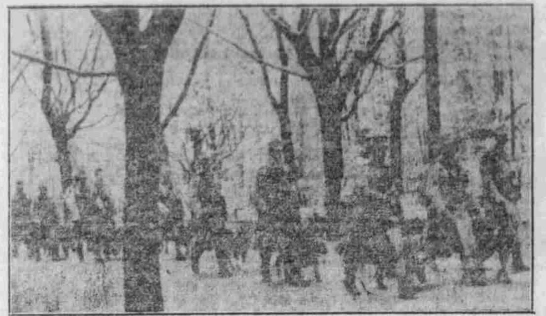
Oesterreich-ungarische Kriegs-Santitätsbände mit ihren Führern in einem Wald in den Karpathen.