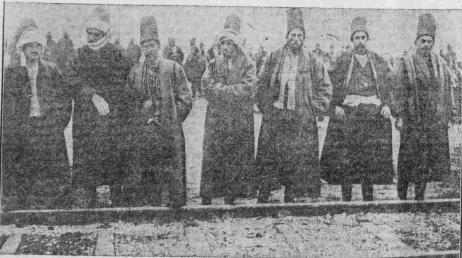
Die Türken in der Kriegszeit: Derwische in Konja (Kleinasien), die zum Landsturm einberufen wurden.