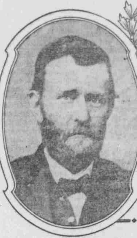
ULYSSES S. GRANT

Der Ausgang des Kampfes: Waffendepot Lee's und Ermordung Lincoln's. — Ende des Kampfes zwischen Nord und Süd und Herbeiführung der vierjährigen Kriegstätigkeit. — Die deutschen Hilfsschiffe. — England und Frankreich, die Feinde der Union.