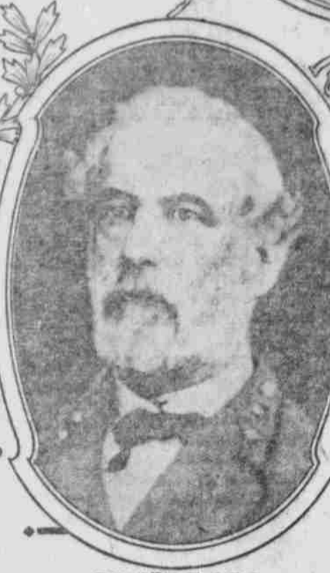
ROBERT E. LEE

Der Ausgang des Kampfes: Waffendepot Lee's und Ermordung Lincoln's. — Ende des Kampfes zwischen Nord und Süd und Herbeiführung der vierjährigen Kriegstätigkeit. — Die deutschen Hilfsschiffe. — England und Frankreich, die Feinde der Union.