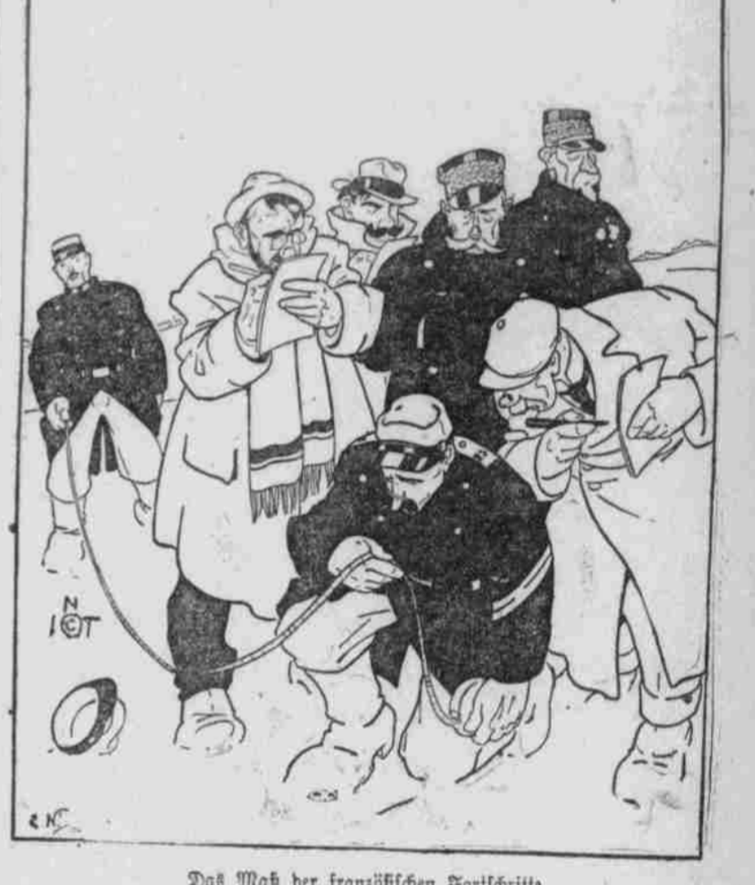
Das Maß der französischen Fortschritte.

Immer d. r. selbe. Hauptmann: „Was sollen denn die Stiefel hier draußen vor dem Unterstand?“ Russische Elite. Dame: „Herr Mittelmeister, Ihre Truppe ist doch ein Elite-Regiment?“