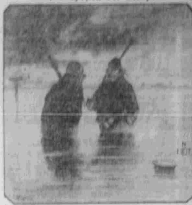
„Nicht d' Tod, es is eine bekannte Sache, nicht d' Tod, es is eine bekannte Sache.“

Wetterlich. Die Mädchen hat der Regen... Koschke's Frage. Herr Meier (mit einer Weinrose): „In den nächsten Tagen werde ich auch zum Militär eingezogen.“