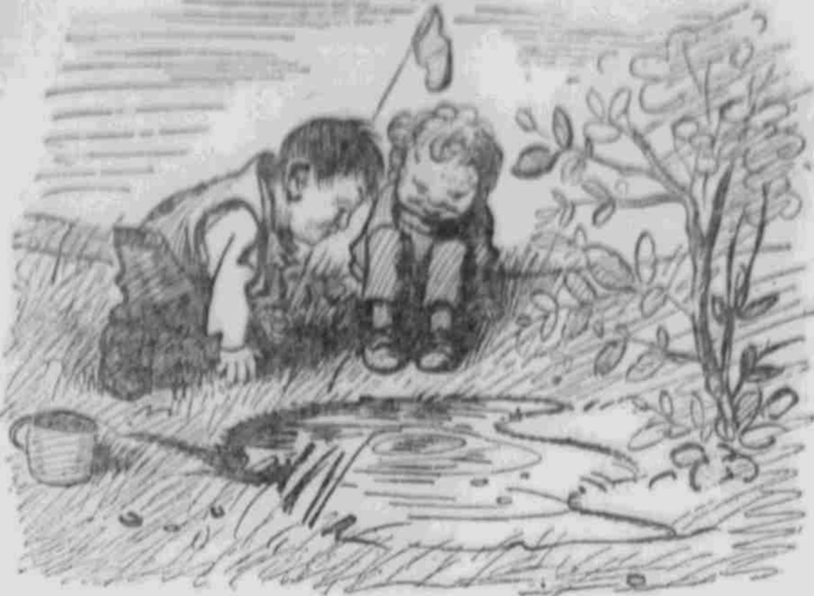
„D' Bist' san wie d' Engländer, halt's fangs nich, san f' verschunden!“