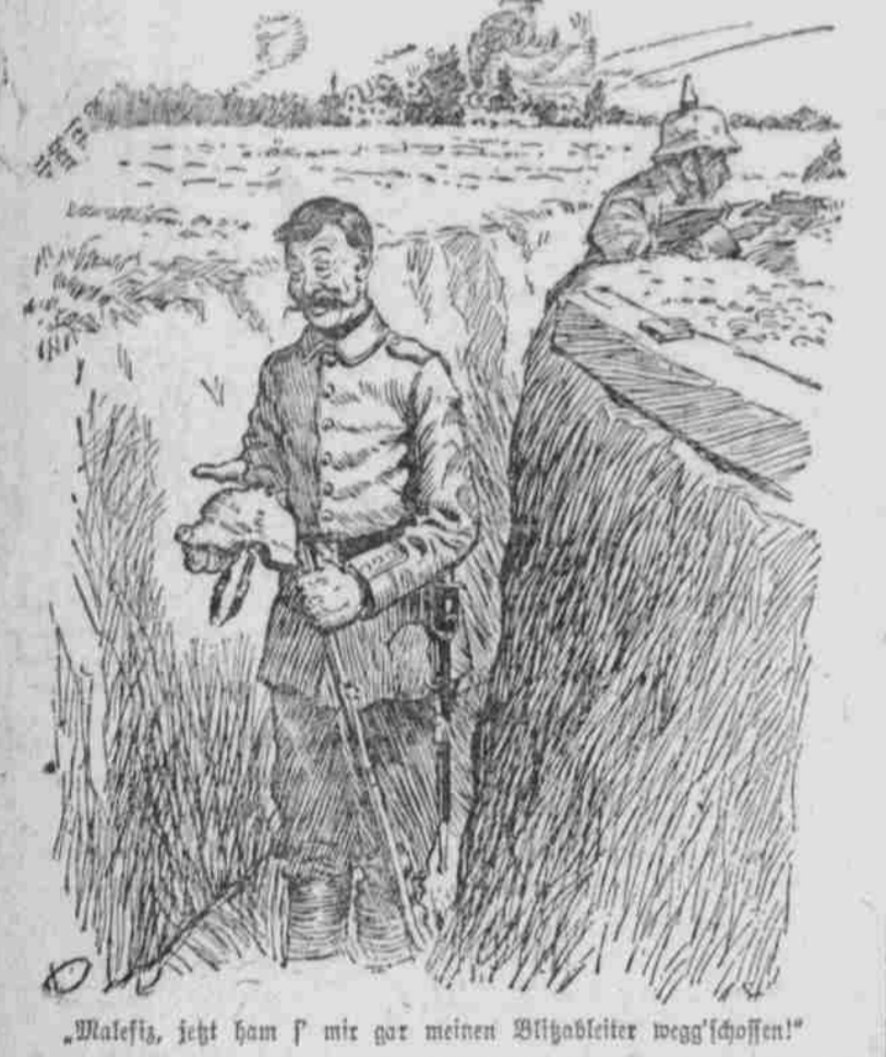
„Malefiz, jetzt ham f' mir gar meinen Witgabteiler wegg'schossen!“

Gerichtshoflicher (der vor der Wunde des Stubosus Spund mit dem Gelbbriefträger zusammenstößt): „Bitte nach Zigen!“ Zufrieden. Gnädige (für sich): „Wie mich die Schneiderin mit dem letzten Kleid hineingelegt hat, unerschämmt...“