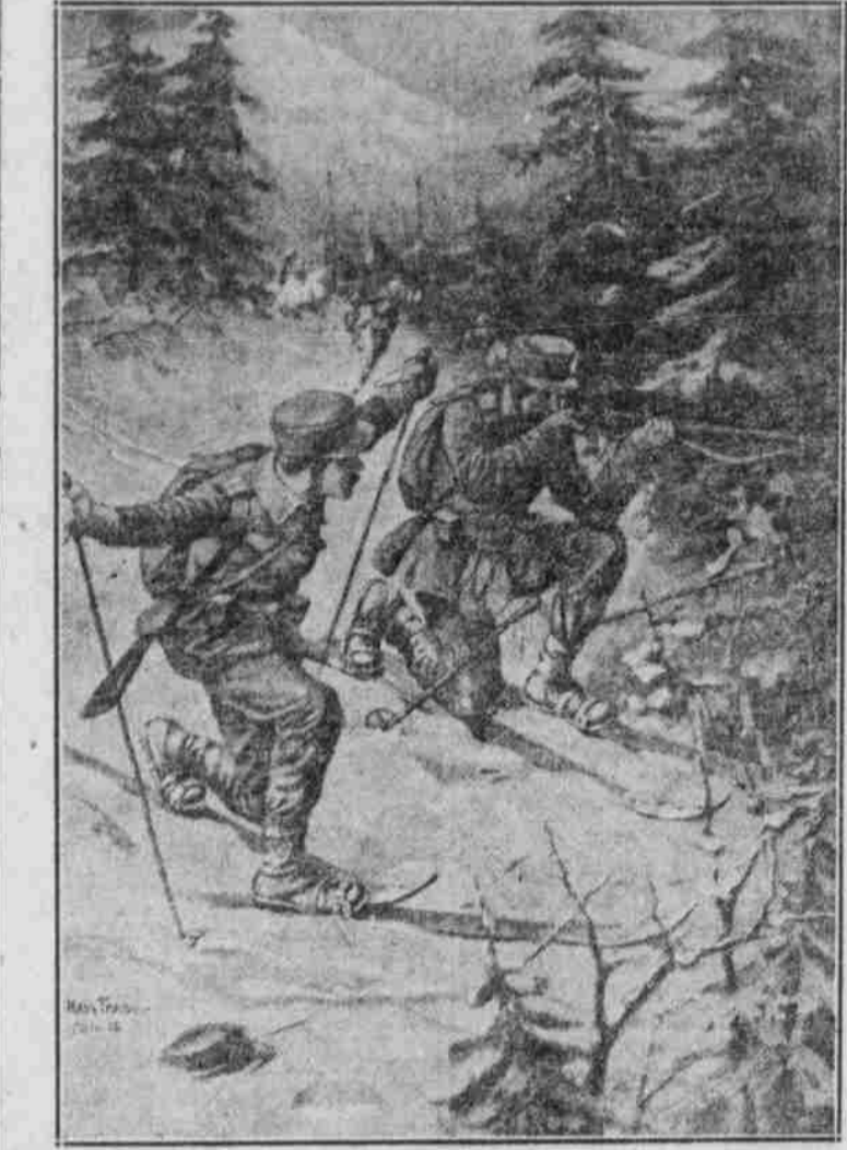
Bayerische Schläufer-Patrouille n den Vogesen.

Die Franzosen haben die deutsche Armee in die Hände der Franzosen überliefert. Die Franzosen haben die deutsche Armee in die Hände der Franzosen überliefert. Die Franzosen haben die deutsche Armee in die Hände der Franzosen überliefert.