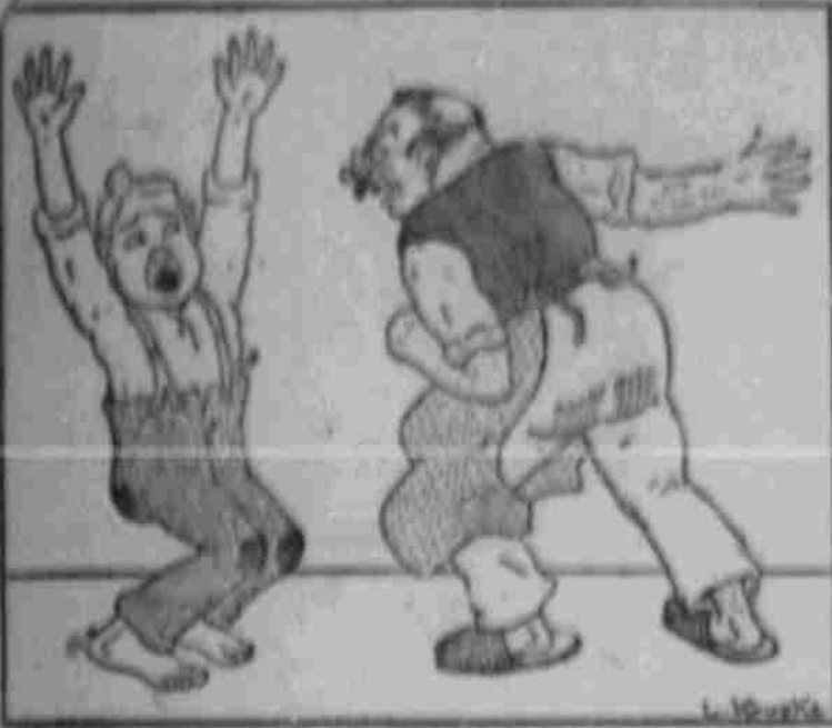
Um Gottes willen, Wozze, lassen Sie mich gehen! Lassen Sie mich gehen, ich bin ein Mann!