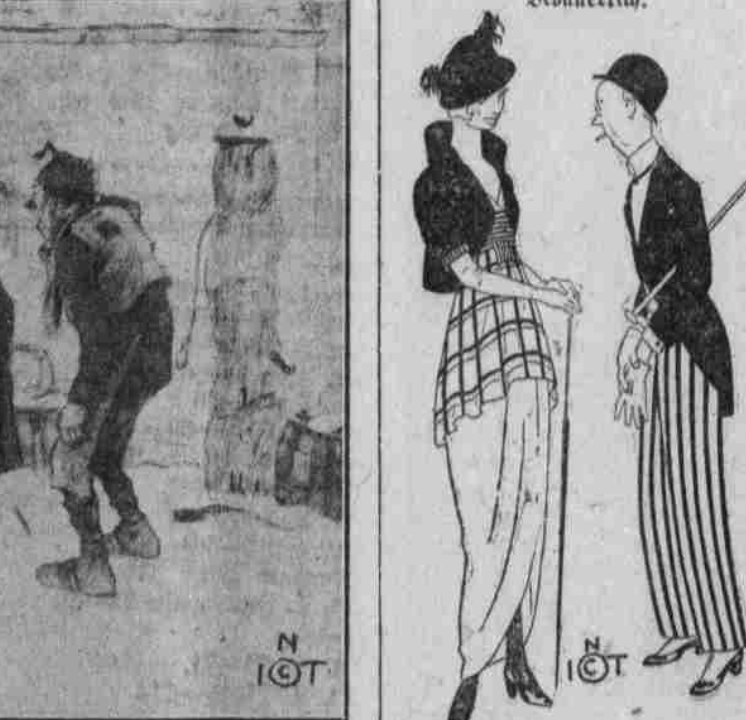
Witz: ... Wozze: ...