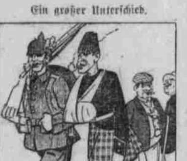
Ein großer Unterschied.