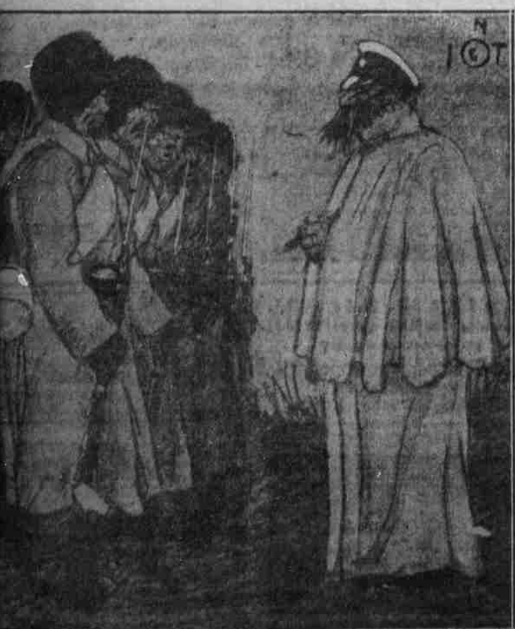
Witz: ... Wozze: ...