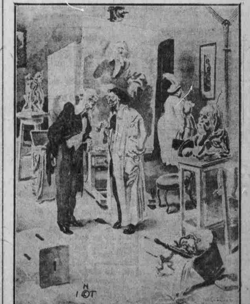
Witz: ... Wozze: ...