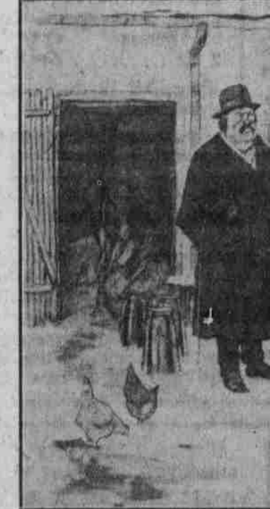
Witz: ... Wozze: ...