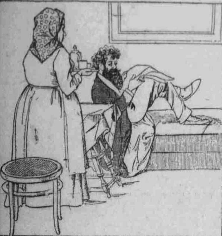
Witz: ... Wozze: ...