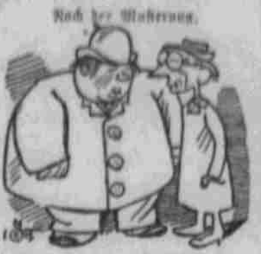
Nach der Witzzeitschrift.