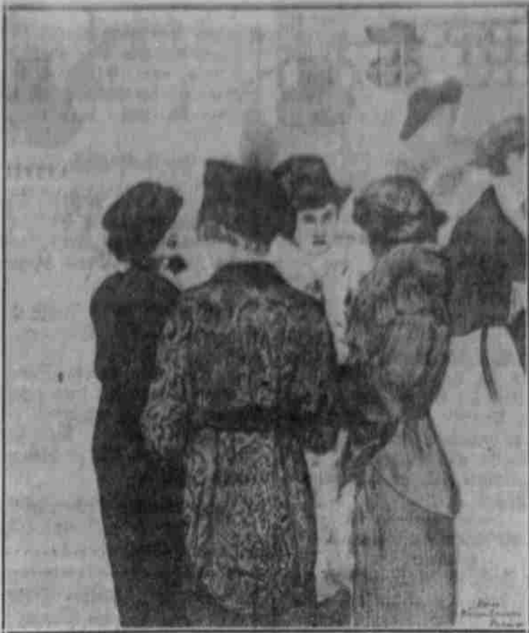
„Kommerzienrath's Valenta hat sich auch verlobt...“