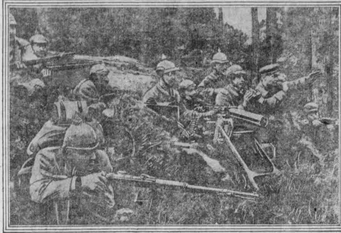
MASCHINGEWÄHR UND INFANTERIEDECKUNG