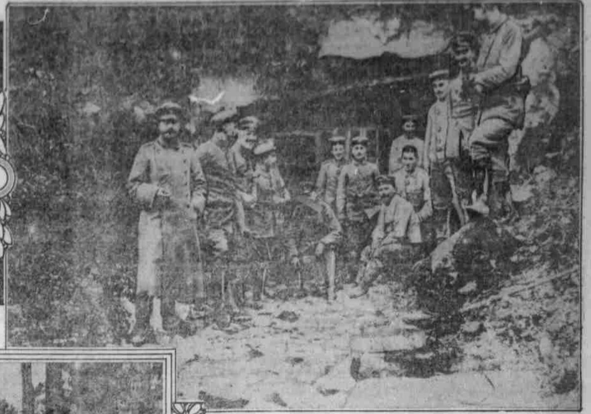
IM WALDE VERSTECKT