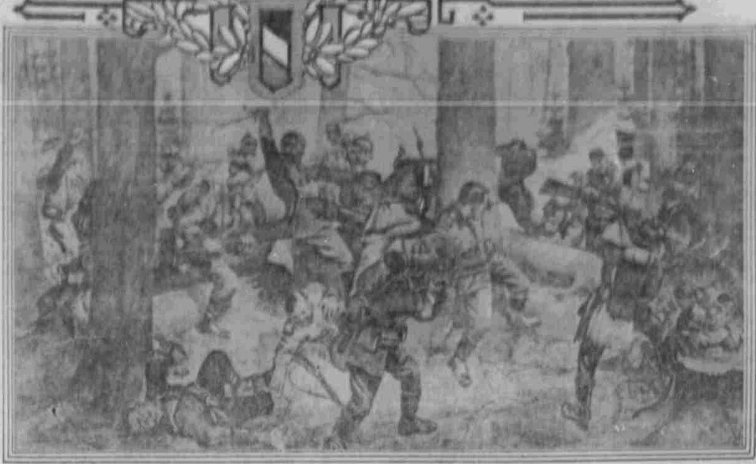
ERBITTERTE KÄMPFE IN DEN ARGONNEN.