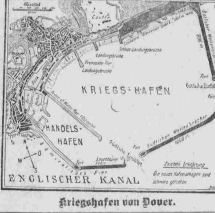
Kriegshafen von Dover.

Der Erfolg der britischen Admiralität, durch welchen die gesamte Nordsee als Kriegszone erklärt wurde, ist vom 3. November 1914 datiert und am selben Tage in der Londoner „Times“ veröffentlicht worden.