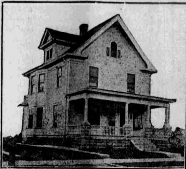
Verdichtungsansicht — nach einer Photographie