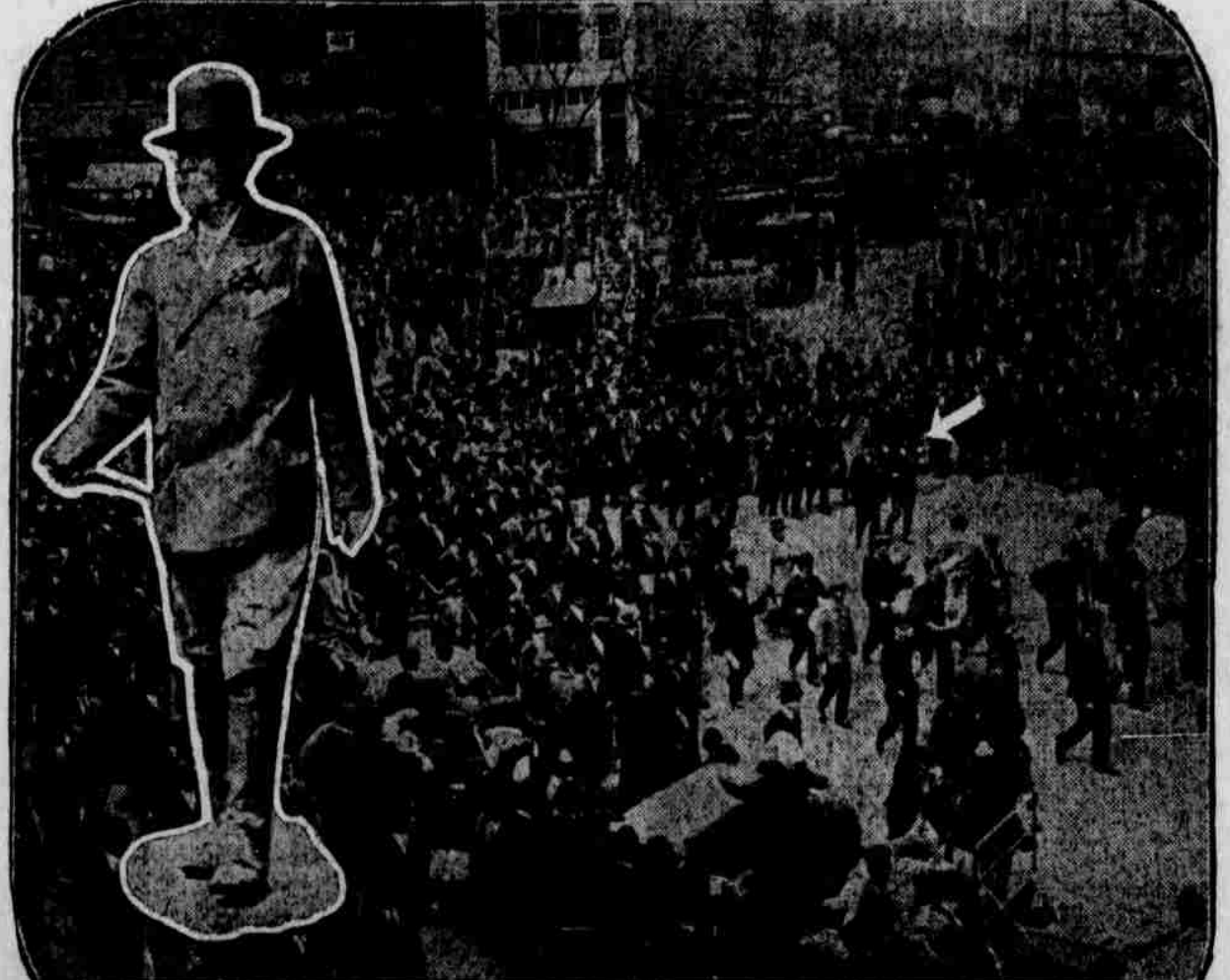
Edward P. Weston, welcher sich durch seine Dauermärche auszeichnet und dadurch zu einer Berühmtheit geworden ist, wird am 2. Juni seinen letzten Dauermarsch von New York nach Minneapolis antreten. Weston ist 75 Jahre alt; er gedenkt die 1500 Meilen weite Strecke binnen 60 Tagen zurückzulegen. Obiges Bild zeigt Weston (links) wie er den Dauermarsch von Philadelphia nach New York angetreten hat.

Der greise Dauermärcher Edward P. Weston.