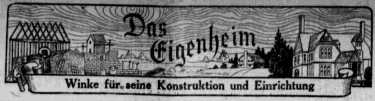
Winke für seine Konstruktion und Einrichtung

Unzerstörbares Holz. Es wird von einem in Südamerika wachsenden Baum gewonnen. Holz, das weder von Luft noch Regen, noch von Grundwasser oder dem Meerwasser angegriffen wird, wächst in Britisch-Guyana und in Venezuela. Es handelt sich um einen Baum, dessen Holz namentlich in England verwendet wird, wo es als „Greenheart“ bezeichnet wird. Eine amerikanische Fachschrift veröffentlicht dieses Holz angelegentlich zu verschiedenen Zwecken und teilt darüber mit: Der Baum wird etwa 100 Fuß hoch; die Krone steigt ziemlich hoch an, und die Stämme sind gerade wie Mastbäume; man kann daraus Balken von 16 Zoll im Querschnitt herstellen. Besonders zum Schiffbau und zur Küstenbauten soll das Holz ganz vortrefflich sein. Nach einem Forest Service-Circular haben Balken aus diesem Holz über hundert Jahre unter Wasser gelegen und sind vollständig gesund geblieben.