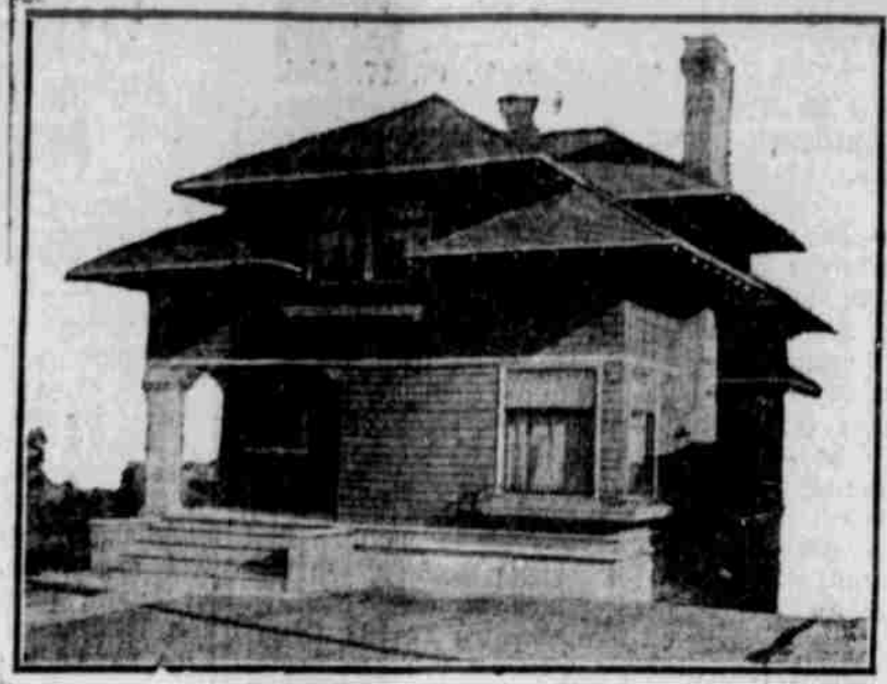
Perspektivansicht—nach einer Photographie.