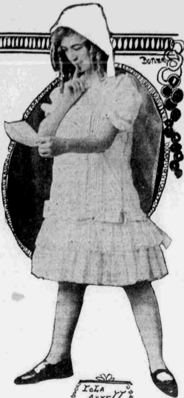
Lola Axell nächste Woche im Orpheum