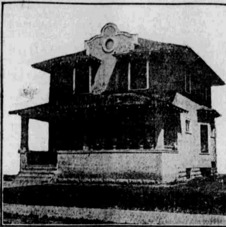
Ansicht aus der Ferne. — Nach einer Photographie.