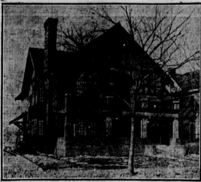
Ansicht aus der Ferne. — Nach einer Photographie.