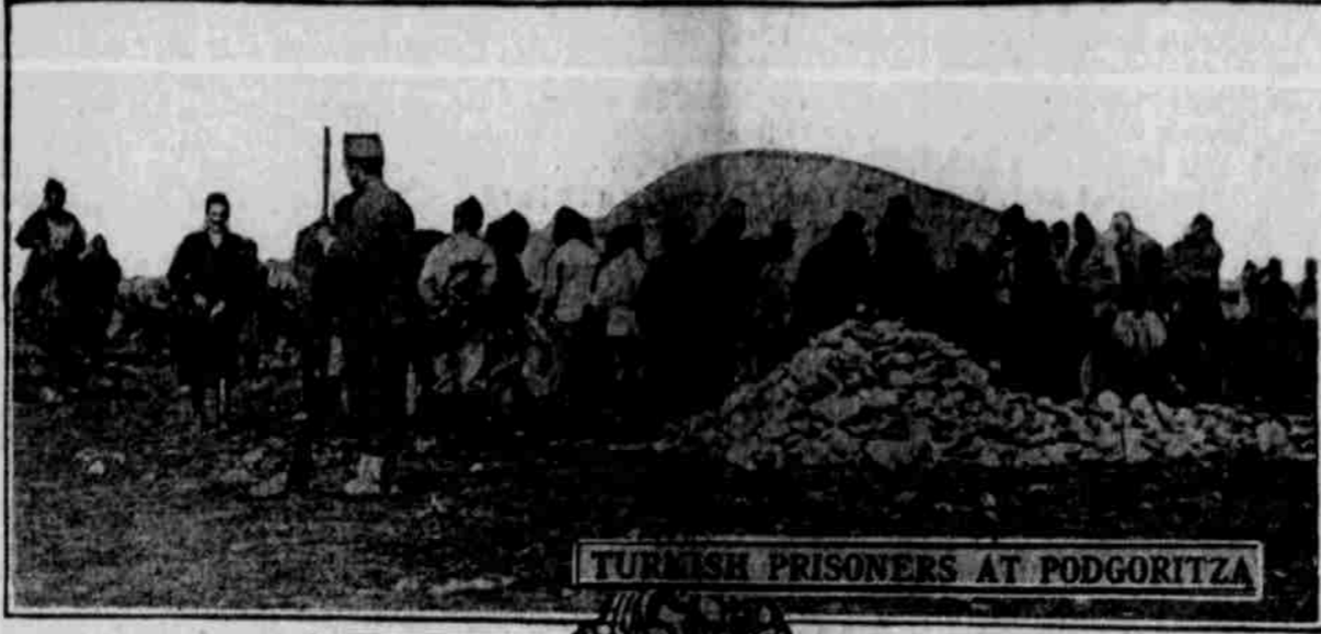
TURKISH PRISONERS AT PODGORITZZA