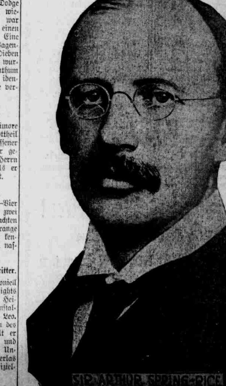
SIR ARTHUR SPRING-RICE

Sir Cecil Arthur Spring-Rice, bisher englischer Vertreter am Hofe zu Stockholm, Schweden, ist zum Nachfolger des von seinem Amte zurückgetretenen Gesandten James Bryce ernannt worden.