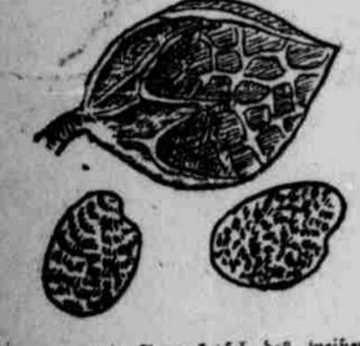
Blumen und Samenkapself des weichen Sülkleees.

Es ist für gewöhnlich nicht nötig, das Erdbreich für den Sülklee zu düngen, obwohl kaltpaltiger Kunstdünger wohl sein Wachstum fördert. In der Regel fährt man am besten, wenn man den Dünger für die Folgefrucht aufbewahrt. Die günstigste Saatzeit ist der Anfang des Frühjahrs, doch hat sich in Gegenden mit milden Wintern auch die Herbst-Aussaat als erfolgreich bewiesen, zumal da, wo man das Land nur für eine Saison mit Sülklee bebauen will. Die mangelhafte Wurzelentwicklung im ersten Herbst beeinträchtigt das Wachstum der Frucht in der nächsten Saison ganz wesentlich, und dadurch werden die übrigen Vorteile der Herbstsaat zum großen Teil auf-