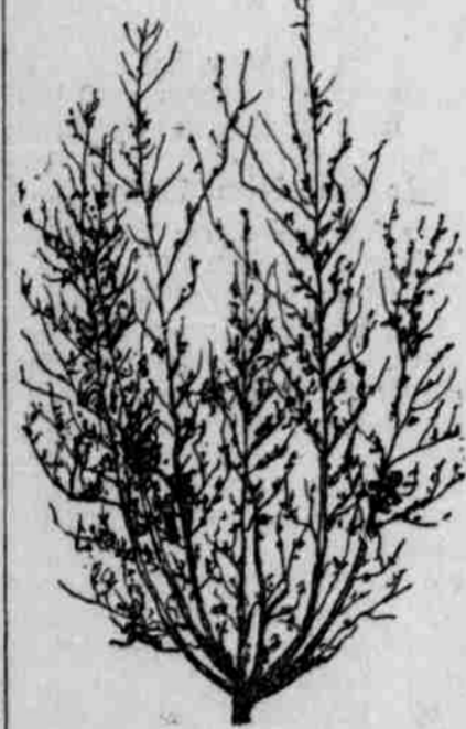
Sülklee-Pflanze gegen Ende der zweiten Saison.

es ratsam, den Sülklee allein auf einem gut vorbereiteten, also sehr festen Saatbett zu säen. Geschieht dies zu Anfang des Frühjahrs, so kann die Frucht im ersten Jahr von Schweinen oder Rindvieh abgeweidet werden, und im zweiten Jahr, wo sie sich zum größten Wachstum entwickelt, zuerst als Weide und später für Heu und Samen ausgenutzt werden.