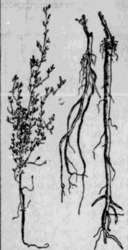
Sülklee-Pflanze und Wurzeln nach einjährigem Wachstum.

Höhe von 18 bis 20 Zoll und ist dann dem Alfalfa ähnlich. Im zweiten Jahr jedoch entwickelt sie sich bis zu einer Höhe von 5 bis zu 12 Fuß und zu größerer Breite, treibt zahlreiche Blüten und stirbt ab, sobald der Same gereift ist. Auch die Wurzel