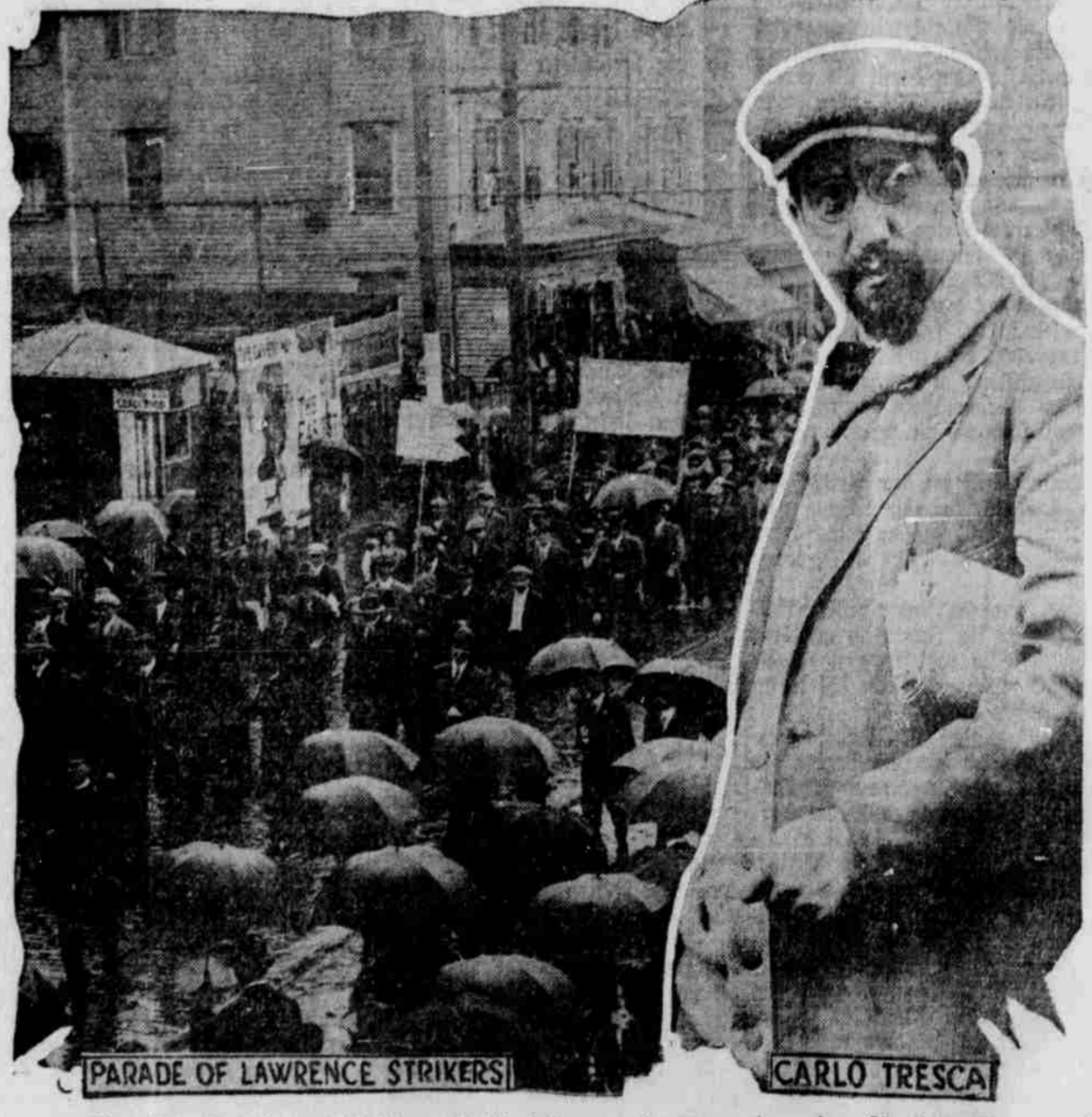
PARADE OF LAWRENCE STRIKERS CARLO TRESCA

Den Aravallen der ausländigen Textilarbeiter zu Lawrence ging eine Strafenparade voraus, an welcher sich Tausende beteiligten. — Einen neuen Organisator haben die Arbeiter jener Stadt in der Person von Carlo Tresca erhalten.