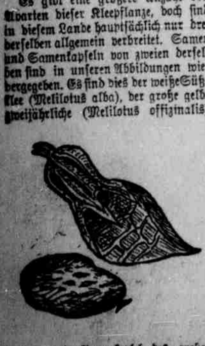
Blumen und Samenkapself des großen Sülkleees.

schönen gelernt, nachdem man die Erfahrung gemacht hatte, daß das Vieh sich an den bitteren Geschmack der Blätter und die zur Zeit der Reife ziemlich holzig werdenden Stengel gewöhnen lasse. Die Pflanze ist auch unter verschiedenen anderen Namen bekannt, wie Botbara-Klee, Bienenklee, Honigklee, Beraklee usw. Ihr Wert als gute Honigpflanze ist weit und breit bekannt, doch weniger allgemein ist die Kenntnis ihrer bodenverbessernden Eigenschaften, sowie der Wert ihrer Verwendung zu Weideweidern und als Heufutter. Nicht nur bereichern die Bakterien an ihren Wurzeln das Erdbreich, sondern die großen Wurzeln lockern auch den Boden, so daß die Luft gut hinein dringen kann.