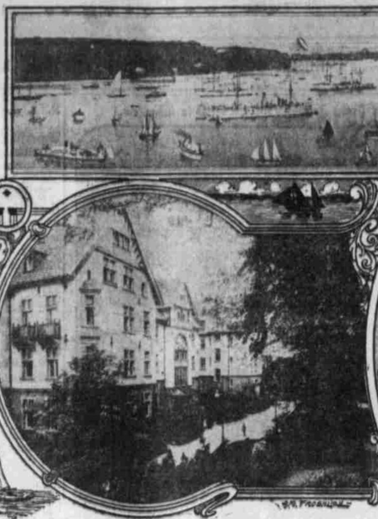
Logierhaus des Kaisers, Yachtclubs.