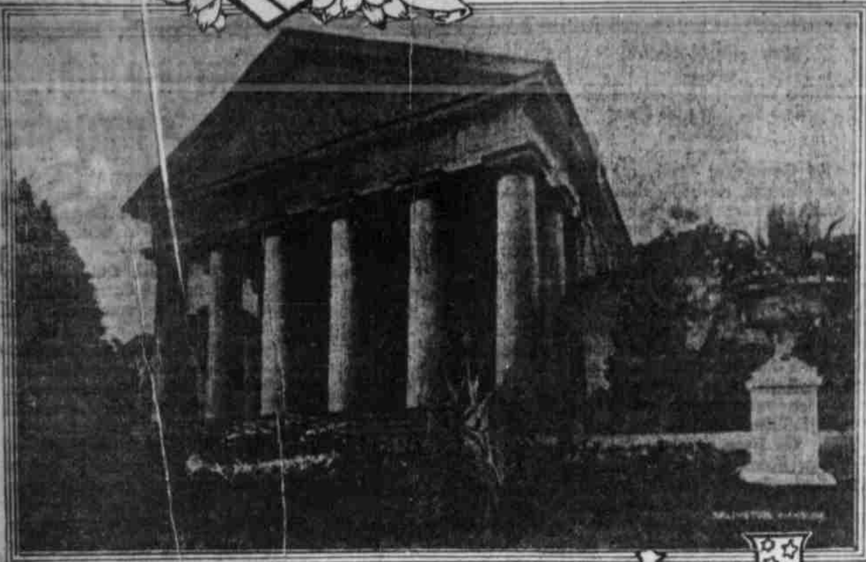
Arlington Haus (früheres Heim von Robert E. Lee)