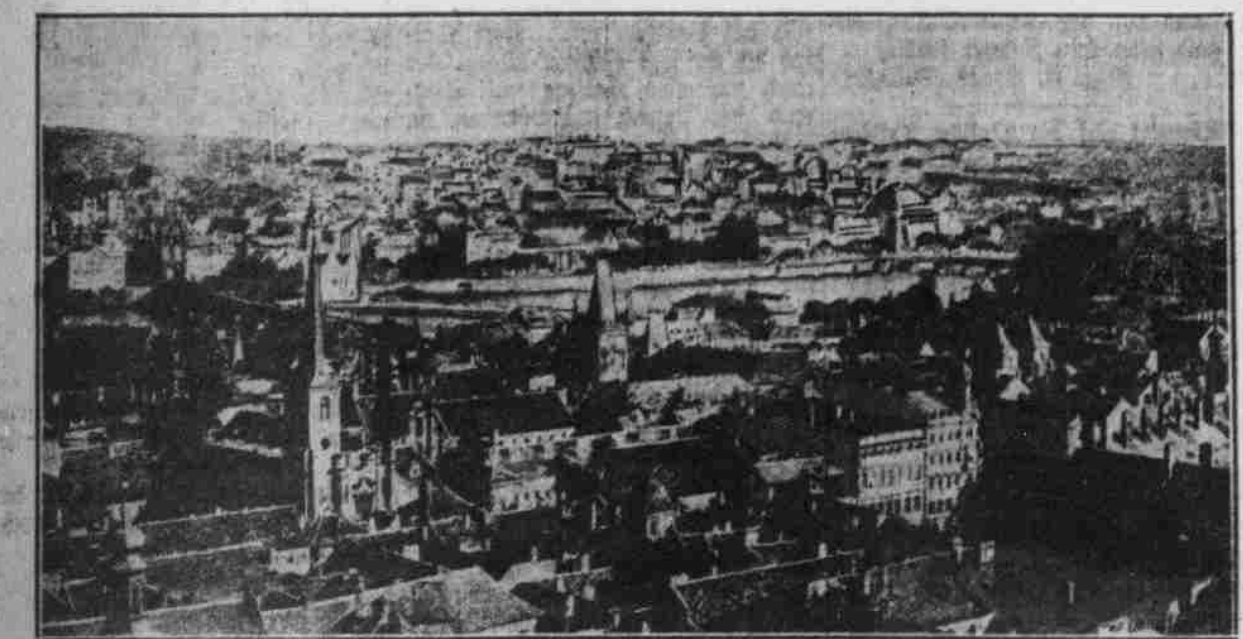
Blick auf Prag und die Wolban von der Prager Burg.

„Anfin, Mog...“ was soll der Wig nach kurzer Frist mit einem glänzenden Chapeau in der Hand zurückkehren.