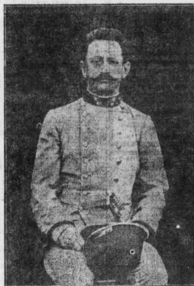
Generalstabsoberst Conrad v. Höpferdorff. Der Ober des österreichischen Generalstabs wird demnächst verabschiedet.