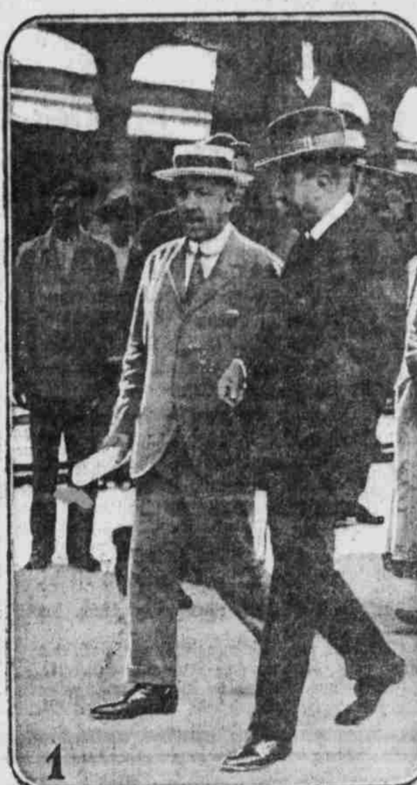
Zwei Delegaten der Regierung in der Stadt Mexiko zu der Friedenskonferenz in Niagara Falls, Ontario.