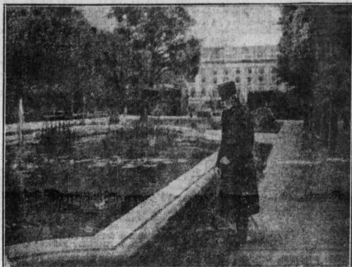
Kaiser Franz Josef beim Spaziergang.