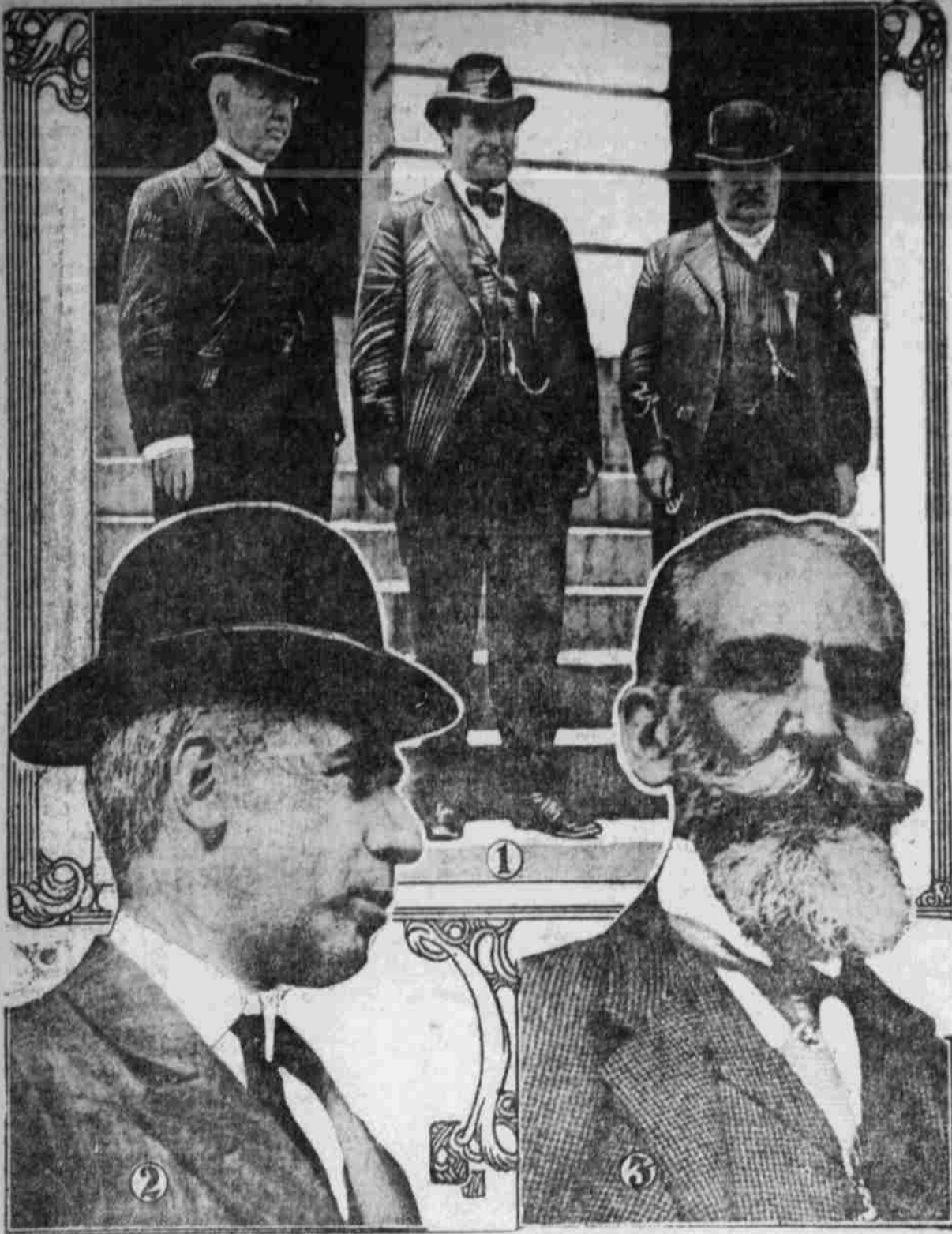
1. Oberbundesrichter Lamar, Staatssekretär Bryan und Lehmann. Lamar und Lehmann sind die von Präsident Wilson ernannten Vertreter der Regierung der Vereinigten Staaten vor den Friedensvermittlern. 2. Gesandter Mason von Argentinien, einer der Friedensvermittler. 3. Gesandter Suarez von Chile, ebenfalls einer der Friedensvermittler.

Zur Eröffnung der Konferenz der Friedensvermittler in Niagara Falls, Canada.