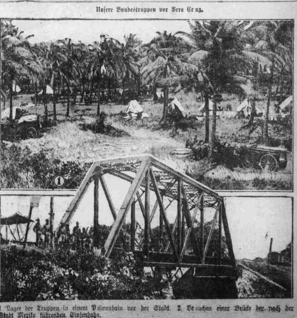
1. Lager der Truppen in einem Palmenhain vor der Stadt. 2. Die ersten einer Brücke der nach der Stadt Mexiko führenden Eisenbahn.