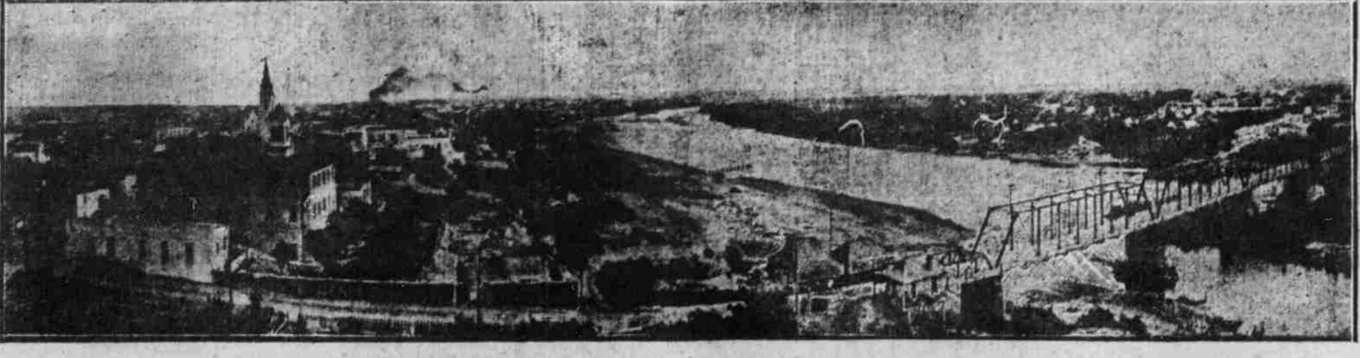
Carabo (Texas), die internationale-Brücke und das von den Querristen geführte Rucos Carabo (Mexiko).