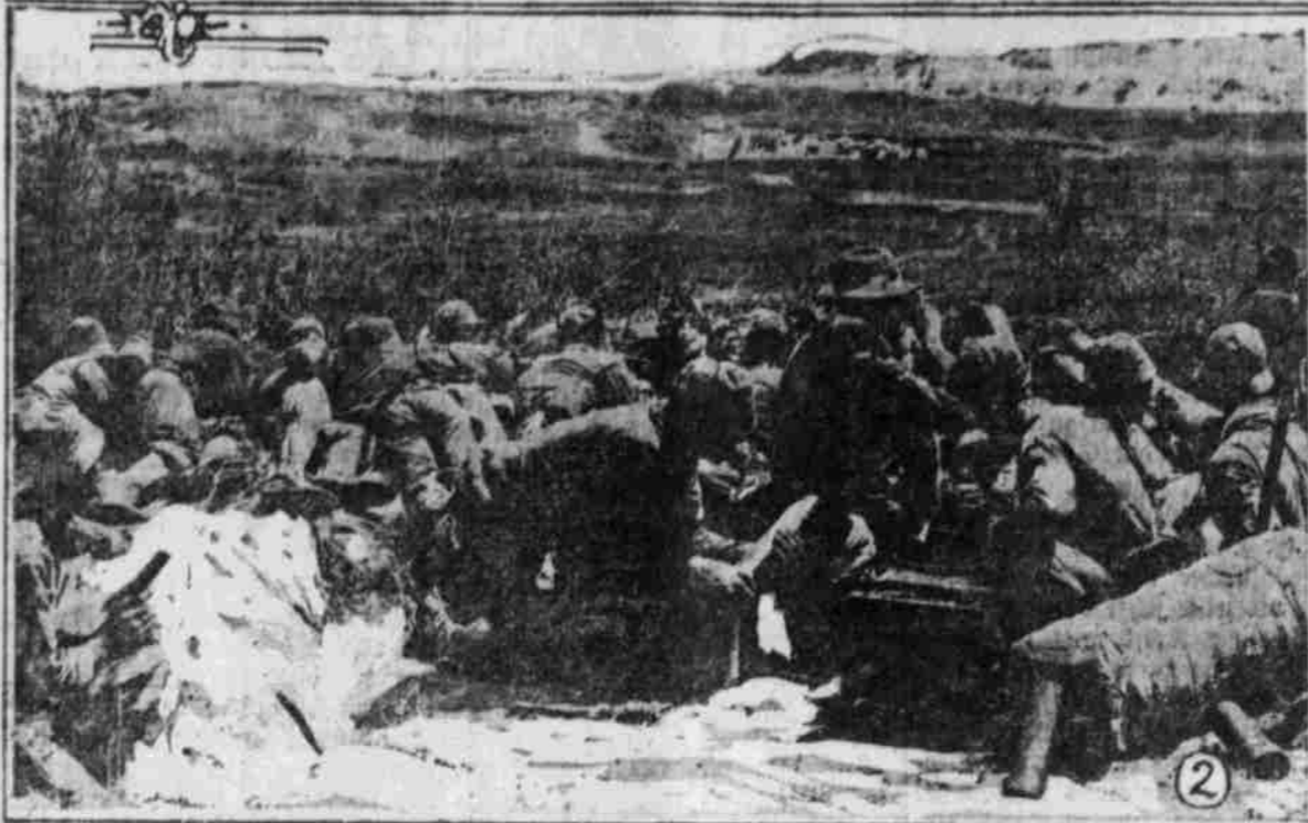
Da es hier, daß die Mexikaner die Wasserwerke bei Vera Cruz angreifen würden, warf Gen. Funston eine Abteilung Truppen dorthin und ließ Verdächtigungen aufwerfen. Das untere Bild zeigt amerikanische Marinetruppen in den Vororten von Vera Cruz.