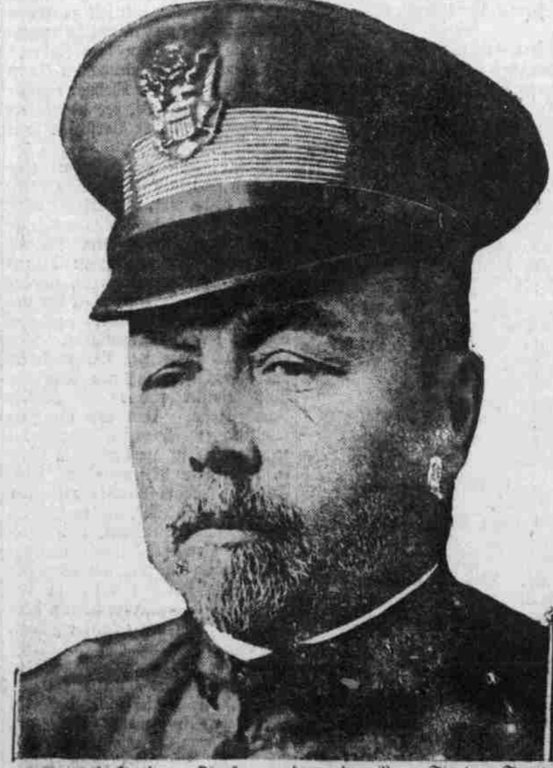
General Funston, Oberkommandeur der Ver. Staaten Truppen in und um Vera Cruz, ist dort der rechte Mann am Platz. Man erwartet von ihm, daß er im Falle einer Kriegserklärung sofort zum Angriff übergehen und die Mexikaner zu Varen treiben wird. Auf den Philippinen hat er sich den Ruf eines umsichtigen und kühnen Generals erworben.