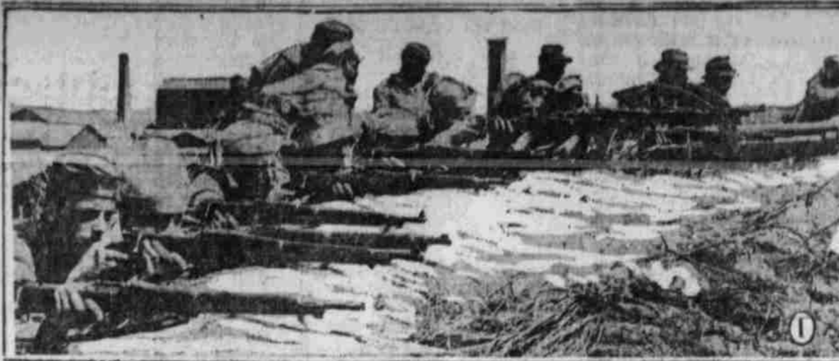
Marinetruppen bei den Vera Cruz, Waffe werfen.