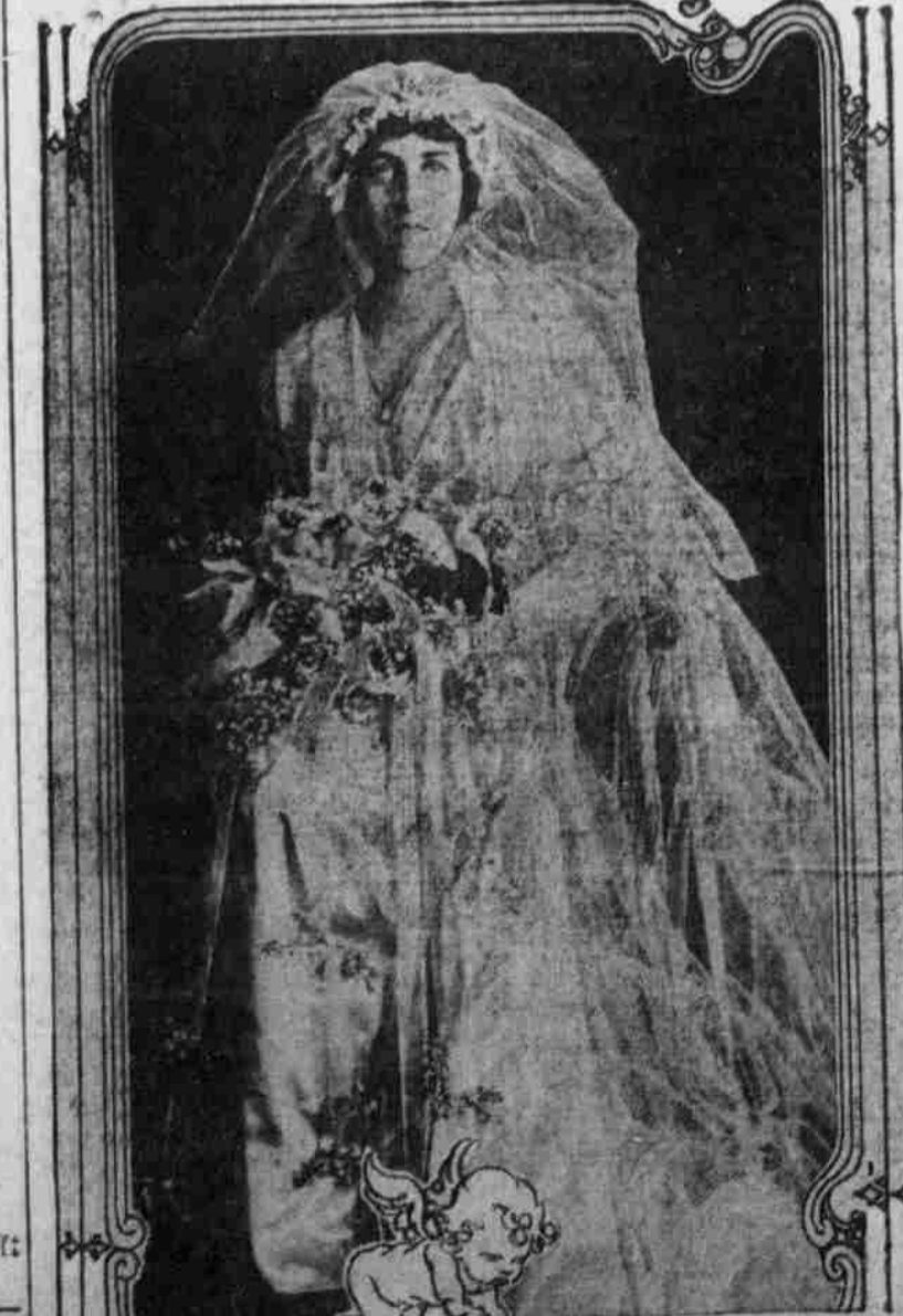
Die jüngste Präsidententochter im Brautschmuck.

Marktbericht. Süd-Omaha, 8. Mai. Mittelw. — Zufuhr 217. Markt fest. Gute bis beste Vöhrlinge, 8.30— 89.00 Gute bis beste $8.25—9.00.