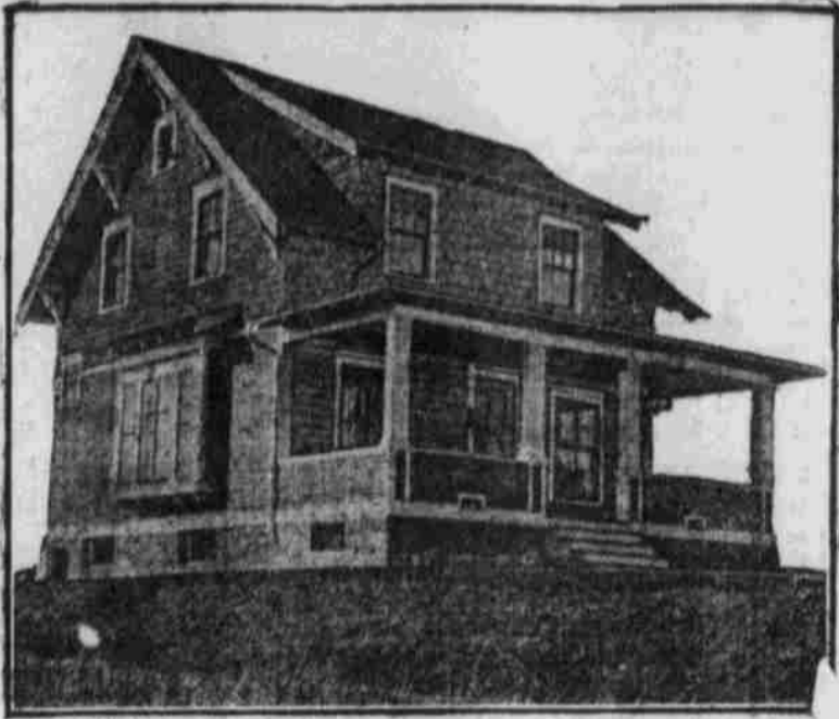
Ansicht aus der Ferne. — Nach einer Photographie.