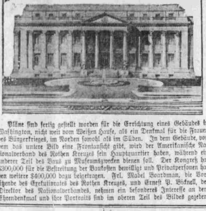
Pläne sind fertig gestellt worden für die Errichtung eines Gebäudes in Washington, nicht weit vom Weißen Hause, als ein Denkmal für die Frauen des Bürgerkrieges.