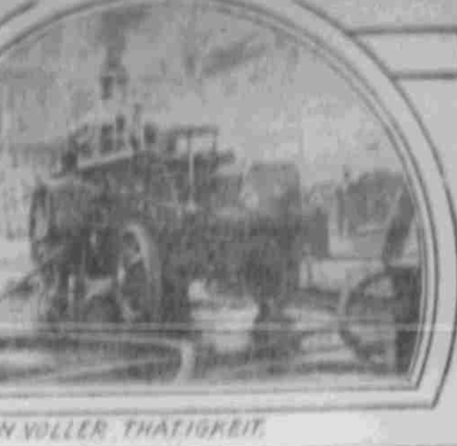
IN VOLLER THÄTIGKEIT.