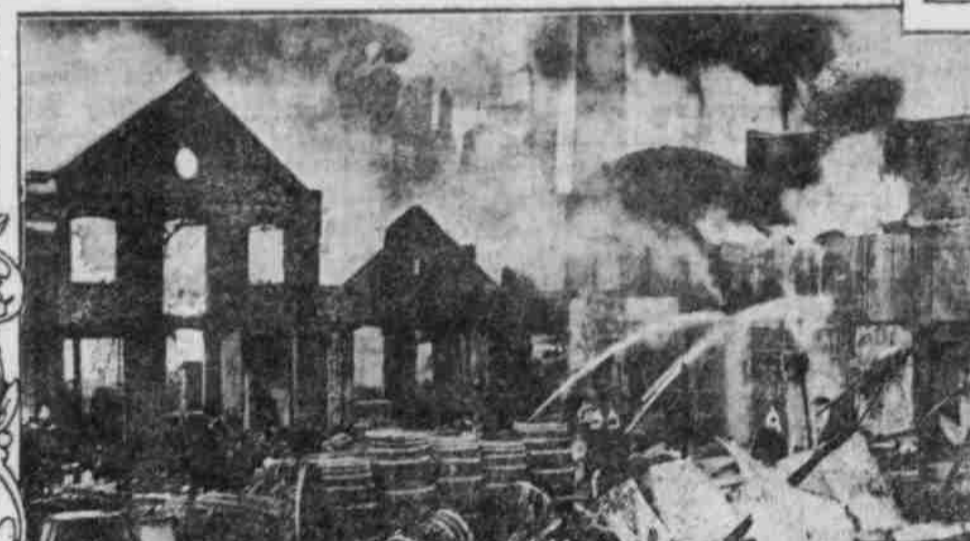
GROSSFEUER IN LONDON.