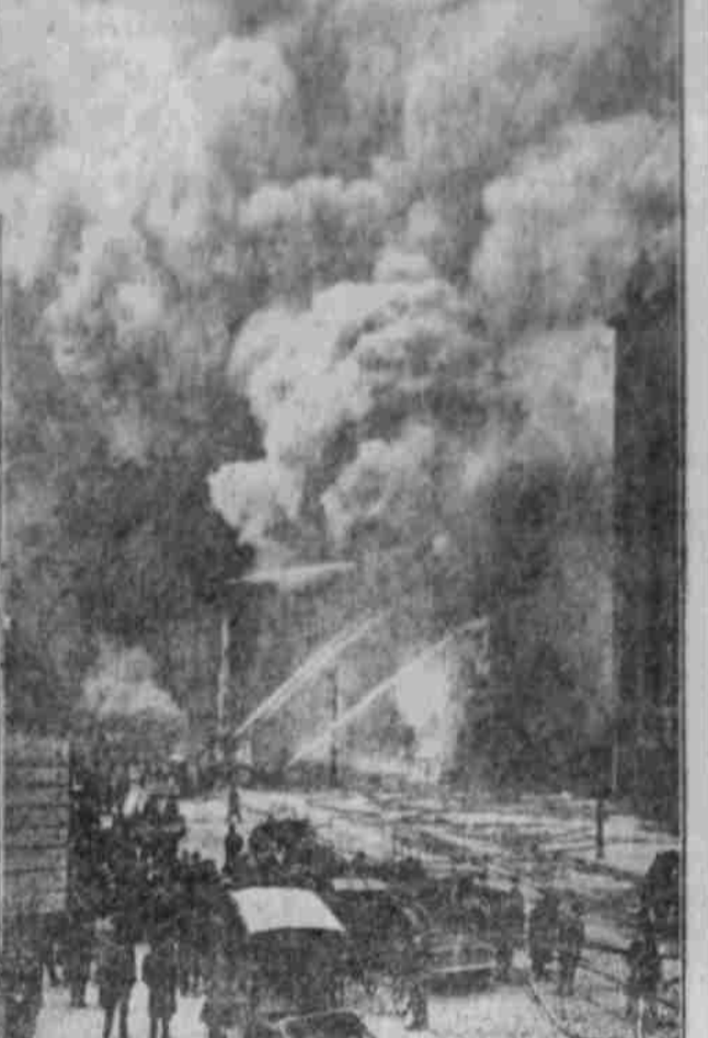
NEW YORKER FEUERWEHR BEI RIESENBRAND.